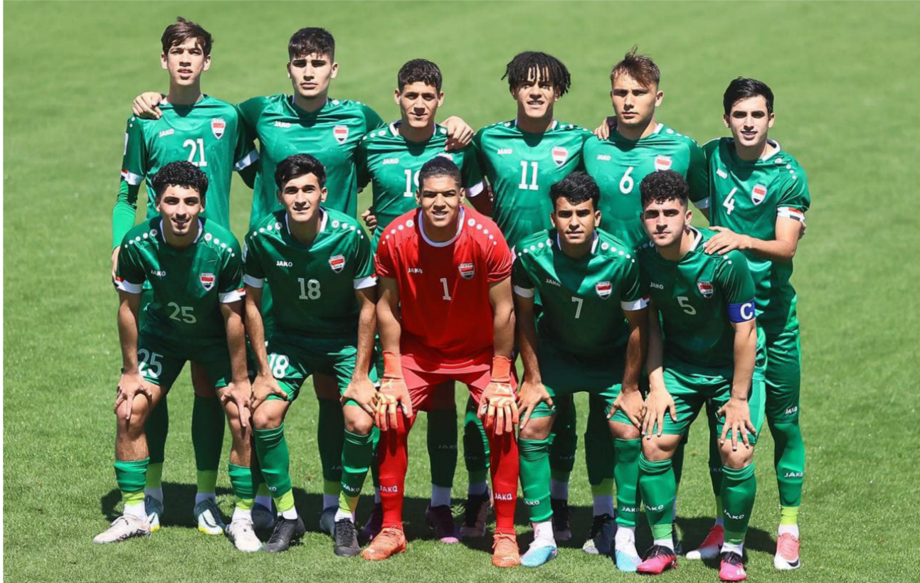
منتخب الشباب لكرة القدم