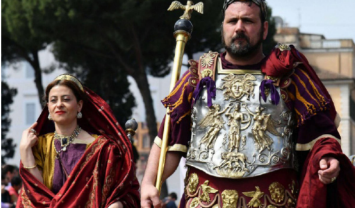
ويحسب كتاب "معالم من التاريخ الروماني السياسي والاجتماعي والاقتصادي والعسكري" للمؤرخ روي أن رحلة إينياس من طروادة (مع مساعدة من أفروديت) أدت إلى تأسيس مدينة روما.

داوود قندولي فإنه لم يكن هناك اتفاق على تاريخ ثابت لتأسيس مدينة روما. إذ كان يتراوح بين أعوام 753 و729 ق.م. ولم يتفق على تاريخ ثابت وهو 753 ق.م. إلا منذ القرن الثالث قبل الميلاد. وحول نشب تأسيس روما إلى إينياس. ويوضح الكتاب أن علماء التاريخ ذكروا أن طروادة سقطت وفقاً للحساب الحديث نحو عام 1184 ق.م. أي في أوائل القرن الثاني عشر قبل الميلاد. في حين أن علماء التقويم الرومان جعلوا تأسيس روما يقع حوالي 753 ق.م. وهو تاريخ لم يكن ثابتاً أو محدداً في البداية ولو أنه كان يتراوح بين تواريخ كلها تقريبا في القرن الثامن قبل الميلاد. ويحسب كتاب "معالم من التاريخ الروماني السياسي والاجتماعي والاقتصادي والعسكري" للمؤرخ روي أن رحلة إينياس من طروادة (مع مساعدة من أفروديت) أدت إلى تأسيس مدينة روما.