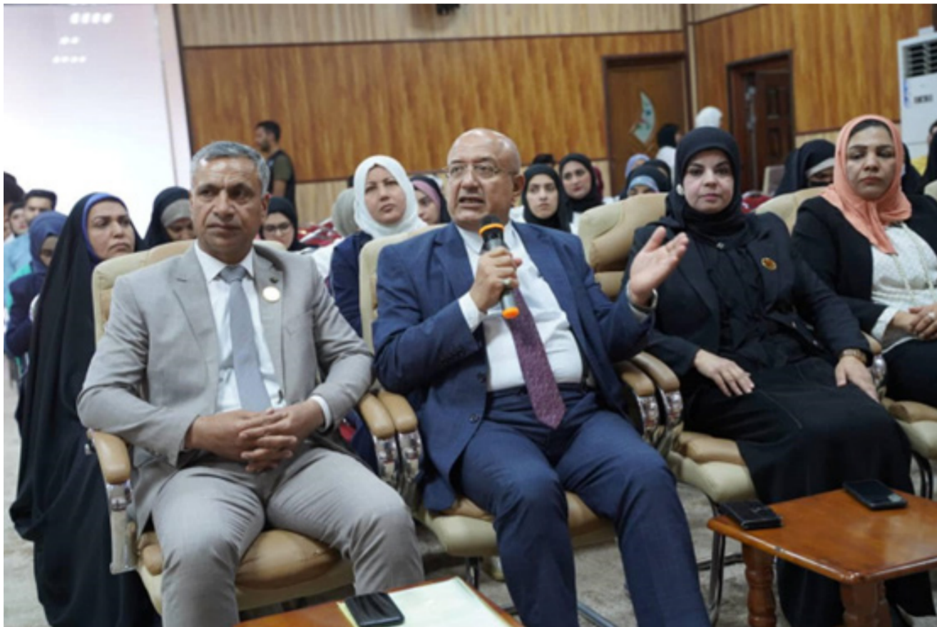
ورشة دور الجامعات العراقية في مواجهة تغيرات المناخ وتداعياته

طرق وأساليب ومناهج التعامل مع الأزمات وإدارتها وإيجاد حلول مثالية، والتخلص من أي أثر سلبي لها وجاؤز الأزمة مع إيجاد فرص تجعل من الأزمة نفسها عاملاً إيجابياً للمؤسسة، ونوه إلى ان الدورة جاءت لتمكين المتدربين من مهارات إدارة الأزمات، ورسم وتنفيذ خطط تناسب مع المؤسسات وأهدافها العامة من خلال التعرف على الأزمات والتنبؤ بها قبيل ظهورها وتحليل الأزمات إلى عوامل أولية، ورسم مخطط لها لتسهيل التعامل معها ووضع خطط احترازية للتعامل مع الأزمات مع تنفيذ خطط احتواء الأزمات باخترازية عالية من أجل حلول مثمرة للتخلص من الأزمات.