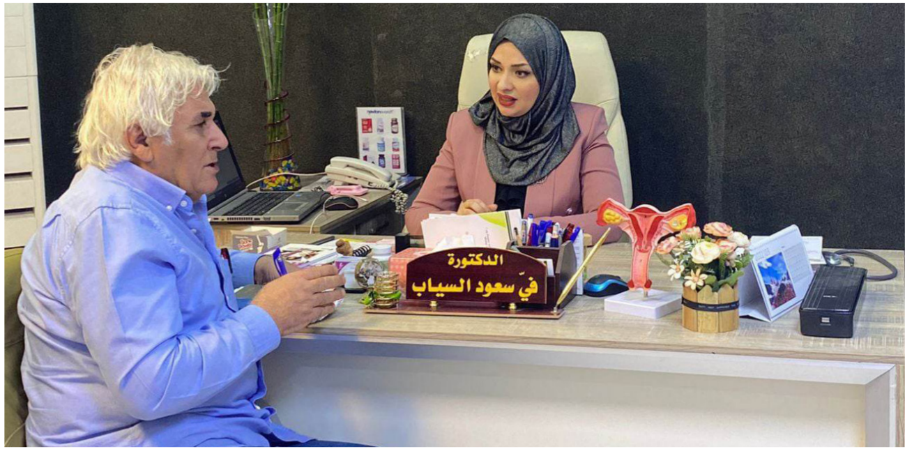
الدكتورة في السياب تتحدث عن الأكل بعد رمضان

يؤكد الأطباء وخبراء التغذية، إن صيام شهر رمضان يشكل فرصة حقيقية لبلوغ مجموعة من الأهداف الصحية، التي يصعب تحقيقها على مدار العام، خصوصاً في حال اتباع نظام غذائي صحي ومتوازن، والذي ينعكس إيجاباً على صحة القلب ومستوى ضغط الدم، ويعزز جهاز المناعة ويفيد الجهاز الهضمي وأن الإفراط في تناول الطعام بعد رمضان يرهق الجهاز الهضمي وبالتالي يزداد خطر التعرض لأنواع من الأم المعدة والغثيان. عن هذا الموضوع قالت الدكتورة الاختصاصية في البصرة / مستشفى الموانئ العام: بعد شهر رمضان الكريم، يمكن أن يكون من الصعب التخلص من بعض العادات التي قد تكون قد تشكلت خلال هذا الشهر، مثل تناول الطعام بكميات كبيرة وتناول الأطعمة الغنية بالدهون والسكريات، ولكن يمكن اتباع الخطوات التالية للعودة إلى نمط غذائي صحي بعد رمضان ومنها: