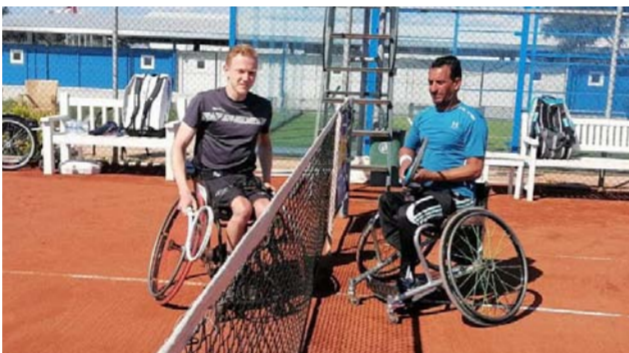
قبل إحدى مباريات تنس البارالمبية في تركيا