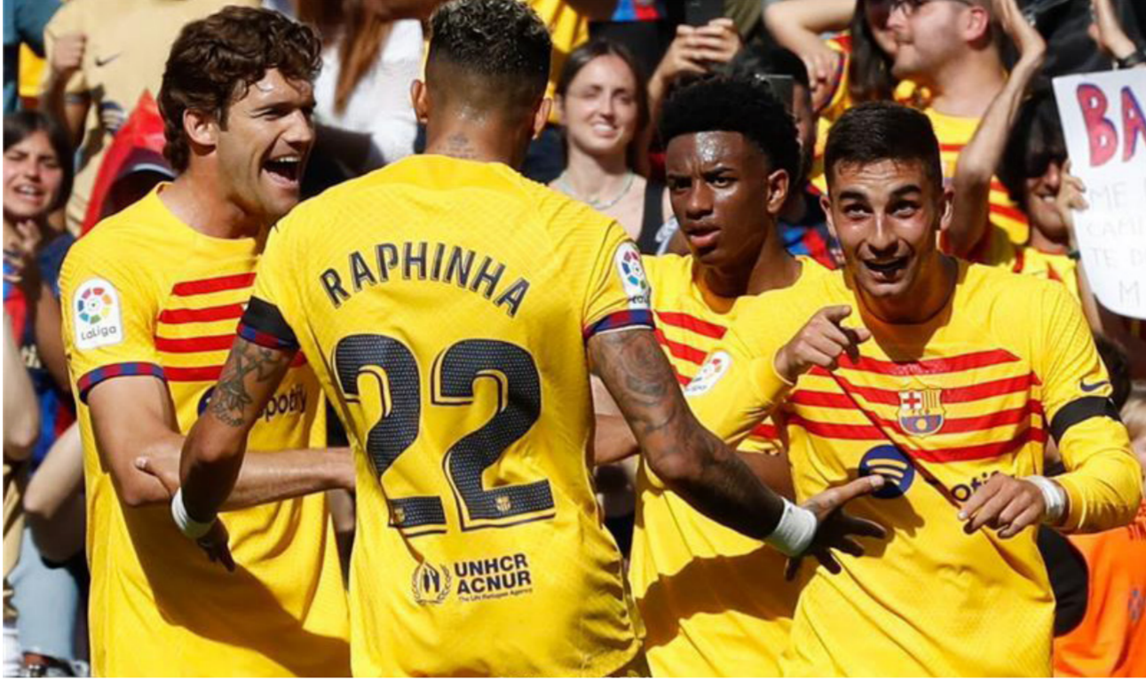
برشلونة يحقق الفوز ويواصل التفوق في الليجا

إلى ذلك، استعاد مارسيليا المركز الثاني من لانس بفوزه القاتل والثمين على ضيفه ليون (1-2) مساء أول أمس في ختام المرحلة الثانية والثلاثين من الدوري الفرنسي.. وكان مارسيليا البائد بالتسجيل عبر مهاجمه الدولي التركي جنكيز أوندير في الدقيقة 44. لكن القائد المحضرم ألكسندر لكارزيت أدرك التعادل لليون في الدقيقة 68. قبل أن يفضّل الفريق الجنوبي هدف الفوز بفضّل النيران الصديقة عندما حاول المدافع العاجي سينالي ديوماندي إبعاد كرة عرضية من أمام المرمرى فارتدت من زميله مالو جوستو إلى الشباك (2:0).. وكان لانس انتزع المركز الثاني مؤقتاً أمس السبت بفوزه الكبير على ضيفه مونكو بثلاثية نظيفة.. ورفع مارسيليا رصيده إلى 67 نقطة بفارق نقطة واحدة أمام لانس و8 نقاط خلف باريس سان جيرمان المتصدر فيما مني ليون بخسارته العاشرة هذا الموسم والأولى بعد 3 انتصارات متتالية فتجمد رصيده عند 50 نقطة في المركز السابع.