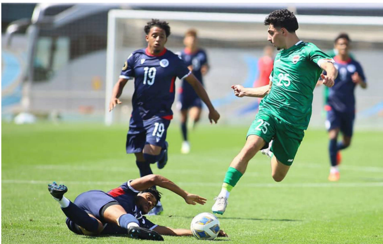
جانب من مباراة منتخبنا الشباني أمام الدومنيكان

يشار إلى ان الجوية يقف في صدارة ترتيب الدوري وله 48 نقطة متفوقا على وصيفه الشرطة بفارق الأهداف.