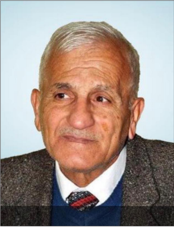
الأديب والناقد والراحل شكيب كاظم

وقال الكاتب والصحافي حمدي العطار إن مدرسة في الصحافة والنقد والتراث ومنجزه بنطوي على التنوع والفكر والأدب، كما له إسهامات في