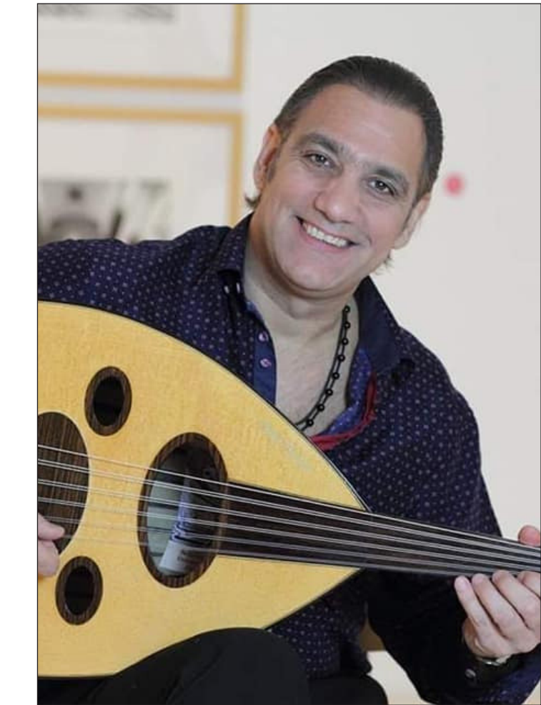
الموسيقيار العالمي عمر منير بشير

* في الحانك، مهرجاناتك، حفلاتك، اين يقف وطنك العراق في كل هذا؟ العراق موجود في كل الحاني، في عروقي، في دمي، أنا لُحنت نحن«بغداد تودّع شبابها