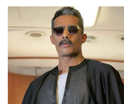
عيد الفطر المبارك. ويشركه البطولة بجانب مي عسر. عدد من نجوم مسلسلها الرمضاني "جعفر العمدة" مثل مي كساب. وأحمد داش. بالإضافة إلى الفنان محمود حميدة، والفيلم

من تأليف محمد سامي وإخراج محمد سمير. وينتهي فيلم "هارلي" أسطورة الأسفلت" لنوعية الأكشن والحركة والرومانسية. ويجسد فيه رمضان. دور مهندس يدعى "محمد هاشم" ويلقب بـ "هارلي" يعود من الخليج مع عائلته. لاستكمال دراسته في مصر ويقوده ذكاؤه في العمل إلى الانضمام إلى إحدى العصابات. ليصبح العنصر الأبرز فيها. ويتم تكليفه بتنفيذ عدة مهام. وأكد رمضان أن الفنانة هي عمر قامت بأداء مشاهد الأكشن بنفسها دون الاستعانة بدوبليج. وكان رمضان طرح فيديو كليب أغنية "يا صلاة الزين" من فيلم "هارلي" على قناته الرسمية على يوتيوب وحمل طابع أغاني الرب. وعلق على حسابه على تويتر قائلا: "أغنية يا صلاة الزين من فيلم هارلي. عيد الفطر".