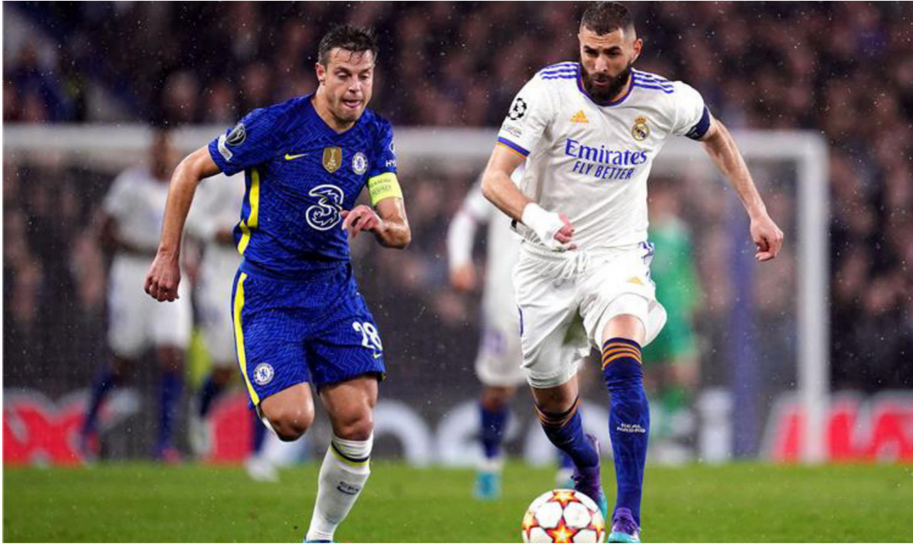
جانب من لقاء سابق لريال مدريد وتشيلسي

يذكر أن الفرنسي بنو باديشيلي لاعب تشيلسي، الذي يمكن أن يلعب بديلا لكوليبالي غير مقيد في البطولة الأوروبية، بعد أن قرر البلوز استخدام الأماكن الثلاثة المتاحة في بنابر/كانون الثاني لقيده جواو فيليكس وميكاييل مودريك وأنزو فرناندز. ويعد تاجو سيلفا وبوسالي فوفانا هما الخياران متاحين لقيادة دفاع البلوز خلال المواجهة المصرية أمام ريال مدريد.