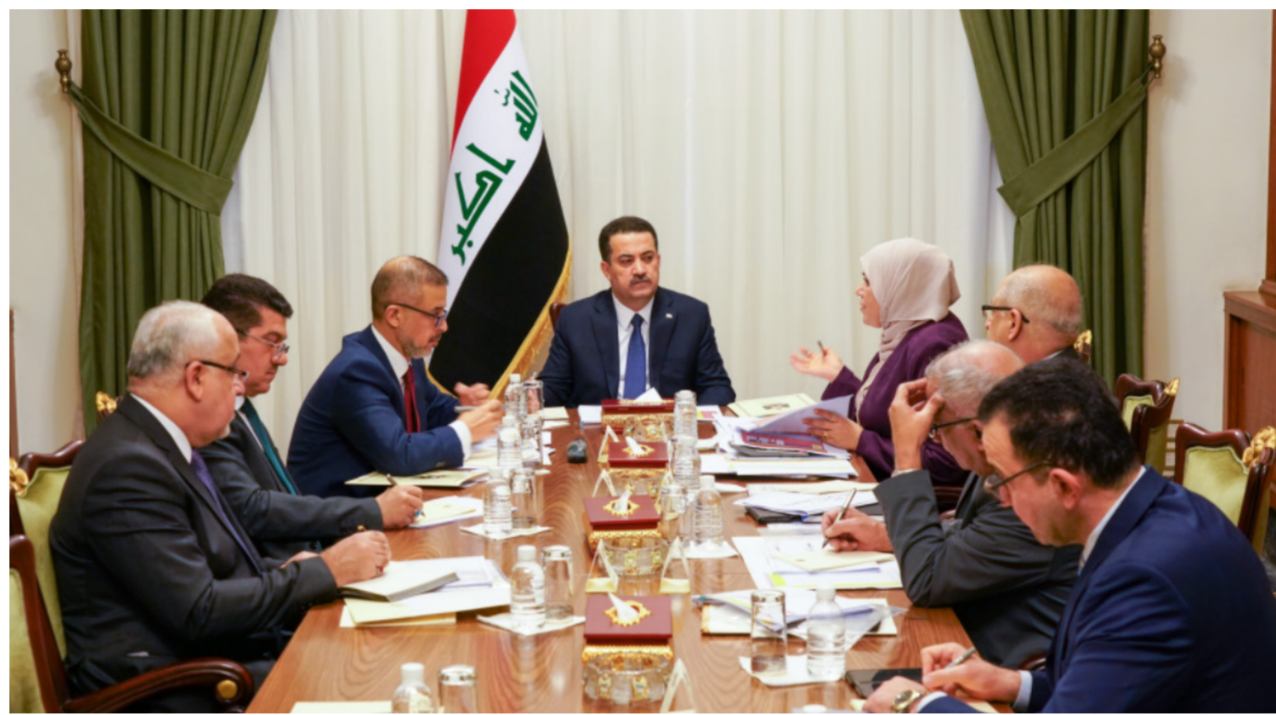
أثناء المناقشات الأولية للموازنة «أرشيف»