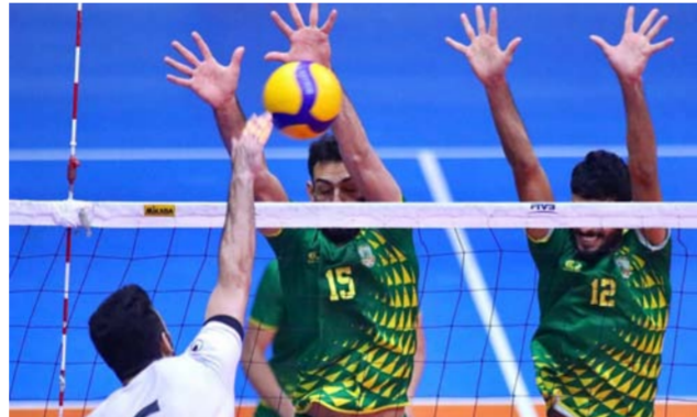
دوري الكرة الطائرة

بغداد - الصباح الجديد: بعد النجاحات التي حققها الاخاد المركزي لكرة السلة في التنظيم الناجح للدوري العراقي الممتاز وبشهادة الجميع والنتائج الأخيرة في تحقيق ذهبية البطولة العربية 3*3 والفوز بالمركز الأول على مجموعته بنصفيات بطولة آسيا للمنتخبات. عمل الأخاد المركزي لكرة السلة على مفاخة دولة رئيس مجلس الوزراء المحترم محمد شياع السوداني برغبة الأخاد تحقيق إنجازا آخر مهم وهو كسر الحصار الرياضي على بغداد. ومفاخة ايضا الأخاد الاسيوي للعبة بتنظيم نهائيات اندية آسيا بكرة السلة في العراق والتي ستشارك فيها اندية الصين واليابان وكوريا والفلبين ولبنان والخليج اضافته الى احد الاندية