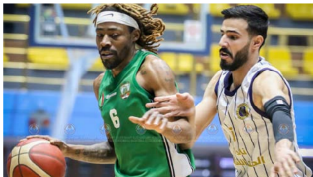
من منافسات دوري كرة السلة الممتاز

العراقية حيث تمت موافقة دولة رئيس الوزراء محمد شياع السوداني برغبة الأخاد تحقيق بالكمال وحمل كافة التكاليف الرياضية المصاحبة لهذه البطولة. والوزراء هو مفتاح نجاح البطولة. من جانب اخر وصلت الموافقة المبدئية من الأخاد الاسيوي