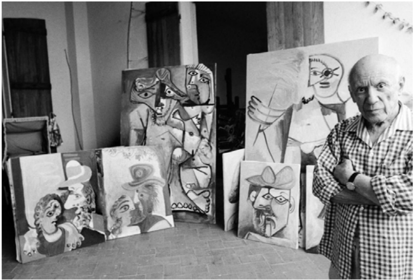
بيكاسو في محترفه في مويج جنوبي- شرقي فرنسا

بشكل عام، يعتبر «فن اللامبالاة» كتاباً مفيداً ومهماً يساعد القراء على تحسين حياتهم وحقيق السعادة الحقيقية عن طريق تغيير النظرة الشخصية والتركيز على الأمور الحقيقية التي تستحق الاهتمام.