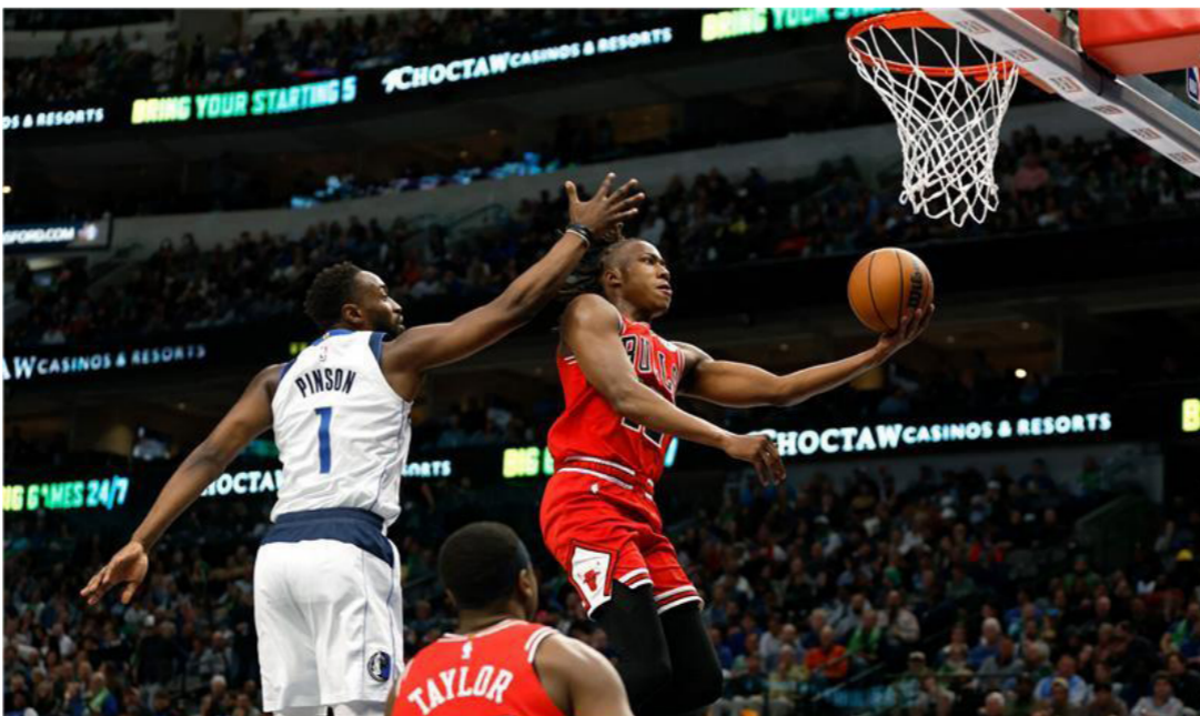
دوري السلة الأميركي

ريودي جانيرو - وكالات: أعلنت إدارة نادي فلامنجو تعيين الأرجنتيني خورخي سامباولي مدربا جديدا خلفا للبرتغالي فيكتور بيريرا، الذي أقبل من منصبه للتألق الماضي وأكد النادي الأكثر شعبية في البرازيل، في بيان له على الشبكات الاجتماعية: «يعلن فلامنجو أنه وقع عقدا مع المدرب خورخي سامباولي ليقود الفريق الأول حتى 31 ديسمبر/كانون أول 2024».