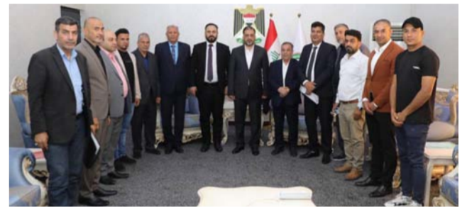
المبرقع يتوسط رياضيي السماوة