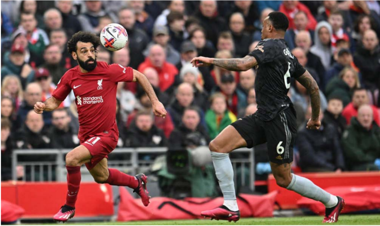
صلاح ضد أرسنال

آخر بداية منذ موسم (2016-2017)، بتسجيل 9 أهداف وصناعة 3 آخرين في 13 مباراة، وذلك وفقاً لأرقام «سكواكا». على جانب آخر حافظ بورجن كلوب. مدرب ليفربول. على سجله الحالي من الهزائم على ملعبه أنفيلد أمام أرسنال في البريميرليج، بتعادل في مباراتين الفوز في 6 لقاءات، ومنذ ظهوره الأول في البريميرليج، صنع ترينت ألكسندر آرنولد أهدافاً أمام أرسنال (6)، أكثر من أي لاعب آخر في المسابقة.