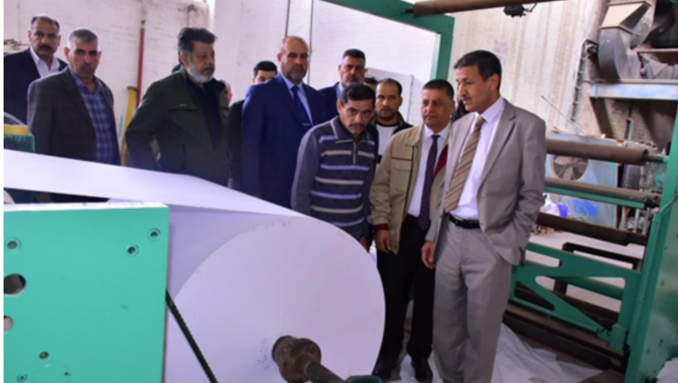
مدير عام البتروكيماويات يتابع ميدانيا تشغيل الخطوط الإنتاجية لمصنع الورق

بمحافظة والذي انشأ في بداية سبعينيات القرن الماضي.