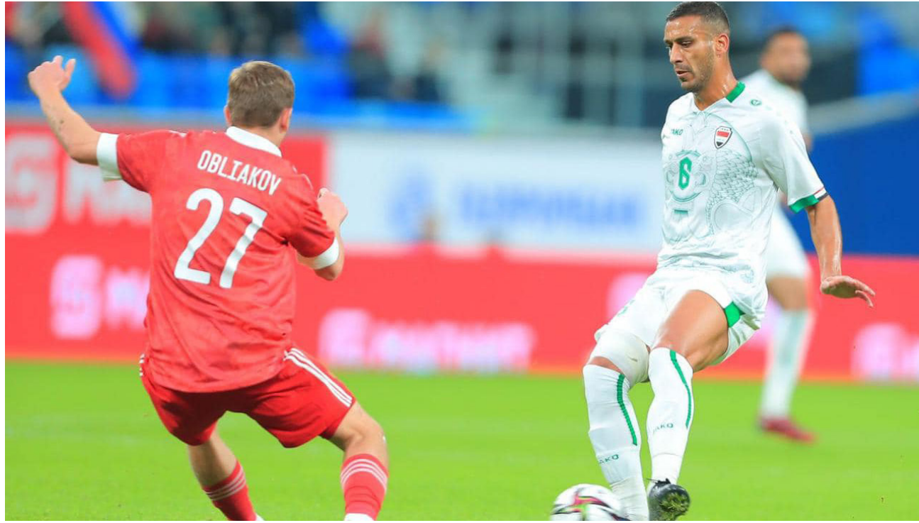
جانب من لقاء منتخبنا الوطني الودي امام روسيا

أعلن الاتحاد الدولي لكرة القدم «فيفا»، عن تصنيف المنتخبات الوطنية لشهر نيسان الحالي، وأرقي المنتخب الوطني العراقي مركزا واحدا في تصنيف «فيفا»، حيث احتل المركز الـ 67 برصيد 1347.84 نقطة، وعلى مستوى قارة آسيا، جاء المنتخب العراقي في المركز السابع. بعد منتخبات اليابان وإيران وكوريا الجنوبية وأستراليا والسعودية وقطر. كما جاء في المركز السابع على مستوى المنتخبات العربية، بعد كل من المغرب وتونس والجزائر ومصر والسعودية وقطر. من جانبه أعلن الاتحاد الآسيوي لكرة القدم اعتماد تصنيف «فيفا» للمنتخبات الوطنية الصادر اليوم في تصنيف المنتخب بقرعة كأس آسيا ويتواجد المنتخب العراقي في التصنيف الثاني، الذي يضم أيضا منتخبات الإمارات وعمان وأوزباكستان والصين والأردن. وفي التصنيف الأول تواجدت منتخبات قطر واليابان وإيران وكوريا الجنوبية وأستراليا والسعودية، أما التصنيف الثالث، فضم منتخبات البحرين وسوريا وفلسطين وفيتنام وفيرغستان ولبنان، وفي التصنيف الرابع، تواجدت منتخبات الهند وهايكستان وتايلاند وماليزيا وهونغ كونغ واندونيسيا، وستقام قرعة كأس آسيا في الـ 11 من أيار المقبل، وتقدم المنتخب العراقي مرتبة واحدة في تصنيف «فيفا» الشهري للمنتخبات العالمية، ليصل إلى المركز الـ 67 عالميا بعد خوضه مباراة ودية واحدة في آذار الماضي أمام روسيا بمدينة سان