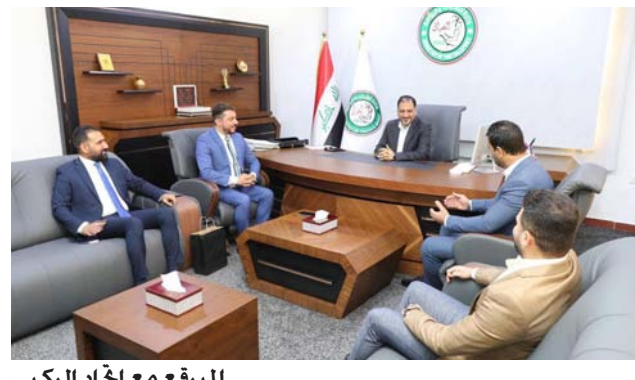
المبرقع مع اتحاد الركبي

يلزم لإيجاد مشاريعه الخارجية بالشكل الذي يليق باسمه وسمعة الرياضة العراقية، من جانبه شكر أعضاء اتحاد الركبي وزير الشباب