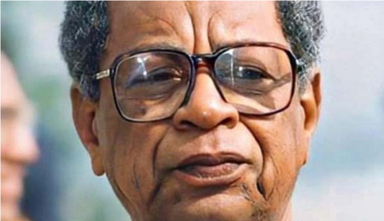
الروائي السوداني الطيب صالح