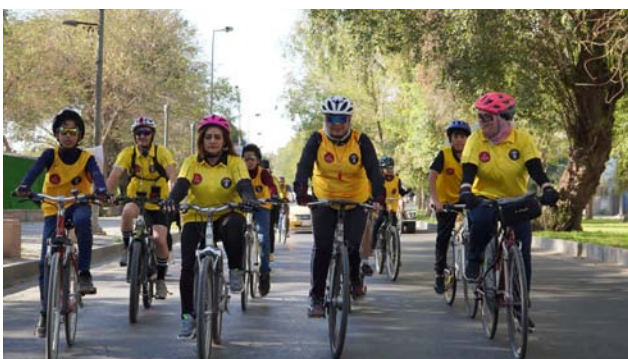
جولة فريق نخلة وطن بالمهرجان