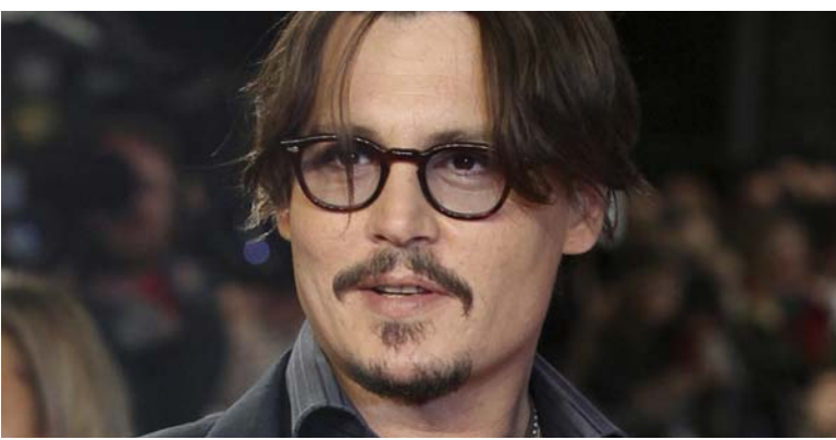
الروائي السوداني الطيب صالح

وسبق لمهرجان «كان» أن عرض مجموعة أفلام من بطولة جوني ديب (59 سنة) . بينها «فيسر أند لوثينغ إن لاس فيغاس» و«بايرتس أوف ذي كارابينيين» . وكذلك فيلم «ذي برايف» الذي تولى إخراجَه في دورة عام 1997 .