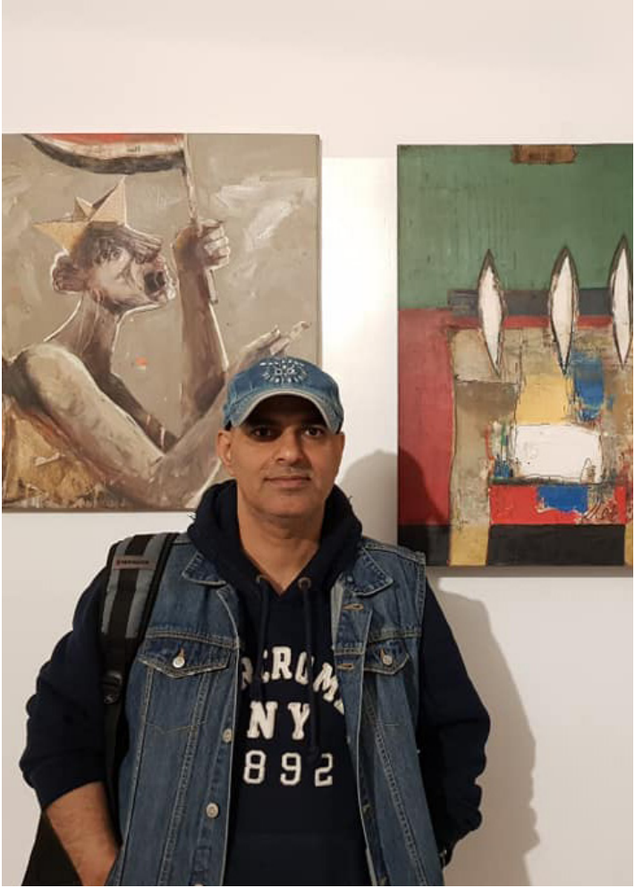
الروائي والشاعر والتشكيلي صلاح حيثاني

بقاء المتحف واستمراره يعتمد عليك وعلى الدعم من جهات أخرى . كيف تؤمن هذا الدعم؟ هل هناك معوقات