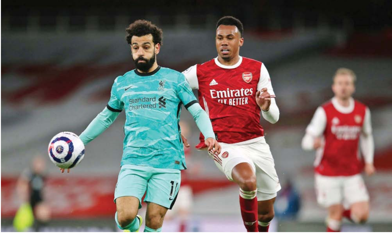
أرسنال وليفربول في مواجهة سابقة

ويحتل ليستر سيتي، الذي أقال مديره بريندان روجرز يوم الأحد الماضي المركز قبل الأخير برصيد 25 نقطة، وسيخوض مباراة «لا بد من الفوز بها» أمام بورنموث صاحب المركز 18 أول مراكز الهبوط بعد أمس السبت. وبورنموث واحد من 4 أندية تملك 27 نقطة، والأندية الأخرى هي توتنهام فورست وإيفرتون وويستهام يونايتد وفورست، الذي لم يحقق أي فوز في 8 مباريات، سيذهب إلى أستون فيلدا المنجهد، بينما يلعب ويستهام على أرض فولهام، ويستضيف ونفرهامبتون وأندراز، صاحب المركز 14، تشلسي مع عودة فرانك لامبارد مدبراً مؤقتاً بعد إقالة غراهام بوتن.