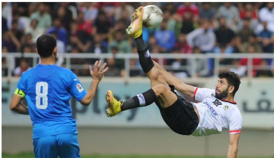
لقطة من مباراة الجوية والنجف المؤجلة بدوري الكرة

وتختتم مباريات الجولة بيوم الثلاثاء بإقامة المباراتين المتبقيتين. أولى المباريات ستجمع فريقاً كربلاء وضيفه فريق القوة الجوية على ملعب الأول. ويحتل الفريق الكربلائي الترتيب 15 برصيد 24 نقطة. فيما يتصدر الفريق الجوي الترتيب برصيد 44 نقطة بعد الفوز الذي حققه على فريق النجف اليوم أمس الأول في المباراة المؤجلة بهدفين نظيفين. أعاد فيها الصقور