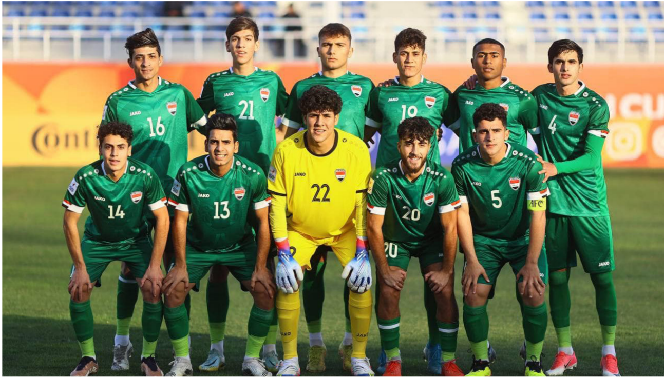
منتخبنا الشبابي لكرة القدم