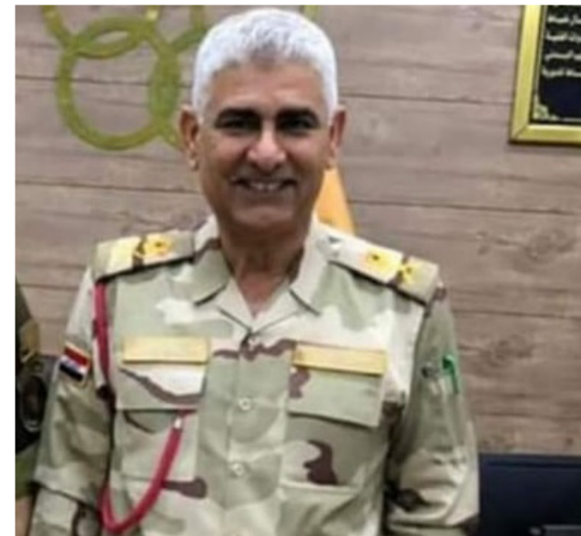
اللواء عمار جبار

كمعاون رئيس اركان الجيش للتدريب ونحن ساترون في اقامة مثل هكذا بطولات رياضية ومقبولون على مشاركات خارجية مهمة تخص الجانب الرياضي.