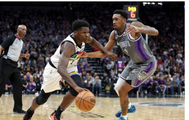
دوري السلة للمحترفين

لي، هو صباح الاثنين، وسنرى ما سيحدث.. من ناحيته، رحب دارفين هام مدرب ليكرز بعودة قائد الفريق والذي دون اسمه الشهر الماضي في سجلات الأرقام القياسية بعدما بات أفضل هداف في تاريخ الدوري، وغاب جيمس عن 27 مواجهة هذا الموسم بسبب مشكلات جسدية مختلفة، وهو أكبر عدد من المباريات في موسم واحد منذ أن انضم إلى «أن بي آيه» عام 2003، وعلى أرض الملعب وبرغم تقدمه في السن، يظهر جيمس أداء خارقًا كما تبرز الإحصاءات حيث تبلغ معدلاته 29.5 نقطة و8.4 متابعات و6.9 تمريرات حاسمة. ويحتل نيس حاليًا المركز الأخير المؤهل مباشرة إلى «البللي أوف» في المنطقة الشرقية، وجمعه منافسة شرسة مع ميامي هيت الذي يملك الرصيد ذاته مع 40 فوزًا مقابل 35 هزيمة، ولكنه يحتل المركز السابع المؤهل للملحق، على خلفية أفضلية الواجهات المباشرة لصالح بروكلين.