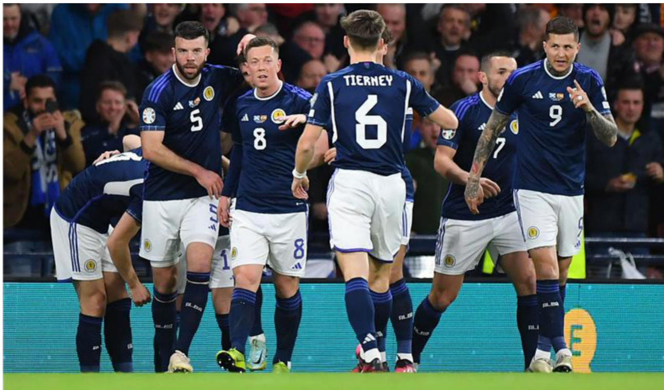
لاعبو أسكتلندا بعد الفوز التاريخي

لقاء المنتخب الإسكتلندي أمام نظيره الإسباني على ملعب «هامبرن بارك» في جلاسكو. من جانب آخر فاز منتخب صربيا بـ 0-2 في الجولة الثانية بتصفيات كأس أوروبا 2024. وسجل مهاجم يوفنتوس الإيطالي دوسان فلاهوفيتش الهدفين في الدقيقتين 78 و69. وكان فلاهوفيتش ساهم أيضا في الفوز الأول لمنتخب بلاده في المجموعة السابعة بالتصفيات. عندما سجل الهدف الثاني في مرمر ليتوانيا.