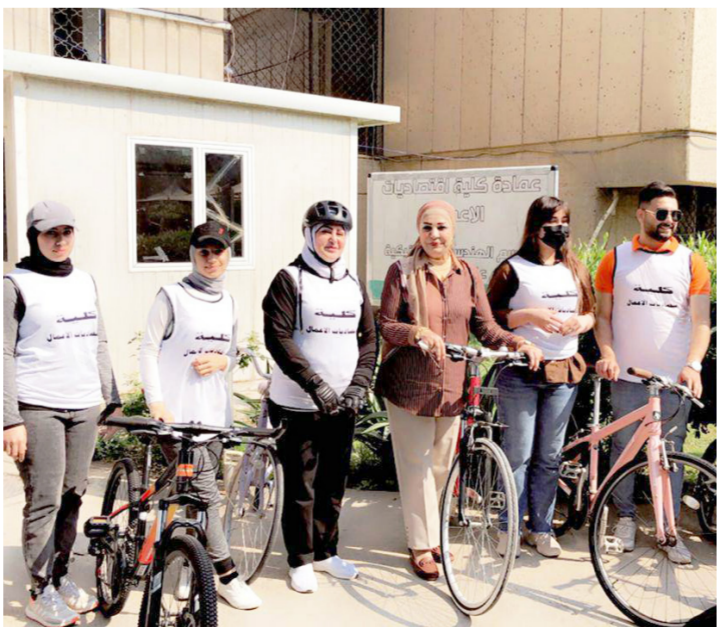
جانب من مشاركة ثانوية الرياضيين في أحد المهرجانات الرياضية

شكراً لـ «الصباح الجديد» وبيتتها مواليد برج الأسد، ومن صفاته قوة الشخصية والنجاح والقلب الخنون الطيب، وفي حريصة على متابعته بدقة، وفي ختام حديثها قدمت الشكر إلى أسرة جريدة «الصباح الجديد» على تسليط الأضواء على ثانوية الرياضيين للبنات ومتابعة أنشطتها، بما يسهم وتعزيز حضورها الإيجابي على الصعيدين العلمي، والرياضي.