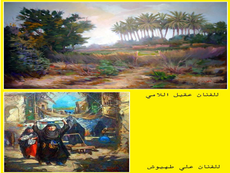
للفنان عقيل اللامي

ففي لوحات الفنان طهيوش، تلمس إنتماءها الراسخ في الفلكور البغدادي الأصيلة، التي ما زالت متجددة في الذاكرة العراقية.. ومنها شاحصة أماننا يومياً كالتقاليد الاجتماعية اليومية والحرف والفنون والأزياء الشعبية التوارثية أياً عن جد، التي تستحيل أن تندثر رغم مرور الزمن عليها طويلاً. أما لوحات الفنان اللامي فقد رسمها بحرفية وأكاديمية رائعة جداً، حيث استلهم