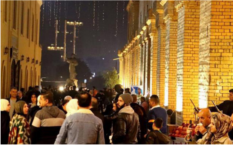
من شارع المتنبي

متر واحد. يُذكر أنّ «القشلة» يعود تاريخ إنشائها إلى عام 1861، إذ كانت مقرّاً للدوائر الرسميّة وتكنة عسكريّة للجيش العثماني. حيث تقع وسط المنطقة المركزيّة القديمة لبغداد، نهاية شارع المتنبي؛ كما تميّز بمساحتها الخضراء الطليّة على النهر، وابواناتها التراثيّة، وساعتها الكبيرة التي تشبه المنارة.