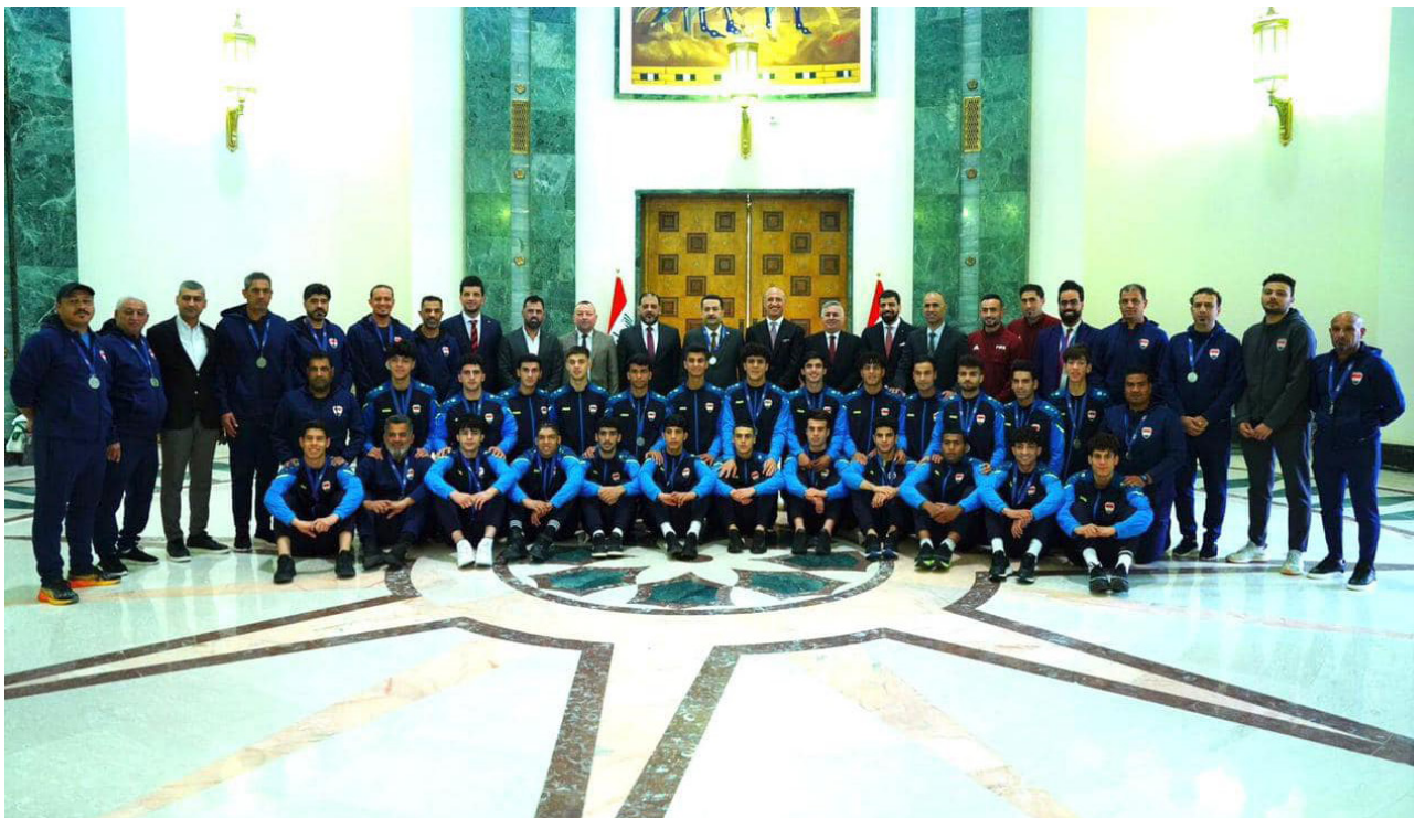
السوداني يتوسط بعثة منتخبنا الشبابي

وبين السوداني أن دعم الرياضة بشكل عام، يمثل أولوية، والحكومة مستمرة في تكريم اللاعبين الأبطال، ودعم الرياضيين والرواد.