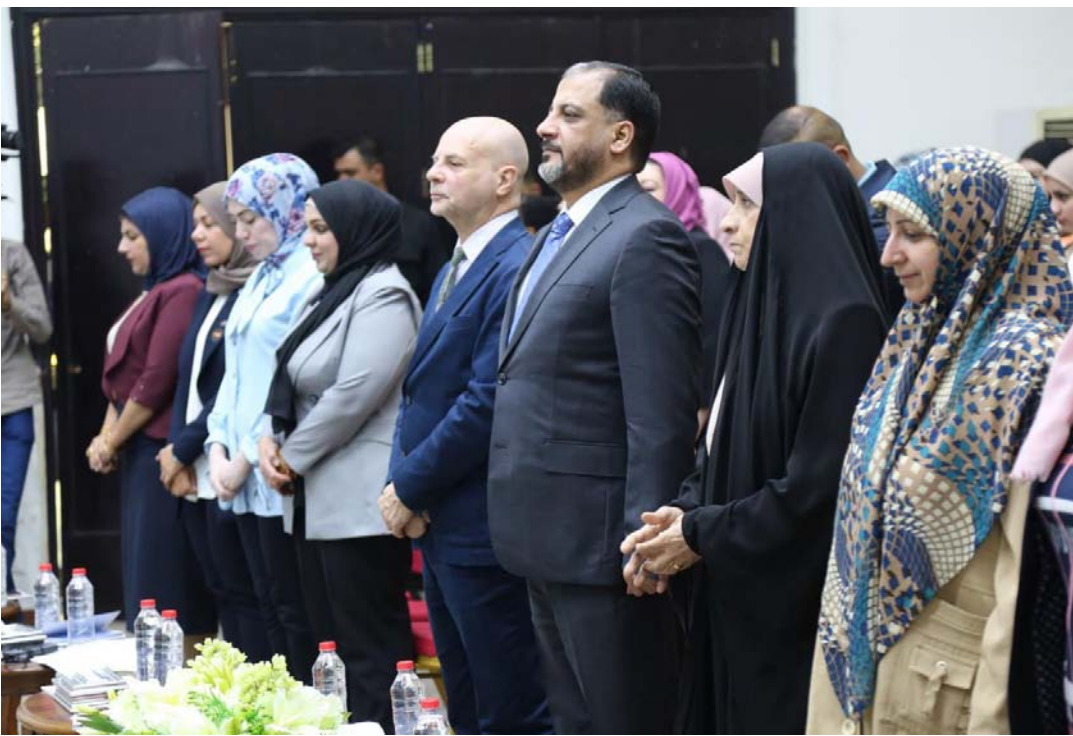
جانب من المؤتمر الختامي

وتضمن المؤتمر الختامي للبرنامج فيديو تعريفياً عن المشروع ومدى انجازه فضلاً عن عرض تقديمي عن حملات الدافعة وعقد جلسة نقاشية حول أهمية المدافعة في حماية حقوق الفتيات في العراق إلى جانب تكريم أفضل حملة مدافعة في المشروع، ويهدف البرنامج لتعزيز دور الشباب والفتيات في صنع القرار وفق أجندة قرار مجلس الأمن الخاص بالمرأة والسلام والأمن (1325) في محافظات بغداد والبصرة وذي قار والنخف وديالى وصلاح الدين والذي تم تنفيذه من قبل منظمة الأقران لتنمية الشباب (وايبيير عراق) وتمويل من منظمة كوربيد الهولندية، المؤتمر الختامي لبرنامج أصوات النساء أولاً، في قاعة دائرة العلاقات والتعاون الدولي وأكد المبرقع إن وزارة الشباب والرياضة تولي اهتماماً استثنائياً بقضايا المرأة وتمكينها ودعمها للقيام بدورها الحياتي والوظيفي وفي كل المجالات على اكمل وجه واستطرد بالقول: ان الوزارة كما عهدتوها تولي اهتمام بالشباب وهذا ليس ادعاء أو منه بل اننا نلتزم بفانون الوزارة الذي يوجب علينا الاهتمام بالرياضة والشباب ومنها المرأة لتعزيز قدرتها وإيلائها الرعاية لاداء دورها الفاعلة وتمكينها ولكننا يعرف قيمتها في المجتمع ولا يمكن ان نغض الطرف عن هذا الدور المهم وسنواصل دعمها المنهج وفق البرنامج الحكومي الذي اعطاهنا مساحة كبيرة كونها جزء اساسي من التنميج المجتمعي العراقي.