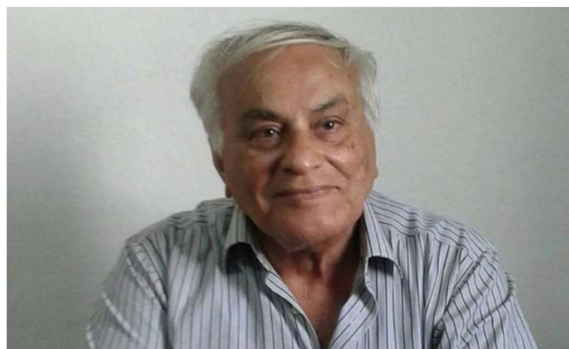
عبد الرحمن مجيد الربيعي (1939 - 2023)

ولد الربيعي في مدينة الناصرية جنوب العراق في 12 أغسطس 1939م تعلم في مدرسة الملك فيصل بالناصرية واكمل دراسته المتوسطة فيها. دخل معهد الفنون الجميلة ببغداد وبدأ النشر في الصحف العراقية والعربية، وسار في طريق الكتابة الأدبية وأصدر أول مجموعة له (السيف والصفحة) عام 1966، وأشرف على تحرير الصفحة الثقافية في جريدة الأبرار الجديدة، والفجر الجديد. عمل مدرسا وفي مجال الصحافة والعمل الديبلوماسي في لبنان وتونس، فكان المستشار الصحفي العراقي في بيروت