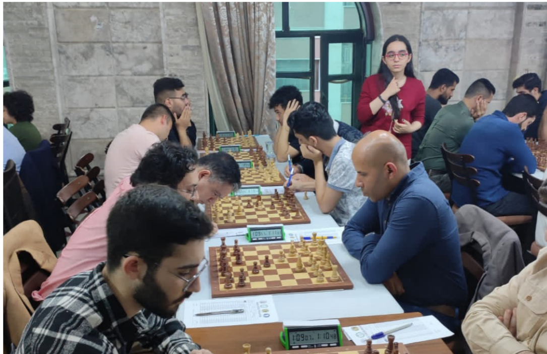
من اجواء بطولة الشطرنج

الناتج النهائية تصدر نادي البيشمركة من محافظة السلممانية سلم الترتيب برصيد