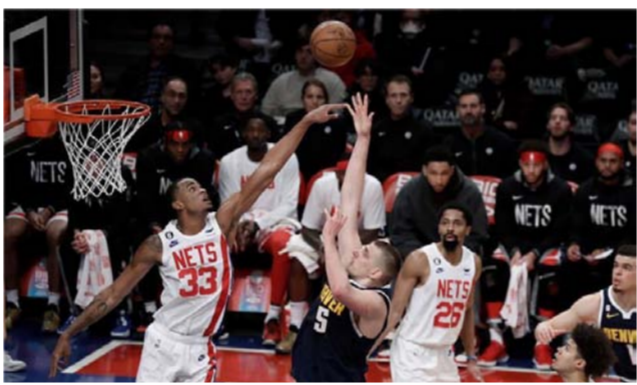
دوري المحترفين بكرة السلة

وقد نجح يوكيتش في قيادة فريقه لنتس إلى فوز بركلات الترجيح، حيث سجل 28 نقطة و9 ريباوندات و6 تمريرات حاسمة، وهو ما جعله اللاعب رقم 1 في الدوري.