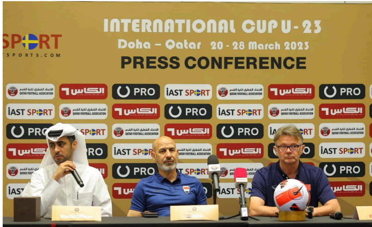
جانب من المؤتمر الصحفي لمُدربي الأولمبي العراقي ونظيره الفيتنامي أمس

بعد إلغاء معسكر سوتشي الكامل، كما تم الاتفاق على تسجيل (23) لاعبا في قائمة كل مباراة، (11) لاعبا أساسيا، و (12) لاعبا على دكة البدلاء، أما تبديلات اللاعبين فيستكون لسنة لاعبين في كل مباراة. من جانب آخر، خاض المنتخب الوطني صباح أمس، ثاني وحداته التدريسية في ملعب الشعب الدولي، وذلك ضمن معسكره القادم في بغداد والذي من المؤمل أن يستمر لغاية الجمعة القادمة، في حين