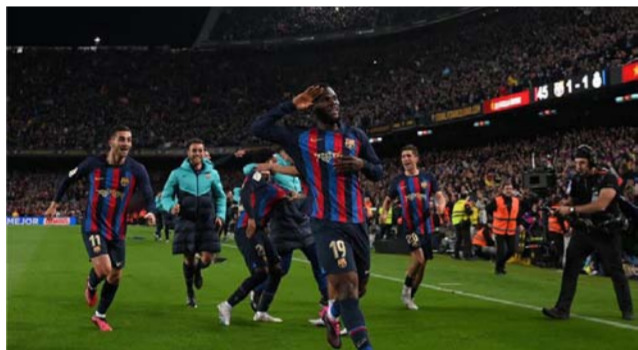
فرحة لاعبي برشلونة بالفوز على ريال مدريد

منحه إياها تشافي، ليصبح أحد أكثر اللاعبين المهمين والخاسمين داخل الفريق، وهو ما حدث فعليا في مباراة حاسمة أمام فالنسيا وأتلتيك بيلباو في عقر داره، كما أنه كان أخطر لاعبي برشلونة على مرمرى البلجيكى تيبو كورتوا في (الكلاسيكو)، حتى وإن لم يسجل.