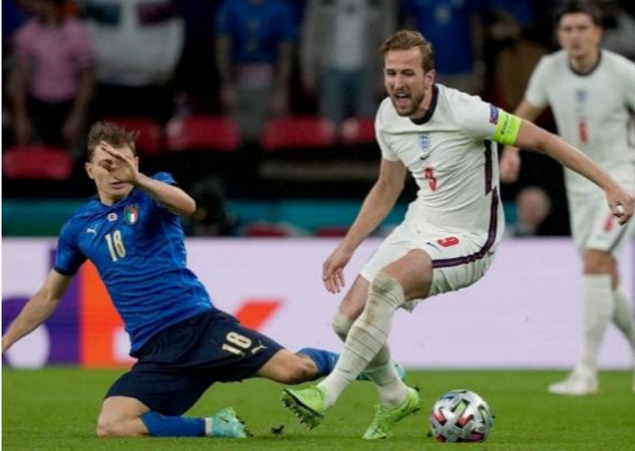
لقاء سابق بين إنجلترا وإيطاليا

وستكون المباراة الأولى من المرحلة الجديدة لمنتخب «البحارة» يوم غد. أمام ليختنشتاين في لشبونة، بعد ذلك، سيسافر المنتخب البرتغالي إلى لوكسمبورج، حيث سيواجه الأخير يوم الأحد.