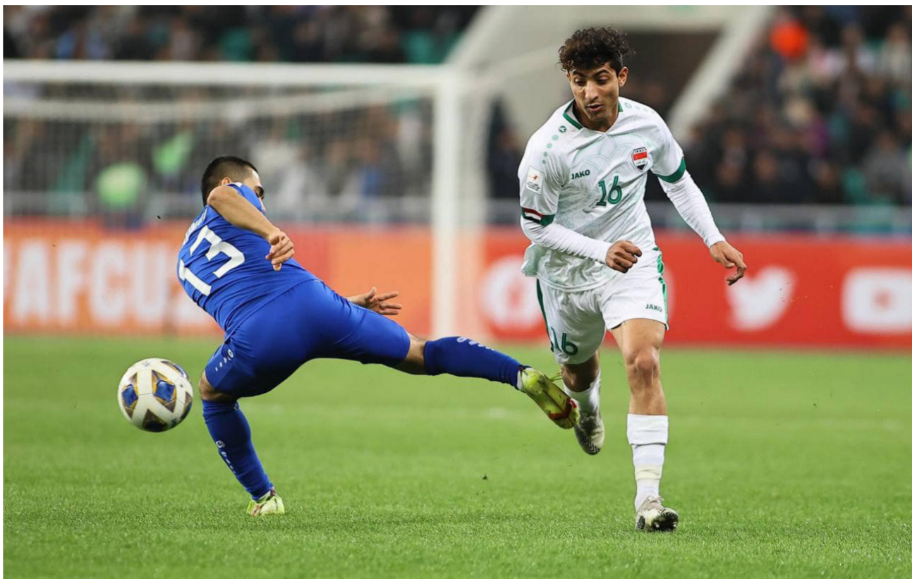
جانب من مباراة أمس لمنتخبنا الشبابي التي خسرها أمام أوزبكستان