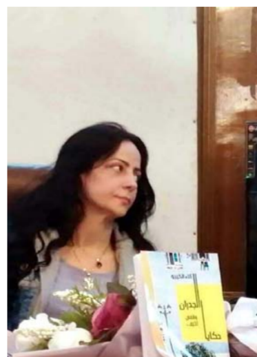
جلسة توقيع المجموعة القصصية

لدى عودته الروتينية إلى البيت، وهو يسلك الطريق ذاته الذي يمر عبر الجسر المطل على النهر الذي طالما عبره، وهو مثقل بهومومه الوظيفية، وروتين الحياة القاتل، شعر بأنّ شيئاً ما بنادي عليه، أو يداعب الأفكار والمشاعر عنده. لم