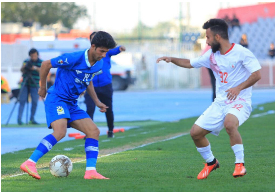
لقطه من مباراة الجوية ونوروز

فريق دهوك بهدف لثله. وهو التعادل الرابع على التوالي للفريق الأبيض. وبهذا التعادل اضاف كل من الفريقين نقطة الى رصيدهما. ووصل رصيد الزوراء الى 34 نقطة حافظ فيها على مركزه الخامس. وكذلك الحال بالنسبة لفريق دهوك الذي حافظ على مركزه السادس برصيد 32 نقطة. وحقق فريق الكرخ فوزاً مهماً على فريق الصناعات بهدفين لهدف. وأضاف من خلالها 3 نقاط مهمة رافعا رصيده الى 26 نقطة حافظ فيها على مركزه العاشر. اما فريق الصناعات فقد بقي في مركزه 19 برصيد 12 نقطة. وتمكن فريق نفط ميسان من استغلال عاملي الأرض والجمهور لصالحه وحقق فوزاً ثميناً على فريق الديوانية بهدفين دون رد. وبهذا الفوز رفع فريق رصيده الى النقطه 28 ارتقى فيها الى المركز السابع. فيما بقي الديوانية متذبذبا للترتيب بنقاطه الستة. ومن ملعب كربلاء تمكن فريق أربيل من اقتناص نقطة ثمينة من مضيفه فريق الفاسم بعد ان فرض نتيجة التعادل السلبي بدون أهداف. ليضيف كلاهما نقطة واحدة الى رصيدهما. ورفع أربيل رصيده الى 19 نقطة في