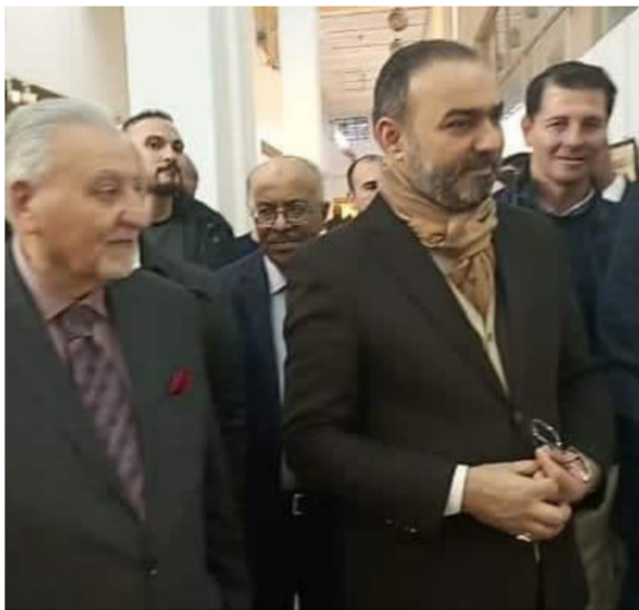
الوكيل يفتتح المهرجان

وقد أستلهم الخطاطون. آيات من القرآن الكريم، وأحاديث نبوية شريفة، وآيات من الشعر العربي. والحكم والعبر الإنسانية