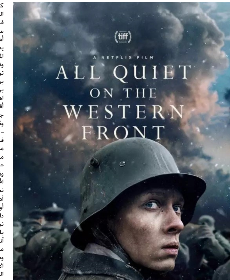
ملصق فيلم كل شيء هادئ على الجبهة الغربية

القصيرة للروائي الروسي الكبير ليو تولستوي «موت إيفان إيليتش» (1886)، «حصى القائمة» عدداً آخر من الأفلام المتنوعة والمختلفة: في أوّل تجاربه «رايان سبوء» مستنواة من إحدى الروائع