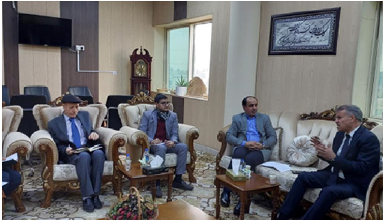
مديرية زراعة البصرة وكلية الزراعة في اجتماع لمناقشة الواقع الزراعي

انها تكون مسؤولة عن وضع البيض المديرية دعماً للمزارعين ومن أجل تنمية تكاثر أفة سوسه النخيل. المصائد الفرمونية دوراً هاماً في عملية تفليل تكاثر أفة سوسه النخيل. كما أن المصائد الفرمونية أداة آمنة بيئياً وأهميتها بالغة في برامج الإدارة المتكاملة للآفات من أجل الحفاظ على أشجار النخيل من هذه الآفة الخطيرة. وتم توجيه أصحاب مزارع النخيل في سفوان والزبير بضرورة التقيد والالتزام بقانون الحجر الزراعي وعدم نقل الأشجار وفسائل النخيل وأجزاء النخيل ونخيل الزينة بين الأفضية والنواحي و من وإلى محافظة البصرة. واهبت المديرية بالمزارعين إلى التعاون معها والتبليغ عن أية حالة يشهدها بها ومراجعة الشعبة الزراعية لاتخاذ الإجراءات المطلوبة علماً ان الحملة مجانية .