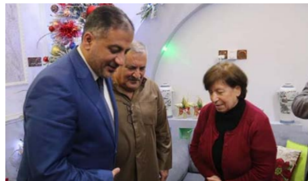
المبرقع يتفقد اسرة مسيحية في البصرة

شخصيات لأول مرة تزور الفيحاء هما نحن نفتخر بهم، ونضعهم في حدقات العيون، لم لا ونحن اهل الكرم والطيبة لا يريد ان يخرج عن صلب الموضوع، لكن اقوالها شكريا ملاكات وزارة الشباب والرياضة شكريا لرجال الإعلام من تركوا مكاتبهم الإداري واصبحوا يعملون ميدانيا شكريا لجهودهم من اجل سمعة العراق، نتخركم غدا والعرس الخليجي في بصرة السياب.