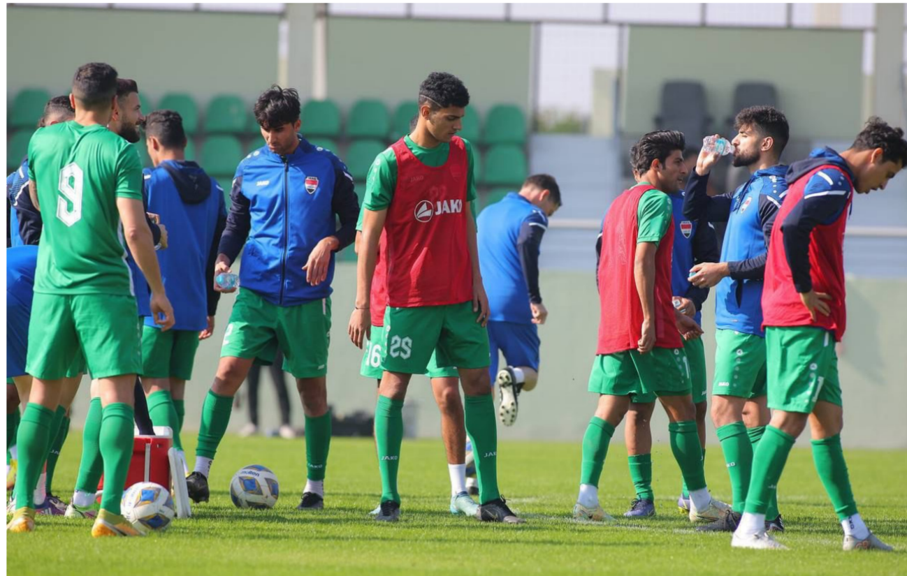
من تدريبات المنتخب الوطني لكرة القدم

يقص منتخبنا الوطني لكرة القدم في الساعة السابعة العاشرة من مساء يوم غد الجمعة شريط بطولة كأس الخليج العربي لكرة القدم بالنسخة الـ 25 التي تضيفها البصرة حتى يوم 19 كانون الثاني الجاري بمشاركة 8 منتخبات تم توزيعها بين مجموعتين ويضيف المباراة ملعب البصرة الدولي تعقبها في الساعة التاسعة والنصف مباراة السعودية واليمن لحساب المجموعة الأولى، في حين يلتقي في المجموعة الثانية المنتخب السعودي واليمن والامارات في الساعة الرابعة والربع مساءً ويتواجه في المباراة الثانية في الساعة السابعة والربع منتخب الكويت وقطر والاماراتن يضيفهما ملعب البناء الأولي. واستنفرت الحكومة جهودها في سبيل الجحاد البطولة، في حين تبدو البصرة مزهوة بتضيف الاشواق الخليجيين الذين يعودون للقاء في العراق بعد انقطاع دام عقود، واولت الحكومة المركزية اهتماما كبيرا ووفرت جميع سبل الجحاد البطولة، في وقت كان التعاون كبيرا من الجهات الساندة الرسمية والشعبية والتطوعية ابتداء من وزارة الشباب والرياضة واتحاد الكرة