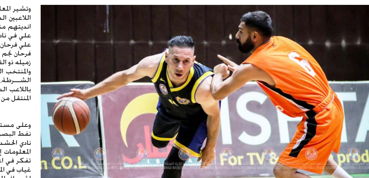
لقطة من مباريات دوري السلة للموسم الماضي