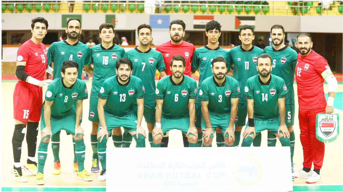
منتخب الصالات وصيفاً لكأس العرب