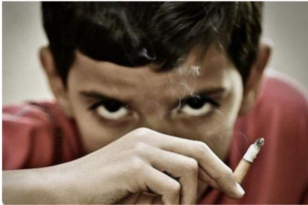
التدخين في المدارس المتوسطة أظهرت نسباً تصل إلى 20% من مجموع الطلاب.

ما يعني أن خمس الطلاب يدخنون من عمر 13 - 15 سنة. وأكد، أن «المشروع جاء بهدف حماية الأطفال من تأثيرات التدخين السلبي، ويعنّي بالتأثيرين بالتدخين سواء في المدرسة أو البيت أو في الأماكن العامة وحميتهم من التحول إلى مدخنين في المستقبل». ولفت إلى أن «المشروع إذا تمّ إنجاحه ودعمه سيكون بالإمكان كطف ثماره خلال خمس سنوات، فضلاً عن إمكانية تقليل معدل التدخين بين الأطفال والشباب».