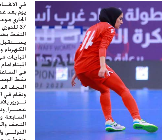
لقطة من مباراة منتخبنا النسوي أمام البحرين في غربي آسيا

في الاخاد المركزي لكرة القدم خديد يوم بعد غد الاربعاء الموافق 22 حزيران الجاري موعدا لبدء منافسات الجولة 37 للدوري الممتاز. فتقام 6 مباريات. النقط يضيف القاسم و امانة بغداد يستقبل الديوانية والكرخ يضيف الكهرياء وزاخو يواجه سامراء وجرى المباريات في الساعة 5 عصرا. ويلعب الميناء امام الطلبة في ملعب الفيحاء في الساعة 7 مساء. في حين يلتقي نفط الوسط والصناعة في ملعب النجف الدولي في الساعة 10 مساء. وتقام في اليوم التالي بقية المباريات. نوروز يلاقي اربيل في الساعة 5 عصرا. وتقام مباريات في الساعة السادسة والنصف مساء. الاولى بين النجف والشرطة في ملعب النجف الدولي والثانية بين نفط البصرة ونفط ميسان في ملعب الفيحاء. وتقام مباراة الكلاسيكو بين الزوراء والجوية في الساعة 10 مساء. اليوم.. نهائي الدرجة الثانية أقيمت أمس في مقرّ الاتحاد العراقي الفئتي والأمني الخاضع في المباراة ومرماه الأزرق الكامل.