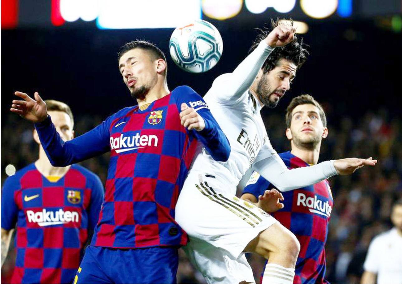
ريال مدريد وبرشلونة في مواجهة سابقة

وأشارت إلى أن روديجر سيسير على خطى الفرنسي أوريلين تفسواميني الوافد من موناكو، الذي اختار الرقم 18، نظراً لأن رقمه المفضل (8) يرتديه النجم الألماني توني كروس.