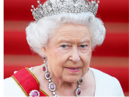
الملكة إليزابيث الثانية أول ملكة بريطانية تضي 70 عاماً في الحكم، وفيما أشاد ابنها ولي العهد الأمير تشارلز «بنجاحها المميز» عبرت عن أملها في أن تحمل كاميليا زوجة تشارلز لقب ملكة بعد وفاتها.