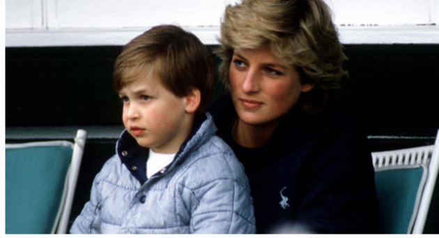
العائلة المالكة البريطانية قبل إنهاء زواجها من الأمير تشارلز، وكانت الأكاديمية البريطانية لفنون السينما والتلفزيون قد كشفت عن قائمة الترشيحات

تم إكراماً لعيني الأمير ويليام، إذ إنه الراعي الملكي للأكاديمية البريطانية لفنون السينما والتلفزيون منذ عام 2010، ودانها ما يكون أول الحاضرين في حفل. فيما كان جده الأمير فيليب أول رئيس للبافتا. وكان الأمير ويليام قدزار مقر البافتا في لندن، مؤخرًا، حيث قام بجولة في مبنى الذي تم إنشاؤه حديثاً. يشار إلى أن مشاهد فيلم «سينسر» تدور في منزل سانديرينغهام في نورفولك بإنجلترا، حيث تقضي الأميرة ديانا عطلة عيد الميلاد الأخير مع