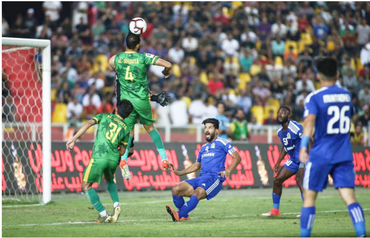
لقطة من مباريات دوري الكرة الممتاز

من جانبها، قررت لجنة المسابقات في الاتحاد المركزي لكرة القدم نقل مباراة فريقي نوروز و زاخو المقرر إقامتها اليوم الثلاثاء في الساعة الواحدة والنصف من بعد الظهر، من ملعب السليمانية إلى ملعب البيشمركة. وذلك لعدم صلاحية ملعب السليمانية بسبب غزارة هطول الأمطار. علماً أن زاخو فاز ذهاباً بهدفين لهدف.. وعلى ملعب التاجي يضيف فريق الكهرباء فريقاً أمانة بغداد. وفاز الكهرباء ذهاباً بهدفين نظيفين. وأشارت إلى أن نفض البصرة يضيف على ملعب الفحاء فريق نادي الكرخ في الساعة الثالثة و45 دقيقة عصراً. وعلى ملعب ميسان يضيف نفض ميسان فريق النقط في الساعة السادسة مساءً وسبق للمباراة الأولى أن انتهت سلبياً. وتتواصل المنافسات غد الأربعاء بإقامة أربع مباريات يستقبلها فريقاً الديوانية والنجم على ملعب الأول في الساعة الواحدة و45 دقيقة. وفاز النجم ذهاباً بثلاثة ببيضاء. وعلى ملعب الكتل يضيف القاسم في الساعة الثانية فريق القوة الجوية والأخير أنهى المباراة الأولى بهدف لصالحه. وعلى ملعب سامراء يضيف أصحاب الأرض والجماهير فريق نفض الوسط في الساعة