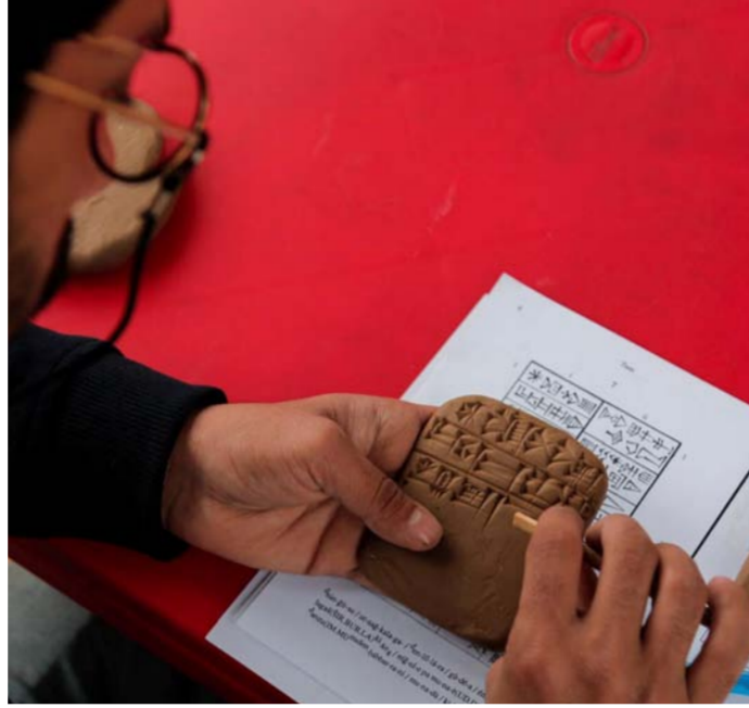
بنيان يكتب سومري

مع علماء آثريين في العراق والعالم وحين صارت لي صفحة على شبكة التواصل الاجتماعي باسم "تونابشتم" وهو قائد سفينة نوح وبطل الطوفان وصار لي متابعين واصدقاء التقى بهم واكتب لهم اسماءهم، وصنعنا انا وبعض الآثاريين عدداً من الشباب يعرف الكثير عن هذه اللغة وصارت تستعمل كعناوين لبعض المشاريع الاقتصادية واستخدمها بعض الصاغة بكتابة الاسماء كفلادة، وصار الكثير من الهواة يطلقون على الآثار من خلال اقامة جولات سياحية اثارية وقرارة ما يتعلق بالواقع، وهذه ثقافة ليس من السهل نشرها وبسرعة،