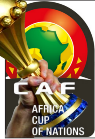
ياوندي - وكالات:

مجموعة مميزة من اللاعبين. يتقدمهم نجم ليبرول ساديو ماني. وأديسا جاي لاعب باريس سان جيرمان. وإدوارد ميندي. حارس مرمر تشيلسي. كما يمتلك المنتخب السنغالي. المدرب أليو سيسيه الذي يمتلك خبرة كبيرة في المسابقة القارية. ويجيد اللعب على إمكانيات لاعبيه واستغلال قدراتهم. على الجانب الآخر يطمح المنتخب البوركينابي لانتهاز الفرصة. واستغلال الفرصة العالية للاعبين. خاصة بعد المستوى الراقي الذي قدمه أمام تونس في ربع النهائي. ورغم أن الترشيحات نصب في صالح السنغال. إلا أن فريدي لاغي بوركينا فاسو. قد تصنع المفاجأة وكتابة التاريخ بالوصول إلى