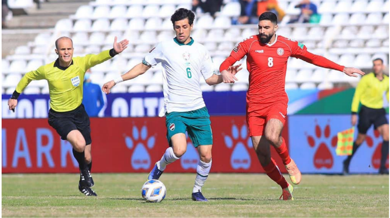
صراع على الكرة في مباراة منتخبنا امام لبنان أمس

وسيلعب منتخبنا الوطني مباراة المقبلة في يوم 24 آذار المقبل امام الإمارات في مباراة مقبلاً لها ان جرى في ملعب البصرة الدولي. وسيختتم منتخبنا شوطه في رحلة التصفيات عندما يلقي في سوريا يوم 29 الشهر ذاته في استاد الملك عبد الله الثاني في العاصمة الأردنية عمان ملعب سوريا المقترض في التصفيات. وبحسب انباء فقد أهدأ مصدر في الأمانة الإماراتية لكرة القدم. برض طلب نظيره العراقي. اللعب في ملعب البصرة. أو ملعب الحبيبية في العاصمة بغداد وطلب الأخاد