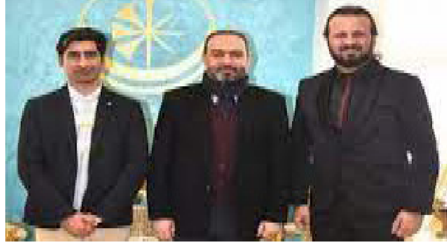
في المحادثات للفائدة من هذه التجربة وتبسيط الضوء عليها بوصفها لغة مشتركة لمد جسور