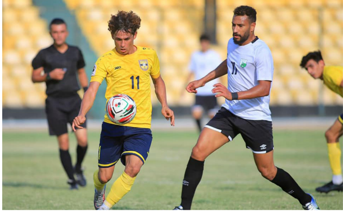
لقطة من مباريات دوري الكرة الممتاز