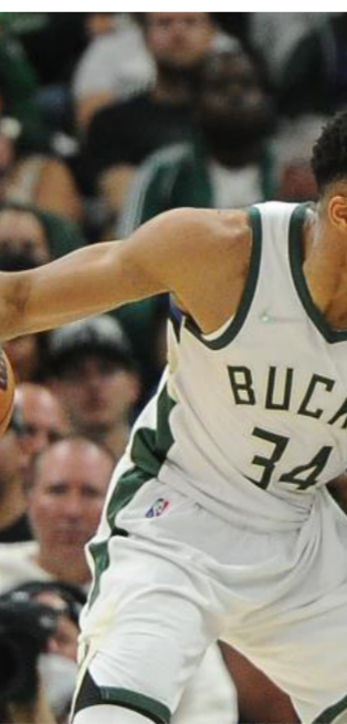
جانب من الدوري الأميركي للمحترفين بالسلة

ووصل تقدم ليكرز إلى عشر نقاط. وكان متفوقا 90-89 بعد رمية ثالثة من جيمس قبل تسع دقائق و37 ثانية من النهاية. لكن واريورز رد بتسجيل تسع نقاط متتالية ليتقدم 98-90 ويفرض سيطرته على المباراة حتى النهاية ويخرج بالانتصار. وهذه المباراة السنوية في الموسم الجديد. بعدما استهل ميلووكي باكس رحلة الدفاع عن اللقب بالفوز 127-104 على بروكلين نتس.