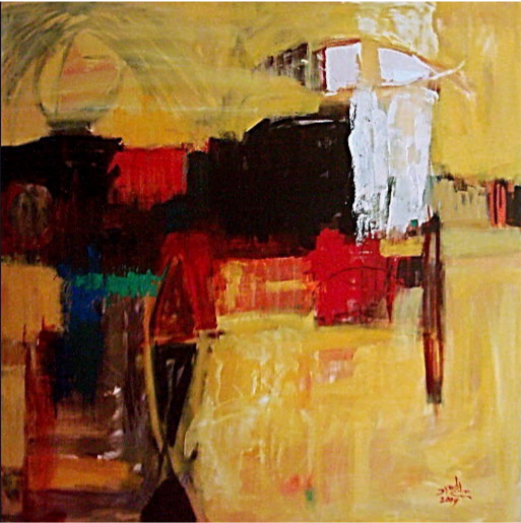
من اعمال الفنان هادي ماهود

نقول أن من السهل على الإنسان أن يحدد موقفه من الأشياء التي خيط به خاصة وهو يتحدث بلغة أبطاله لغة الحاضر والغائب وربما يستطيع توقع ما يحدث في الغد..ولكن ليس من السهل على الكاتب والروائي أن يحدد مصير أبطاله وشخصوه مثلما حددها ورسم معالمها وهوياتها بدقة متناهية القاص المتمكن عبد علي اليوسفي في مجموعته الرائعة( مدينة الاثل ). لم تذوق القراءة منذ غادرتنا كتابات بانعة ومشرفة وسلسة في المضمون والصبآغة لعبد الرحمن مجيد الربيعي في الوشم والوكر والأنهار ولفاضل العزاوي في القلعة الخامسة وكوميديا الأشباح وعششرات القصص لفؤاد واحمد خلف في خريف البلدة و عبد الستار ناصر في تلك الشمس أجبها وحسب الله يحيى في اصابع الأوجاع العراقية وامجد توفيق في الخطأ الذهبي وشوقي كرم في لباية السر وغيرها من الروائع التي مآزالت راسخة في ذاكرة المتخصصين بالأداب وبفن القصة القصيرة التي رسمت أبعادا حقيقية لهويتها الوطنية في القدرة على توثيق ما مر من أحداث وتقلبات كثيرة عاشتها البلاد ووجب الوقوف عندها.