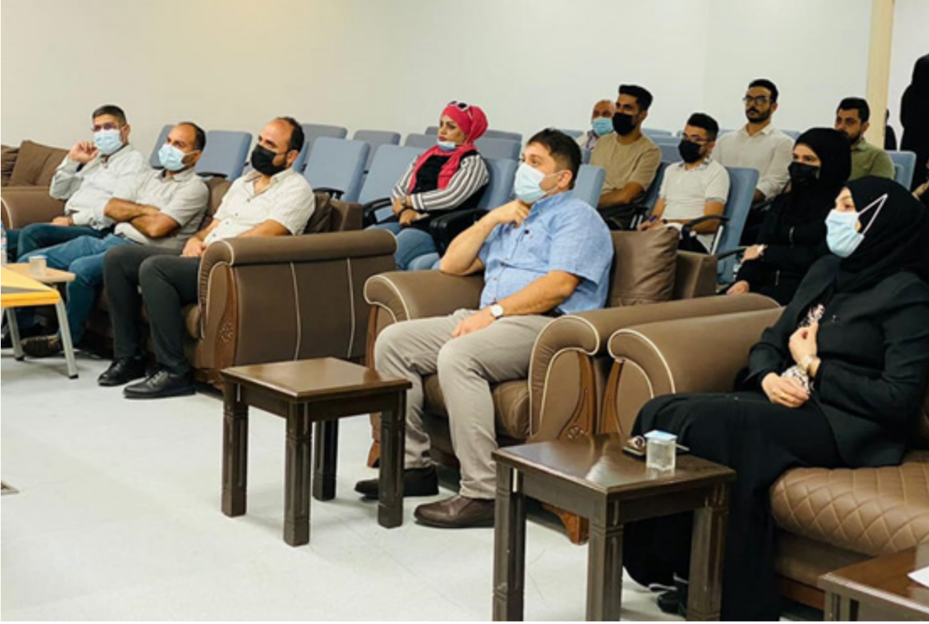
جانب من محاضرة علمية بالبصرة حول الأرتجاع المعدي المريئي لدى الأطفال