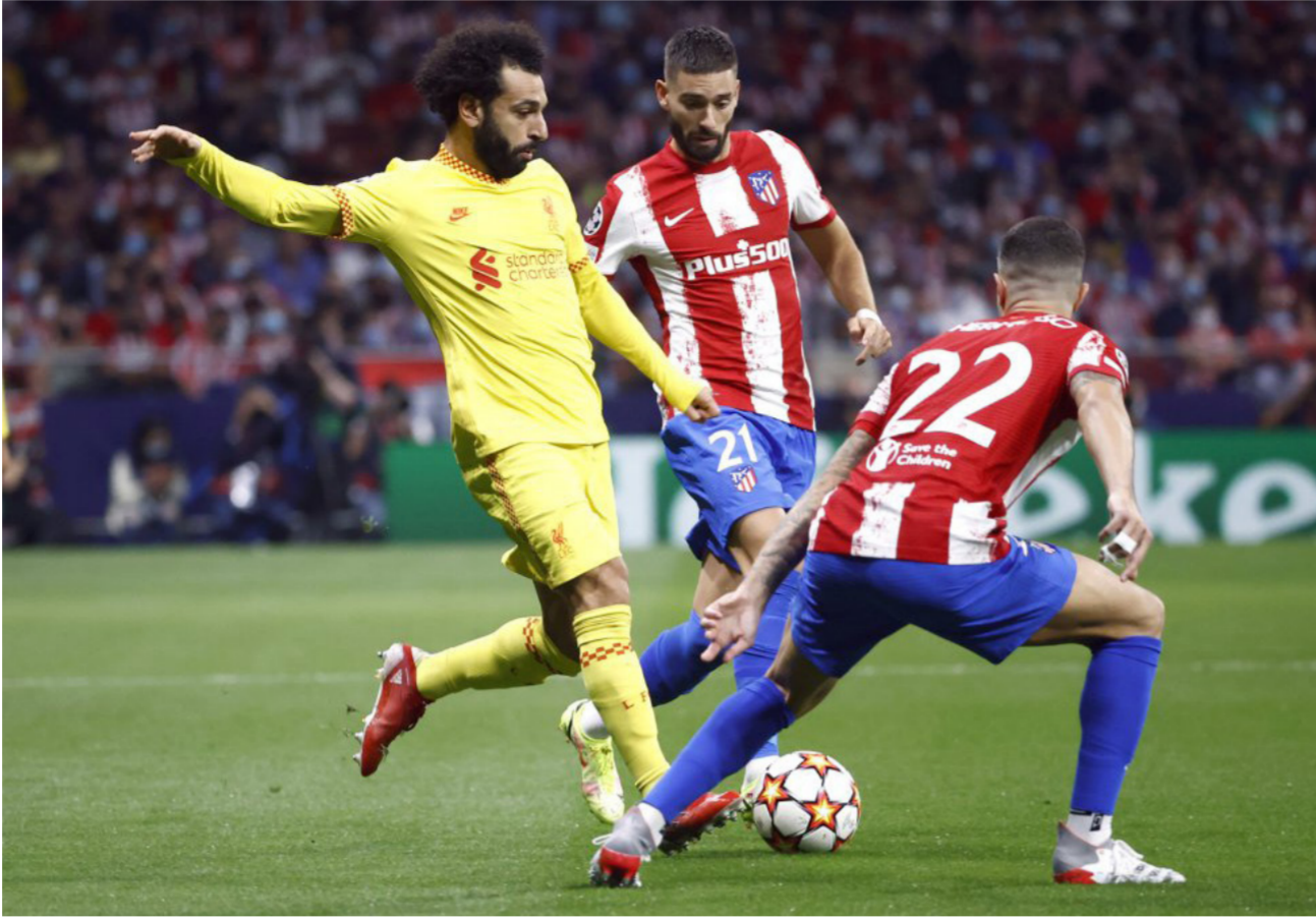
صلاح في محاولة للتسجيل بمرمى اتلتيكو مدريد

جائزة أفضل لاعب في المباراة لدوره الكبير في إسقاط الفريق الألماني. سجل كيليان الهدف الأول لبي إس جي. وضع الثاني لزميله ليونيل ميسي. بخلاف تسببه في ركلتي جزء لصالح فريقه. نجح الأرجنتيني ليونيل ميسي من تسجيل هدف الفوز عبر الركلة الأولى.