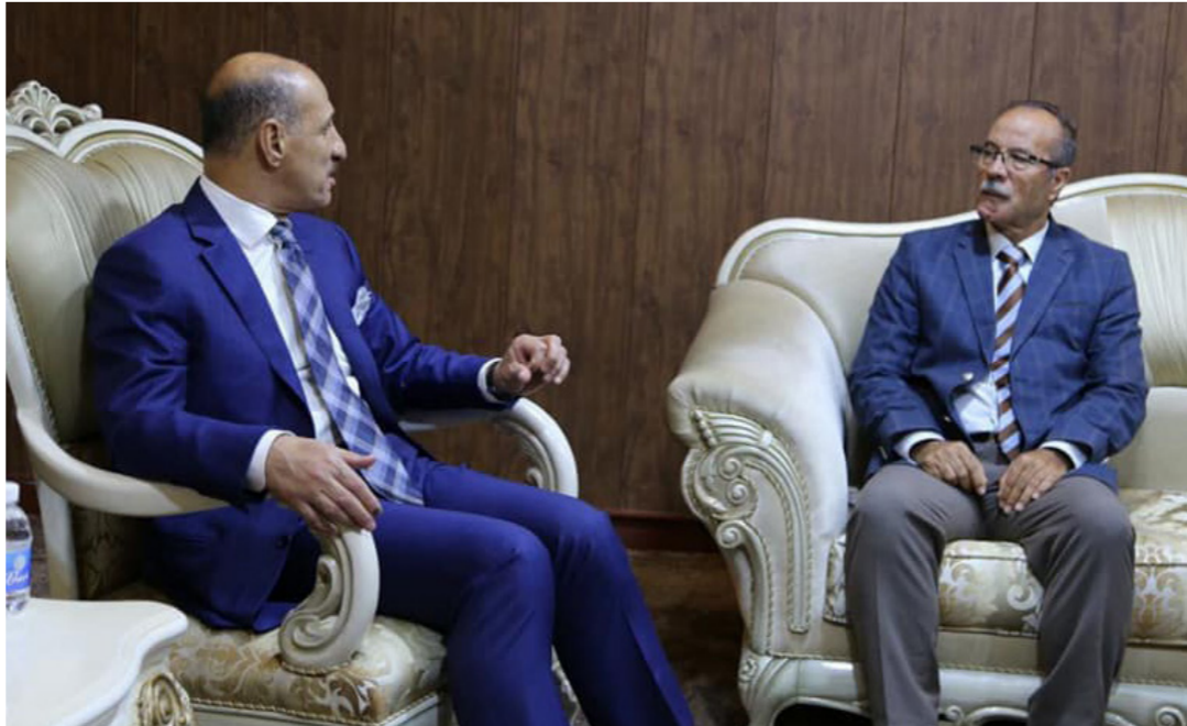
جانب من لقاء درجال وشاهر

استقبل وزير الشباب والرياضة عدنان درجال أول أمس، رئيس واعضاء الاتحاد العربي للجمودو تزامنا مع تواجدهم في بغداد وحضور فعاليات الدورة التدريبية التي يقمها الاتحاد العراقي المركزي للعبة في بغداد. وبحث الوزير درجال مع الاتحاد العربي مثلا برئيسه الليبي نعمان شاهر) إمكانية تنظيم بطولة العرب باللعبة في العراق وتقديم ملف جاهز الى الاتحاد بهذا الشأن، وعبر شايفر عن سعاده لوجوده في بغداد ودعا الى فتح مجالات اوسع بالتعاون مع الوزارة لنشر اللعبة في العراق وتطويرها وتقديم جميع التسهيلات بذلك بالتنسيق مع الاتحاد العراقي للعبة. من جانبه قدم رئيس اللجنة الفنية في الاتحاد العربي ( الليبي نبيل الدراويل ) شكره جهود الوزارة في اقامة الدورة التدريبية والتكيفية والادارية في بغداد وتوفير جميع متطلباتها