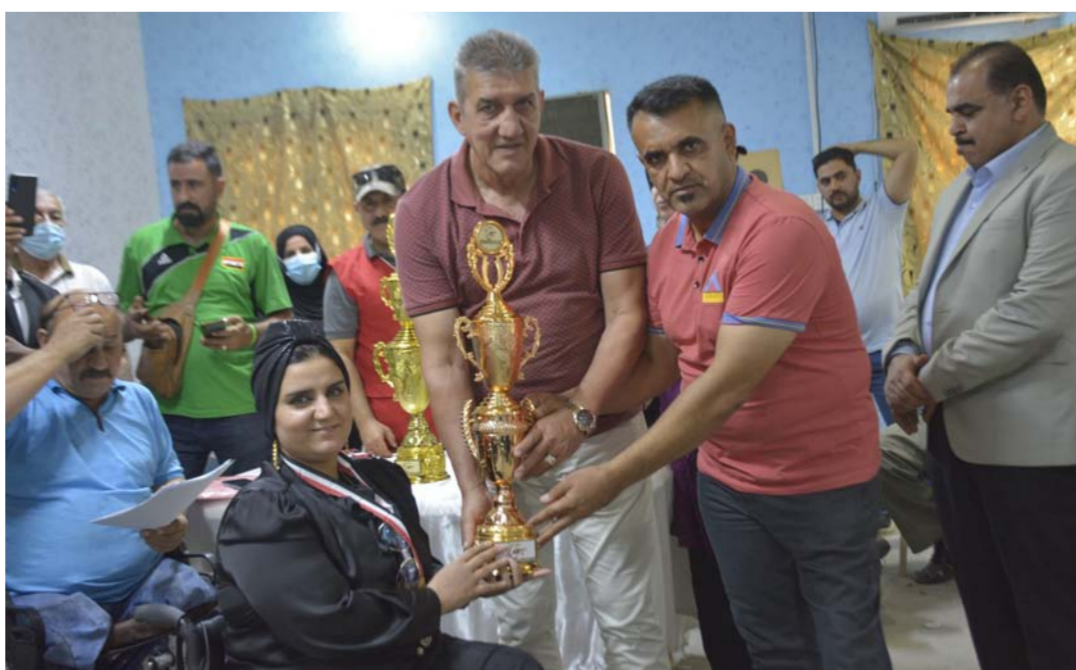
توزيع الكؤوس على الفائزين في بطولة رماية البارالمبية