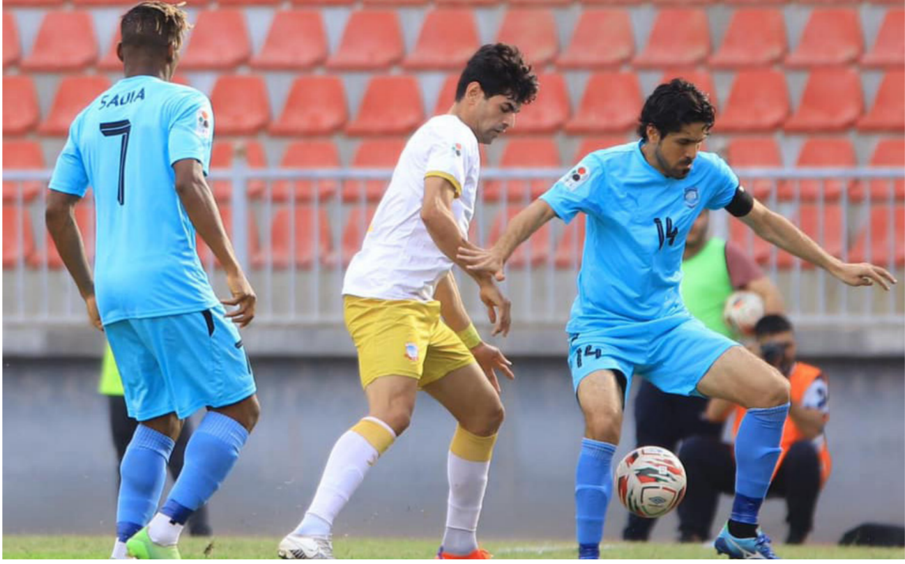
لقطة من مباريات الدوري الممتاز لكرة القدم

مع مدربي جميع منتخبات العالم وذلك مناقشة اجندة المباريات بداية من عام 2024. ومن المقرر مناقشة مجموعة من النقاط تتضمن صحة اللاعبين وكيفية إقامة البطولات