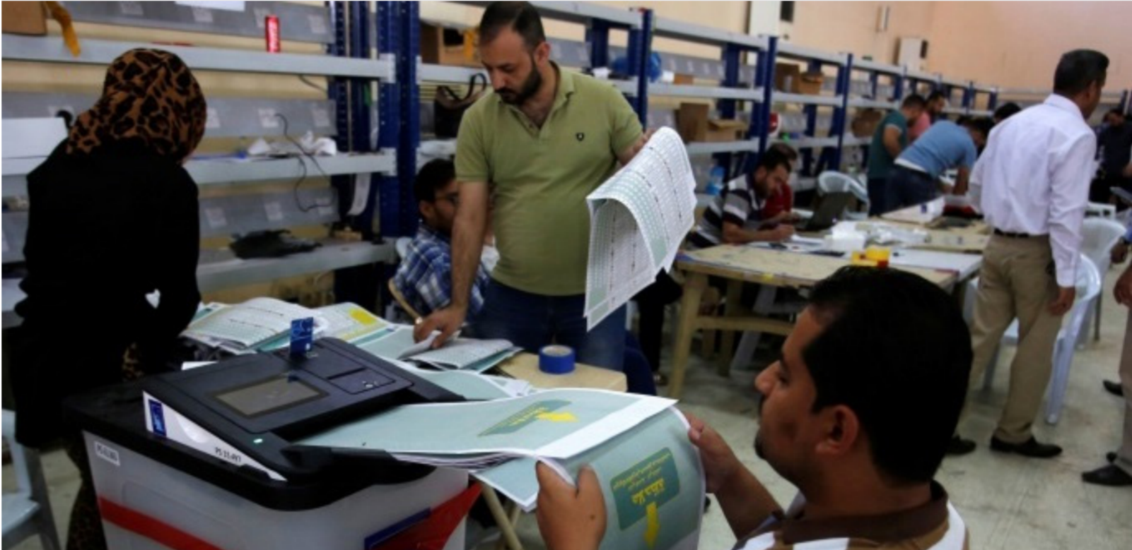
عمليات العد والفرز "ارثيف"

من دون التلويح بضرب السلم الأملى أو الاعتداء على الأموال العامة أو الخاصة". يذكر أن التيار الصدري قد حقق 73 مقعداً في الانتخابات. بفرق كبير عن باقي الكتل الشيعية التي أعلنت عن تأسيس الأقطار ورئيس الجمهورية". وأنتهى دعوى، إلى أن "الاعتراضات على النتائج يجب أن تبقى ضمن إطارها السلمي.