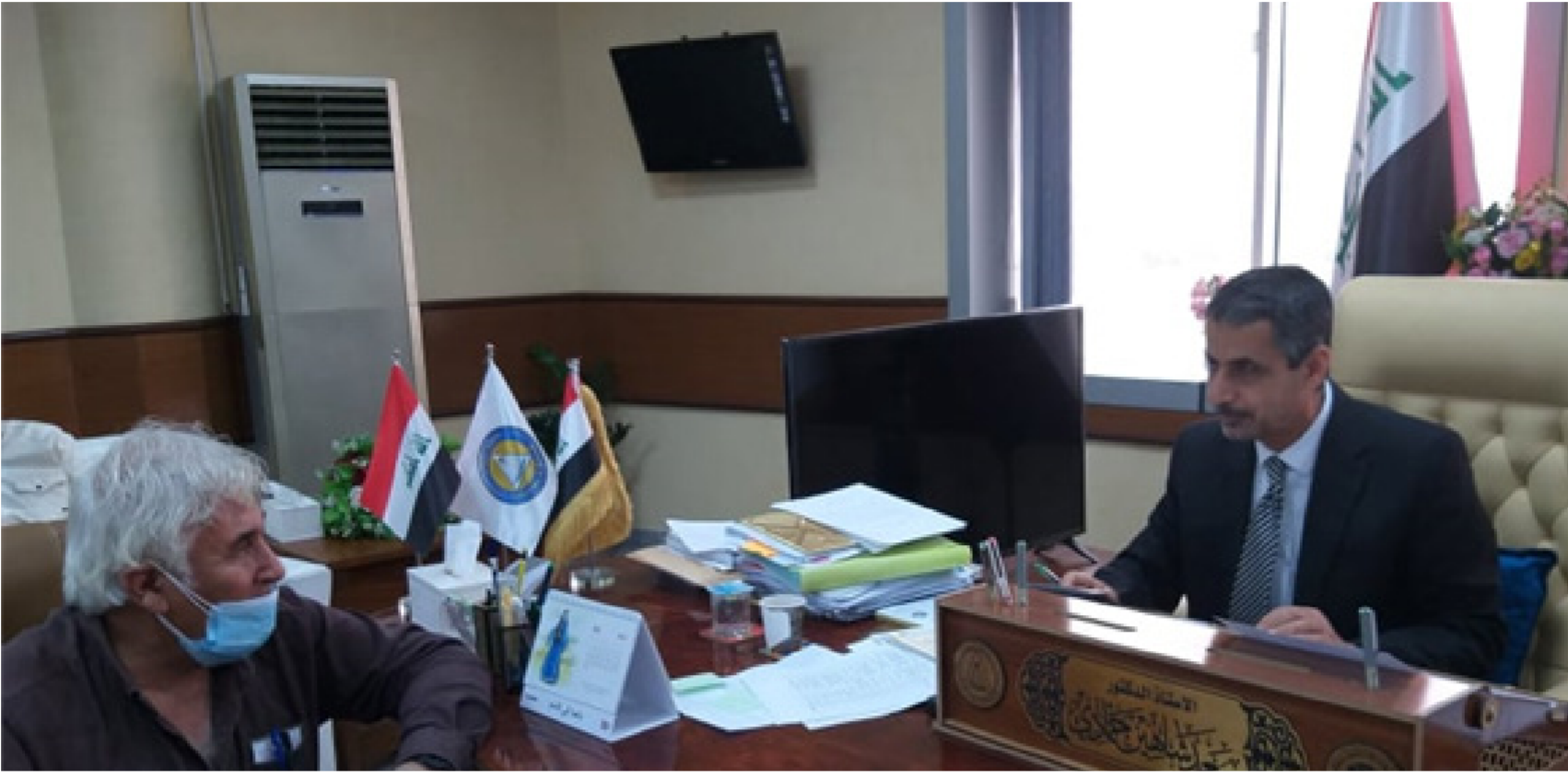
رئيس جامعة البصرة يتحدث لمراسلنا

في جامعة البصرة ورشة عبر الانترنت عن مهارات التدريس الجامعي الفعال ضمن مشروع تنمية وتأهيل . وتهدف الورشة التي هي جزء من دورة طرائق التدريس لاجراءات أعضاء الهيئات التدريسية هو تمكين التدريسيين الجدد والمستمرين في الخدمة من استيعاب مهارات التدريس الجامعي اللازمة بفعالية واثقان من حيث توزيعها الطبيعي على ثلاثة مجالات هي مجال التخطيط ومجال التنفيذ ومجال التقويم ولكل مجال منها مهاراته الخاصة التي ينبغي على التدريسي امتلاكها ليكون تدريسيًا مجتهدًا وذا فعالية وتأثيرات إيجابية في رفع مستويات تحصيل الطلبة ومعارفهم المتنوعة.