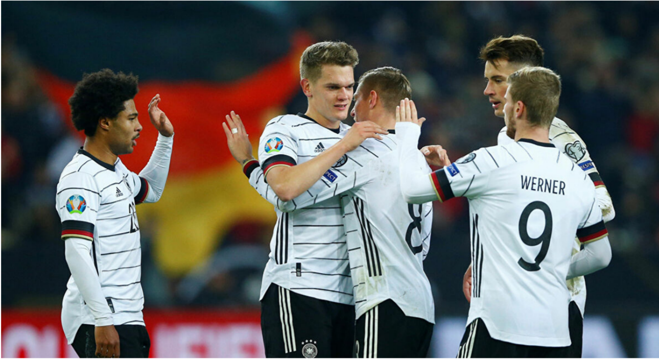
ألمانيا.. أول المتأهلين إلى كأس العالم في قطر 2022

وبعد ما انتقل جينتر إلى بوروسيا دورتموند في عام 2014، ثم انضم إلى بوروسيا مونشنجلادباخ في 2017، وشارك جينتر في 44 مباراة مع المنتخب الألماني، وكان ضمن المنتخب المتوج بلقب كأس العالم 2014 في البرازيل.