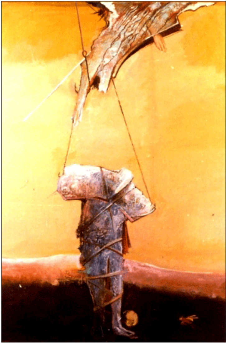
من اعمال الفنان سلمان البصري

الكلبة والجراء. هذا ما قالته لي أمي في وقتها قبل عشرين سنة. حين انتبهت لسسحة الكابة على وجهي. وحالي الذي تبدل إلى فتور وجزن شديد بعد مقتل بيّوضه وجرائها المساكين.. ومباشرة قررت أن أنسى كل هذا وأعود إلى عملي بعد أن أخذ غفوة بسيطة تعين بدني على السهر وتعب المهنة. وفي تلك الغفوة حلمت بالمشهد ذاته. صوت الكلبة الذي دوى في ذلك الضحي المشؤوم. ومازال عالقا في أذني حتى هذه اللحظة. ثم رأيتني في الحلم ليلا قرب سياج المدرسة. عبرت ولم يكن أحد معي.. لم أكن بعمرى