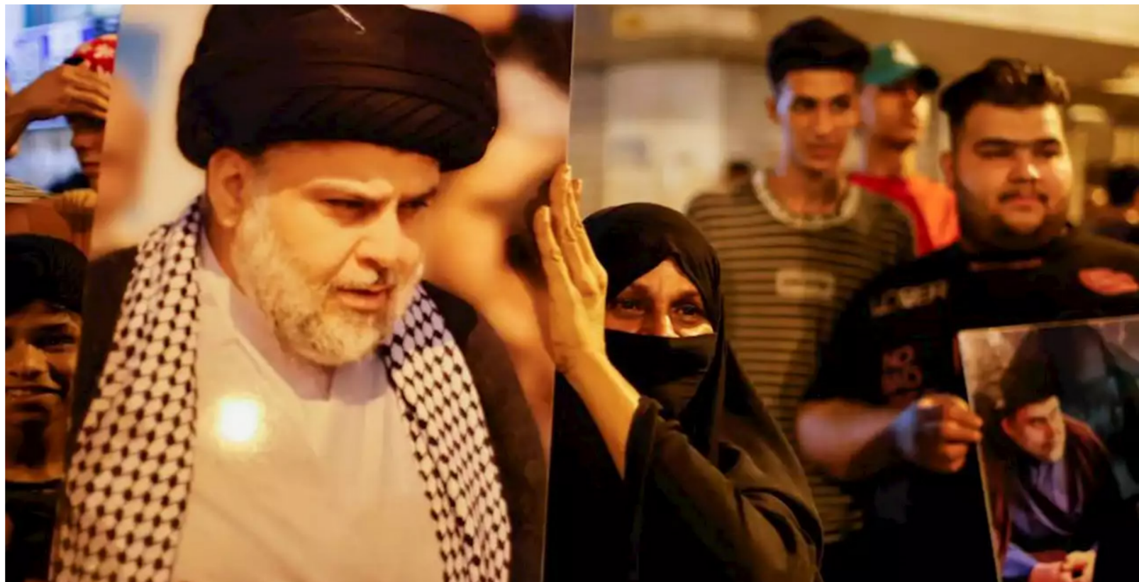
جانب من احتفال جمهور الكتلة الصدرية بالفوز في نتائج الانتخابات "الأول من أمس"

الجمهورية سيقى للكردي، وان حزبه اثبت انه عابر للقومية والجغرافيا. وقال زبياري في مؤتمر صحفي عقده مع اعضاء اللجنة العليا للانتخابات في الحزب الديمقراطي امس الثلاثاء، تابعته الصباح الجديد. ان منصب رئاسة الجمهورية سيبقى للكردي. لافتا الى ان الحزب الديمقراطي يجري اتصالات مع كافة الكتل والأطراف العراقية بهذا الصدد. وسين زبياري، ان حصول الكردي على منصب رئاسة الجمهورية هو عرف سائد منذ عام 2003، لافتا الى انه من المنكر الحديث عن الشخصنة التي من الممكن ان تشغل هذا المنصب، واكد زبياري ان الحزب الديمقراطي يتقبل نتائج الانتخابات، وانه بدأ التواصل مع كتلة سائرون ودولة القانون وعزم، وموظم الكتل التي خاضت الانتخابات، وتدارك، "الى اننا لم ندخل بعد في مباحثات جدية مع اي جهة".