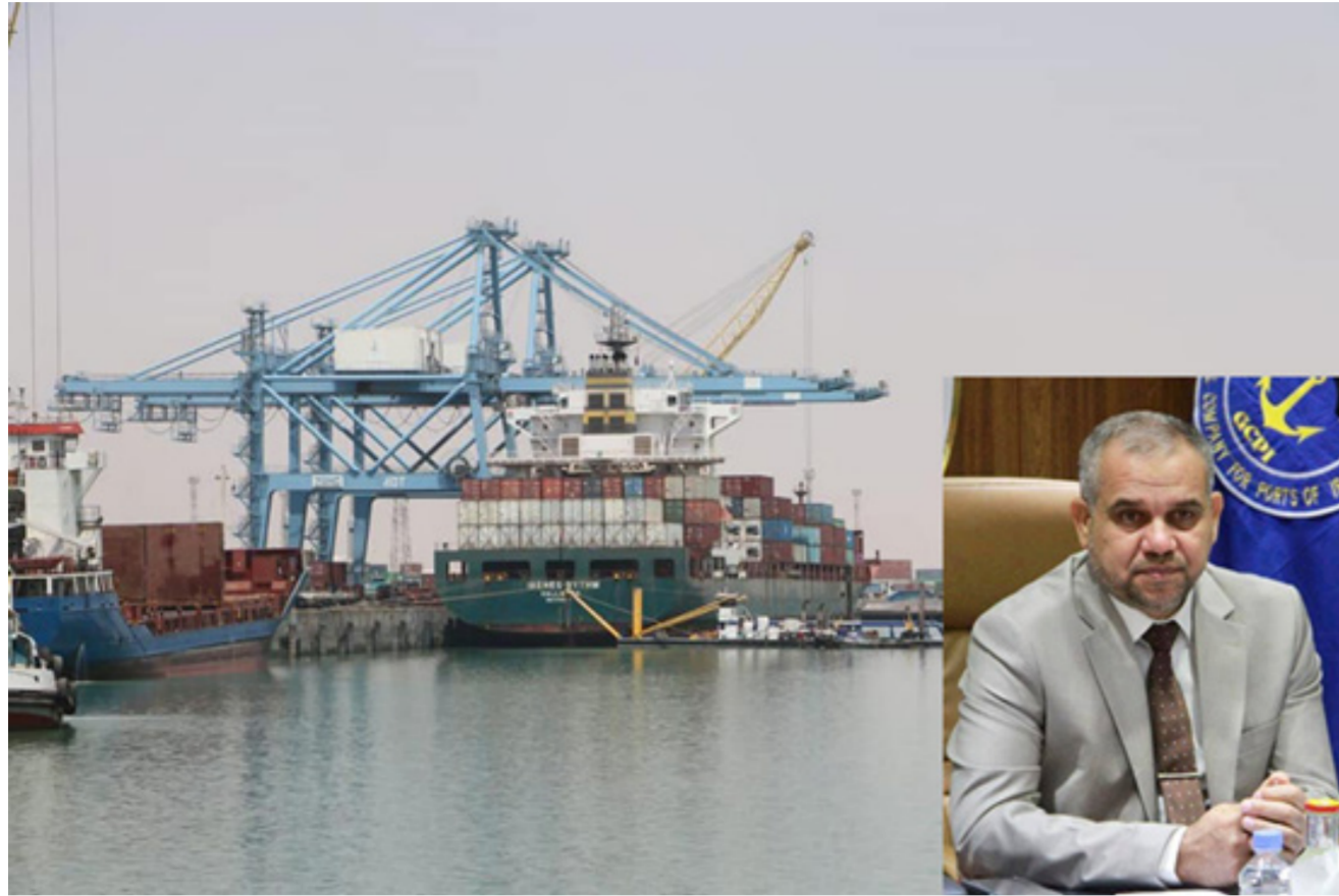
عملية تفريغ وتخميل الحاويات والى الجانب مدير عام موانئ العراق

العراق عن معدل احصائية شهري ايلول لميناء ام قصر الشمالي مشيرة الى ان معدل الانتاجية هي الاعلى من الشهر السابق من حيث الوزن ومعدل الحاويات . وقال مدير عام الموانئ ان انتاجية شهر ايلول لميناء ام قصر الشمالي تضمنت ارساء 71 سفينة محملة بمختلف البضائع على ارضية الميناء مشيراً الى ان ملاكات البناء افرغت نحو ( 795,660 ) طناً ومعدل تفريغ الحاويات القادمة ( 25607 ) حاوية محملة بالبضاعة فضلاً عن اعادة (22892) حاوية فارغة الى مصدرها . وأوضح المدير العام ان انتاجية شهر ايلول في تصاعد حيث اظهرت الاحصائية بأنها الأعلى في معدل تفريغ الحمولة من حيث الوزن وعدد الحاويات.