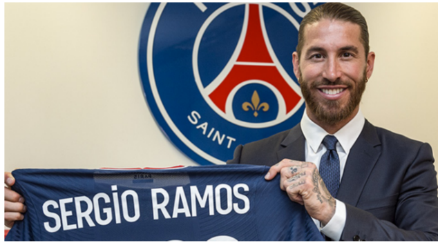
راموس يعرض قميص سان جيرمان

أي مباراة بالقميص الباريسي منذ انضمامه قادمًا من ريال مدريد بسبب إصابة عضلية في الساق، بينما يغيب بيرنات الذي حسم تأهل المنتخب الألماني لنهائيات كأس العالم، وقال موسيالا في مقطع فيديو