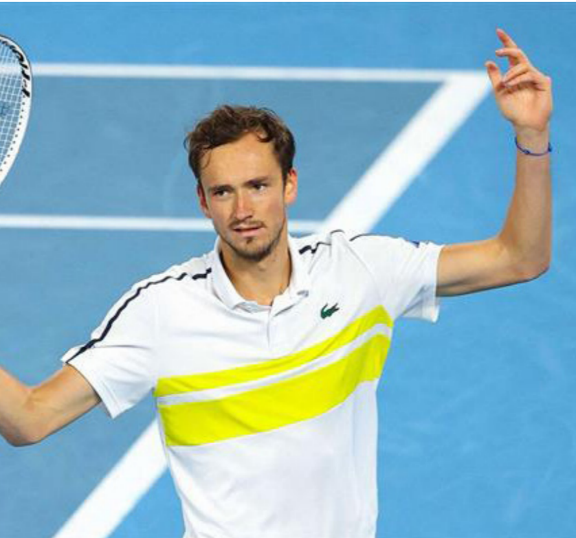
الروسي دانييل ميدفيديف

حاولت الأمريكية العودة في النتيجة خصوصاً بعد أن ذلت الفارق (3-4) وكانت لها ككرة التعديل لكن البطلة التونسية لم تترك لها الفرصة لتنهى المجموعة لصالحها بنتيجة 3-6. وستواجه جابر في الدور ثمن النهائي اللاعبة الروسية أنا كالبينسكايا المصنفة 93 عالمياً والتي أزاحت في الدور الثالث اللاعبة السويسرية فيكتوريا جوليبينش المصنفة 46 عالمياً مجموعتين مجموعة بواقع 1-6 و6-1 عقب فوزها على الأمريكية كوري جوف من العيار الثقيل، بفوزه على النجمة التشيكية كارولينا بليسكوفا المصنفة الأولى للبطولة 3-6 و5-7 لتطيح بها من الدور الثالث. وكانت بياتريز قد خسرت أمام الأمريكية أوسوي مايتان أركونادا في آخر أدوار التصفيات المؤهلة للبطولة، لكنها حصلت على فرصة ثانية للمشاركة إثر انسحاب ناديا بوبوروسكا المصنفة 29 للبطولة بسبب إصابة في الفخذ، حسب ما أشار إليه موقع الرابطة العالمية للاعبات التنس المحترفات. واحتاجت بياتريز إلى ساعتين و4 دقائق للفوز على بليسكوفا المصنفة الثالثة على العالم، والتأهل إلى الدور الرابع حيث تلقتي الإستونية أنيت كوتانفيت