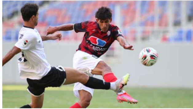
جانب من مباريات الدوري الممتاز