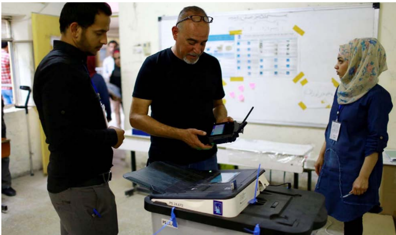
جانب من الانتخابات