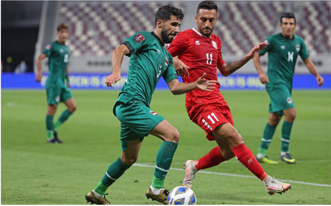
لقطة من مباراة سابقة بين العراق والإمارات

ملعب الملك عبد الله الثاني في الاردن ملعب سوريا المفترض في التصفيات الآسيوية. إلى ذلك، يواصل لاعب المنتخب الوطني ريين سولافا، اختفى في بوريرام يونانيد التايلاندي. غيابة عن الفريق الوطني بسبب الإصابة وقال المدير الإداري للمنتخب