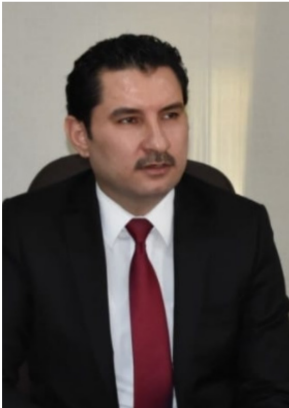
شاخوان عبد الله

السيرة الذاتية لشاخوان عبد الله احمد. الذي جرى التصويت على تسميته نائباً ثانياً لرئيس مجلس النواب للدورة البرلمانية الخامسة في العراق. حصل شاخوان عبد الله. النائب عن الحزب الديمقراطي الكردستاني (31 مقعداً) على 180 صوتاً مقابل 23 صوتاً لمنافسته سرور عبد الواحد عن «حركة الجيل الجديد» المعارضة في إقليم كردستان شمالي العراق. التي فازت به مقاعد. شاركت في العديد من العمليات الامنية لملاحقة خالبا وجماعات الارهابية في كركوك. وصلاح الدين وديالى وموصل. الاسم/ شاخوان عبد الله احمد. الموالي/ 1979 كركوك. التحصيل الدراسي: دكتوراه قانون. بكالوريوس عسكري. المناصب الوظيفية: مدير قانوني لدوائر التجارة في كركوك الى سنة 2005. مدير قانوني للتحقيقات المدنية في كركوك. في مجلس امن الاقليم. في محافظة كركوك للفترة من 2005 الى 2014. عمل استاذاً في جامعة جيهان للفترة من 2014 الى 2014. عضو مجلس النواب للدورة الثالثة 2014 الى 2018. مقرر لجنة الامن والدفاع. عضو ونائب ورئيس لعديد من اللجان النيابية والتحقيقية. فاز بعضوية مجلس النواب للدورة الخامسة.