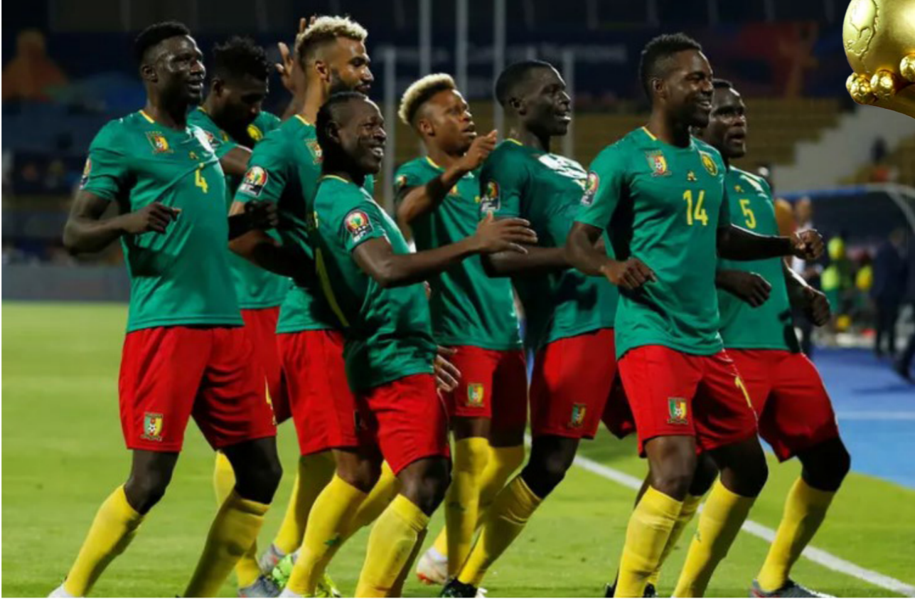
من اجواء احتفال لاعبي الكاميرون بالتأهل

وأضاف الكاف عبر بيانه: «يوجد اتصالات مستمرة مع الحكومة الكاميرونية واللجنة المنظمة». وأن: «كاف باتريس مونتسيبي رئيس الكاف، فيرون موسينجو وأوبا الأمين العام، بزيارة المشجعين للصين في مستشفى باندي».