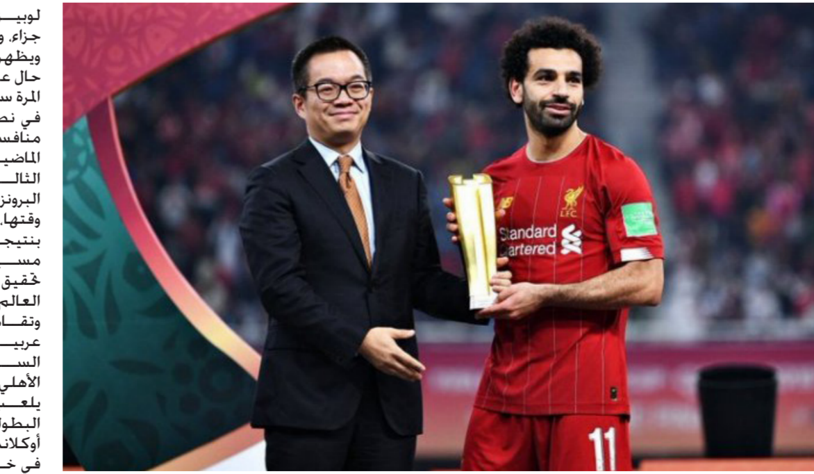
صلاح .. إنجاز كبير في مونديال الأندية

لوبيز وهو مبريتو سواوز من ضربة جزاء، وأحرز للأهلي عماد متعب. ويظهر الثأر أمام الأهلي مرة أخرى حال عبور عقبة مونتيري. لكن هذه المرة سيكون شعار بالبراس البرازيلي، في نصف النهائي وأحرج الأهلي منافسه بالبراس في النسخة الماضية، بعدما خطف منه المركز الثالث في المونديال، ونال الميدالية البرونزية. وتعادل الفريقان دون أهداف وقتها، وفاز الأهلي بركلات الترجيح بنتيجة 3-2. ويبقى الإنجاز الأكبر في مسيرة النادي الأهلي المونديالية خفيق المركز الثالث مرتين في كأس العالم للأندية عامي 2006 و2021. وتقام البطولة بمشاركة 3 أندية عربية هي الأهلي المصري، والهلال السعودي والجزيرة الإماراتي. وضمن الأهلي خطيم رقم قياسي عندما يلعب مباراته رقم 16 في تاريخ البطولة، ليفض المشاركة مع أوكلائد سيتي بعد تساويهما سابقاً في خوض 15 مباراة عبر جميع المشاركات، وهما الأكثر مشاركة في مباريات بالمونديال، وكان الإنجاز الأكبر للأهلي في البطولة، هو خفيق المركز الثالث مرتين، آخرهما العام الماضي، لكن الإنجاز المصري الأهم بمونديال الأندية جاء عبر محمد صلاح، نجم