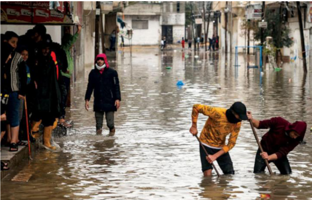
شبان يحاولون فتح الصرف الصحي في شارع غمرته المياه في مخيم جباليا قطاع غزة

«لا يملك الجميع إلا العمل من أجل الوصول إلى هذا الحل (حل الدولتين)، لأن البديل هو المزيد من الصراع والتوتر الذي سينعكس على الجميع». هذا، وكانت آخر مفاوضات بين الفلسطينيين والإسرائيليين، قد توقفت في أبريل (نيسان) 2014، وستسعى مصر والأردن البدء من حيث انتهت هذه المفاوضات، لكن في إسرائيل لا توجد مؤشرات حول إمكانية قبول مسار سياسي جديد، ورفض رئيس الحكومة الإسرائيلية، نفتالي بينت،