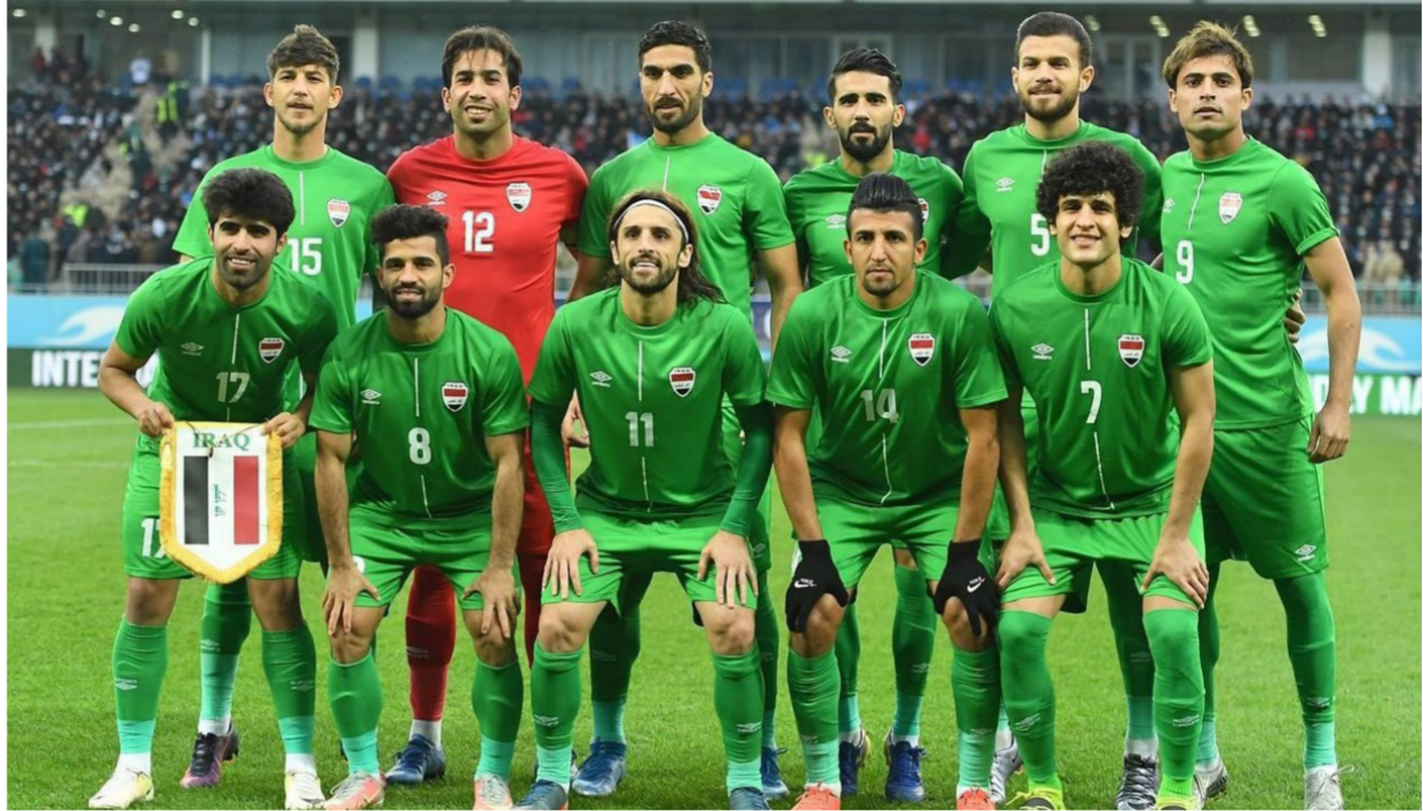
المنتخب الوطني لكرة القدم

وأهله قليل بحقهم، وهم يسعون ويعملون جاهدين على رفع الحظر المفروض على ملاعبهم، ونحن نعمل بجد على مساعدتهم لنيل المبتغى، وما حقق في بطولة غرب آسيا للشباب في أربيل والبصرة أمر مثالي، فضلاً عن المباراة الختامية في بغداد والتي كانت أول مباراة رسمية منذ عام 2001، وحثهم فيها بامتياز. وأفاد: أن حُسن إدارة الملاعب والتقدير بالتعليمات أمر مثالي لتحقيق النجاح الذي نتوخاه، وإن إدارة الأمن والسلامة تمثل التوازن بين الملعب الجيد وإدارة الملعب، إلى جانب متطلبات الأمن والسلامة. واستطرد قائلاً: إن دور المسؤول الأمني في الملاعب لا يقل شأنًا عن مدير ومشرف البطولات والمباريات التي تضفيها بلدانهم، إلى جانب أنه يجب أن يكون هناك مسؤول أممي في اتحاد الكرة وفي كل ملعب وفي الأندية كافة.