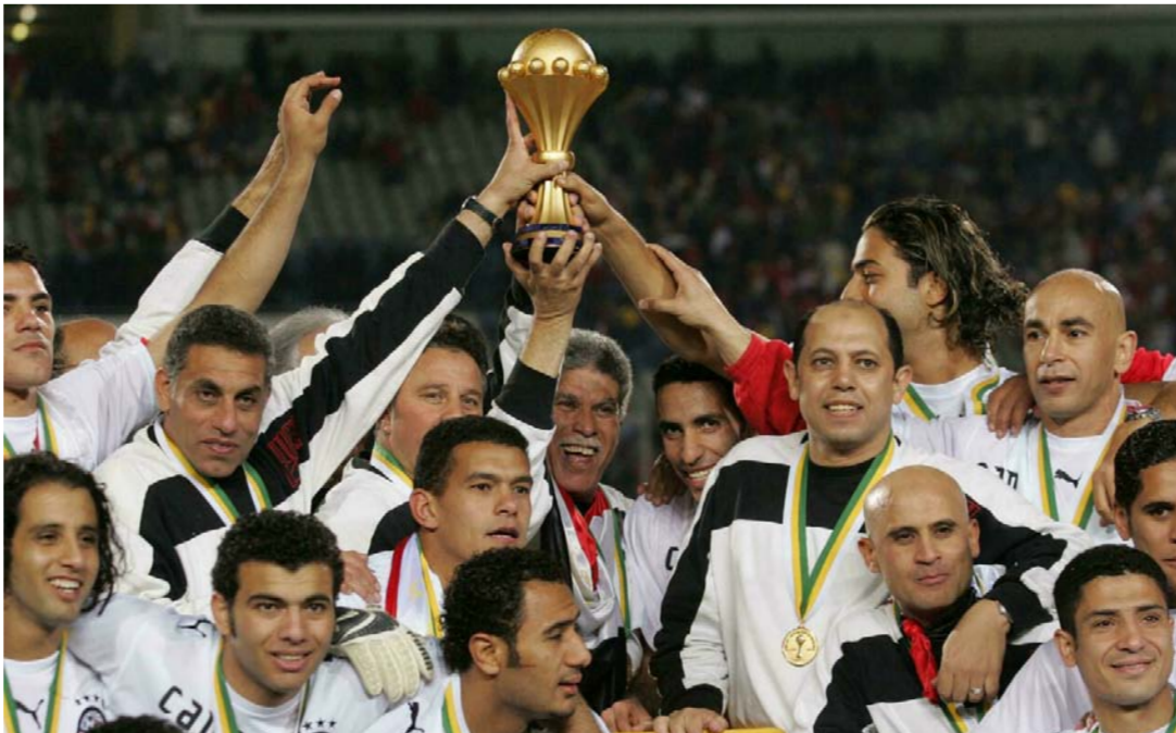
لقطة ارشيفية لمنتخب مصر متوجاً بكأس أم أفريقيا

حالياً في الكاميرون .. كانت مصر أكثر البلدان الأفريقية تنظيمًا