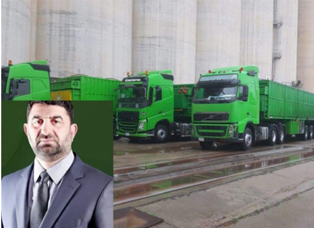
جانب من اسطول النقل البري والى يسار الصورة مدير عام النقل البري

وتأتي هذه النقلات لإجاء موسم الاستزراع الشتوي للمساهمة في تحقيق الاكتفاء الذاتي من المحاصيل الزراعية . حيث حقق الاسطول الحكومي للشركة هذه النقلات بواقع (27,300) طنا نقلت من معمل سمدة خور الزبير في البصرة الى مخازن وزارة الزراعة المنتشرة في محافظات العراق ضمن عقد النقل المبرم معها . وهناك مناقلات داخلية تراقق هذه النقلات لمادة السماد بين مختلف المحافظات لتحقيق التوازن في توزيع المنتج كل حسب حاجتها ضمن خطط الحكومة المركزية لإجاء برامجه الزراعية يشار إلى إن الاسطول البري يواصل عمله برغم ظروف الطقس القليلة في مناطق عديدة من البلاد لارتفاع باء الشركة وتحقيق الوفرة المالية .