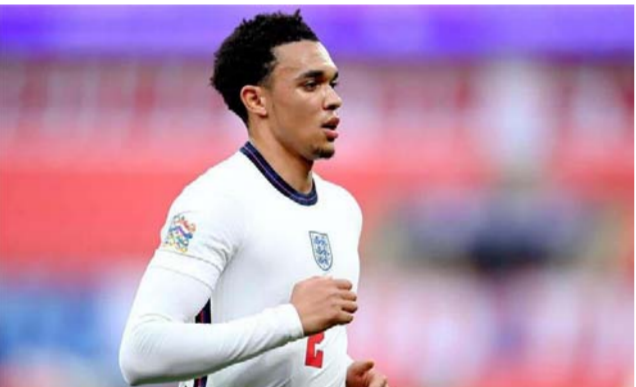
الإجليزي تينت ألكسندر أرنولد

ليونيل ميسي. لاعب باريس سان جيرمان (47 تمريرة).