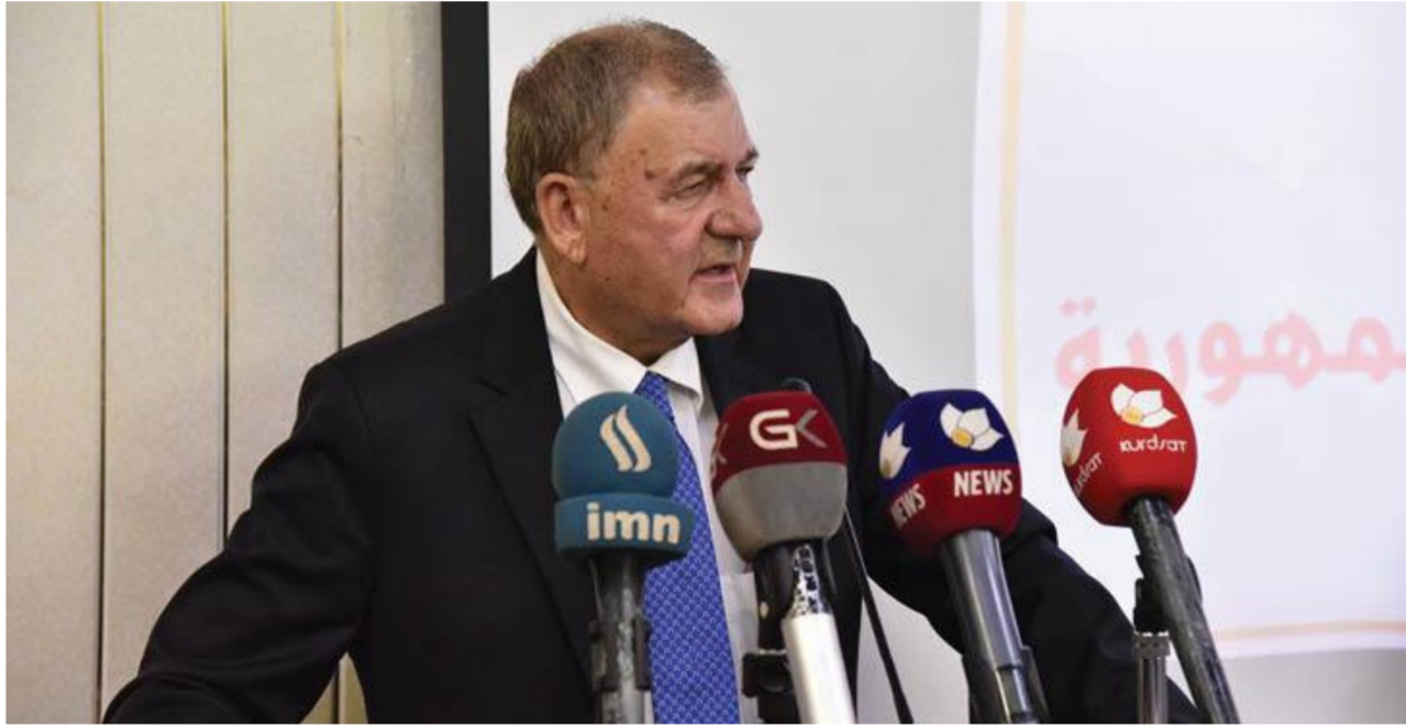
الدكتور عبد اللطيف رشيد

جميع الاطراف العراقية بإجاء ايجاد الحلول للملائمة للمشكلات بين الاقليم والمركز. انا لا اؤم طرفا بحد ذاته واعتقد بان المسؤولية متبادلة بين الجانبين لان الطرفين اخفقا في معالجة المشكلات. ضد الان ليس لدينا قانون للنقط والغاز مع العلم بان موارده النفط تمثل 95 بالمئة من واردات البلاد. اضافة الى الكثير من القوانين.