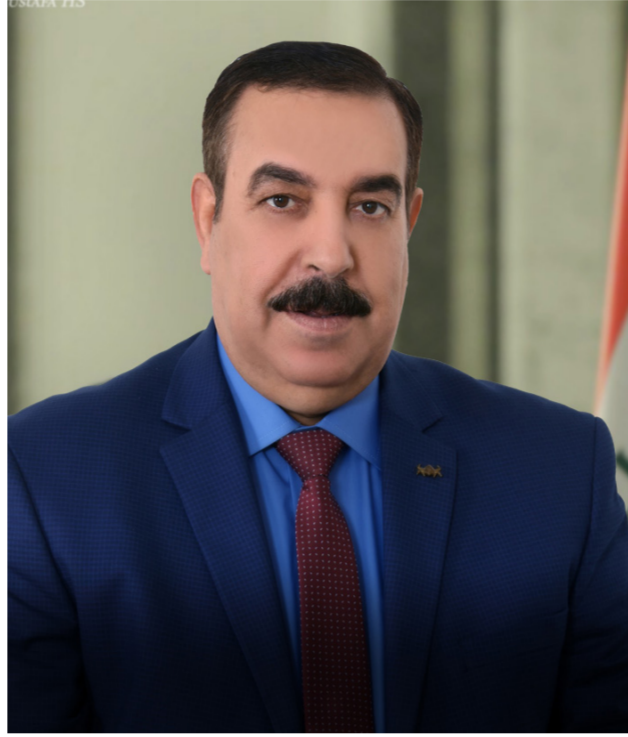
محافظ الأنبار علي فرحان

واضاف عصام الدخيل أننا نقدم الشكر والعرفان إلى علي فرحان محافظ الأنبار المحترم لما يوليه من رعاية واهتمام مستمر تجاه نادي الرماي الرياضي وأنا كرئيس