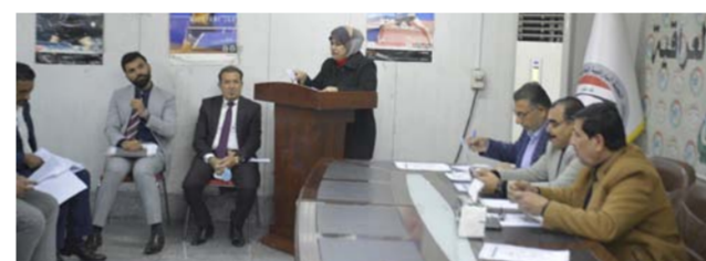
اجتماع الهيئة العامة للجنة البارالمبية