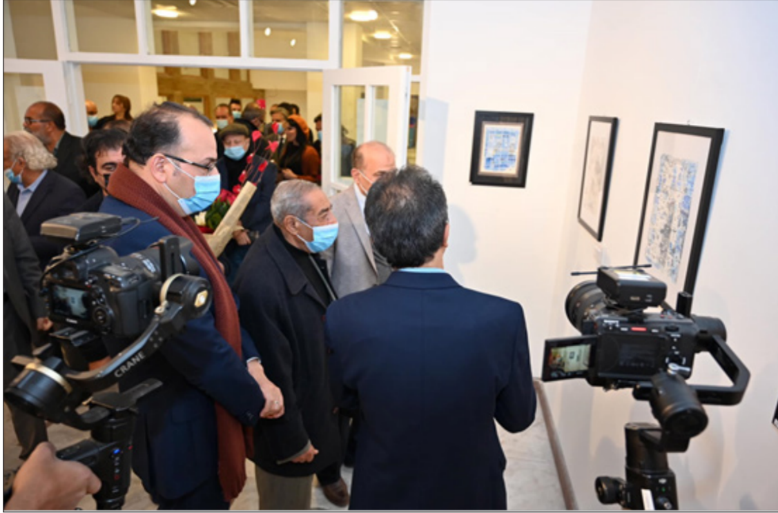
جانب من المعرض

اللوحة قابلة للحذف والاضافة لكن الورق لا يقبل التغيير والحذف والاضافة لأنه مادة ذات حساسية عالية يحتاج الى خبرة وتجربة وان كان العمل بالورق