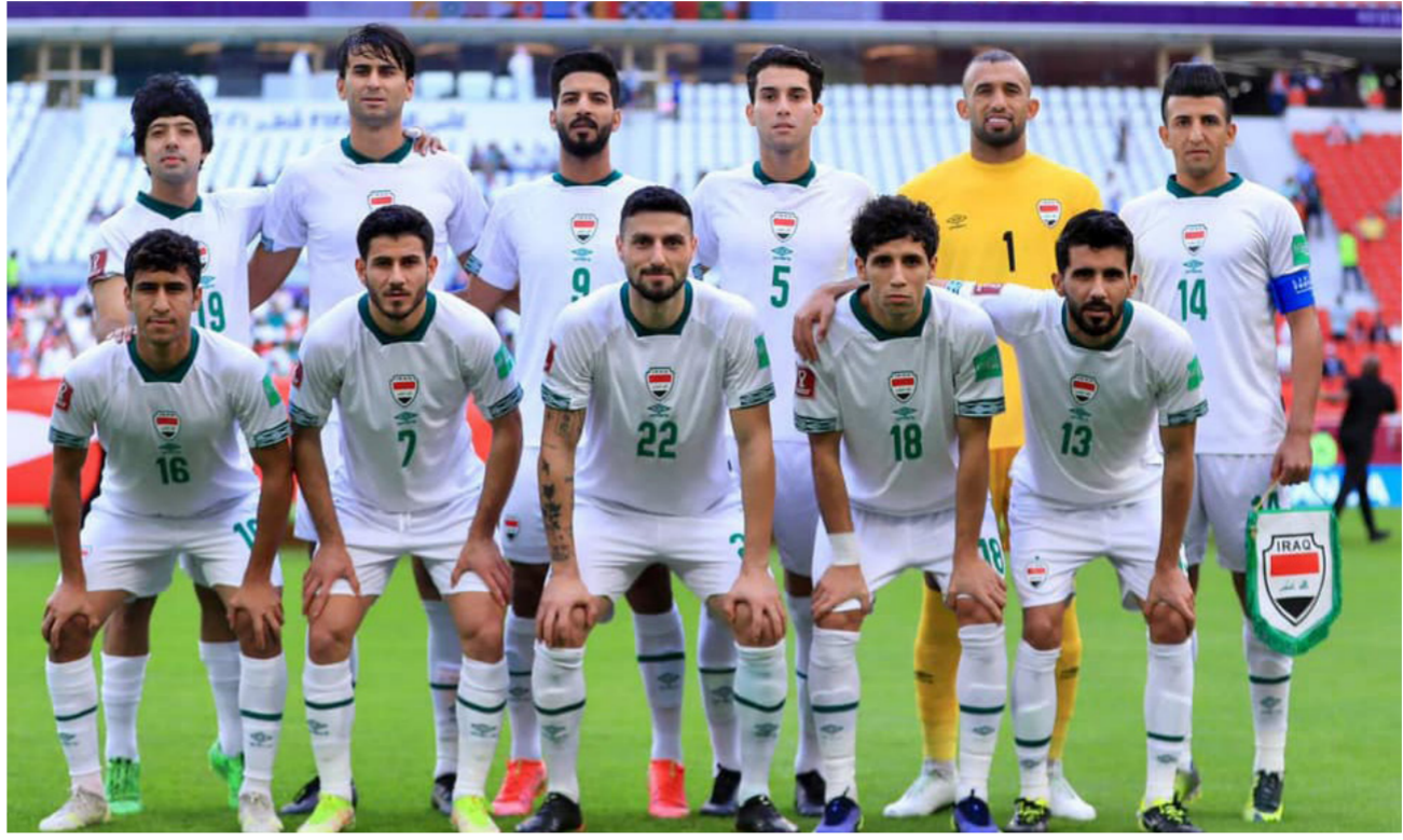
المنتخب الوطني لكرة القدم