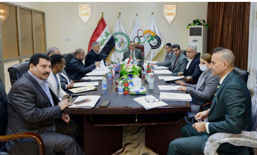
اجتماع اللجنة الأولمبية