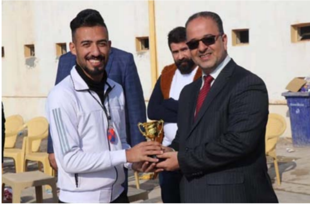
تتويج متوسطة عمر المختار بكأس كرة اليد