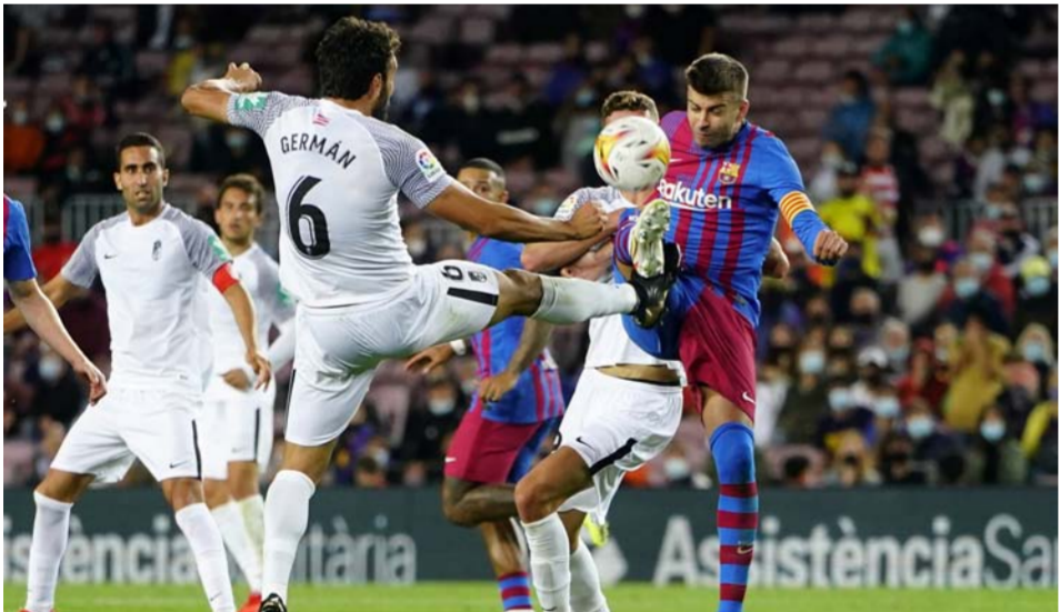
لقطة من مباراة برشلونة وغرناطة

برشلونة، في صيف 2014، قاداً من بوروسيا مونشنجلادباخ. وأكد الإسباني جيرارد بيكبي، مدافع برشلونة، أنه لم يستحق الحصول على بطاقة حمراء أمام غرناطة كما يردد البعض، مشيراً إلى أنه لم يحصل على بطاقة صفراء من الأساس، وكتب بيكبي عبر حسابه على «تويتر»: «عقب المباراة مباشرة: «الأولئك الذين يشتكون على حصولي على بطاقة حمراء، سيكفون من الجيد أن تعلموا أنني أنهيت المباراة بدون بطاقة صفراء، لذا يجب أن تعلموا قبل الاحتجاج».