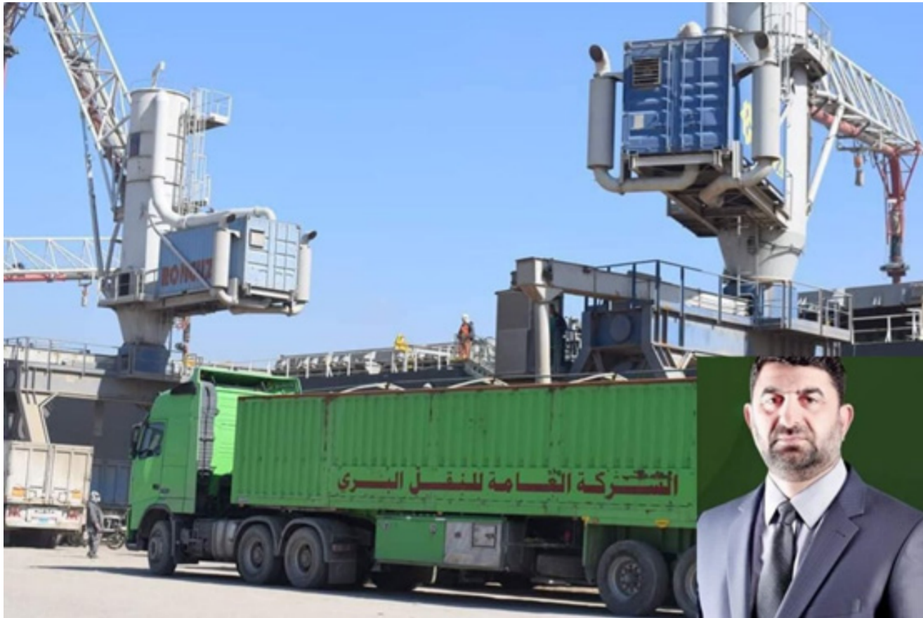
أسطول الشركة العامة للنقل البري والى اليمين صورة المدير العام

الداب وبذور الخنطة لصالح وزارة الزراعة.. أعلن ذلك مدير عام الشركة مؤكداً الاهتمام الكبير والدقيق بتنفيذ عقود النقل مع وزارات الدولة حيث وصل الأسطول البري جهده اللوجستي . إذ إنسى من نقل هذه الكمية تختلف الجوار وشملت (1500) طن من سجاد الداب من محافظات واسط وبابل والديوانية الى محافظة كركوك . تبعها (500) طناً أخرى من محافظات ذي قار وميسان والمثنى الى محافظة نينوى . فيما نقلت (164) طناً من بذور الخنطة من محافظة بابل الى محافظة نينوى . كما نقلت (100) طناً من مخازن شركة ماين النهرين في بغداد واليوسفية الى محافظة صلاح الدين.