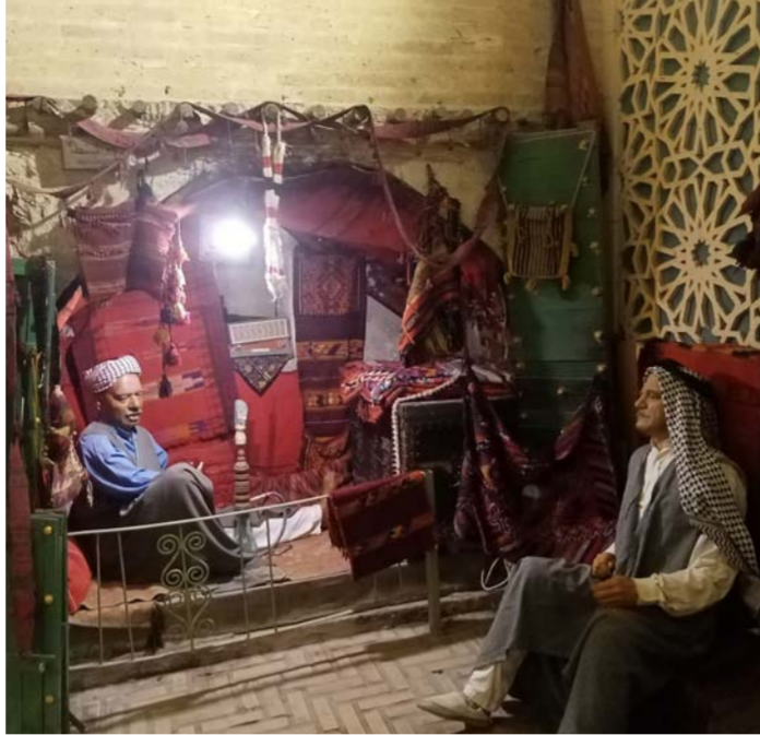
لقطة من مشاهد المتحف