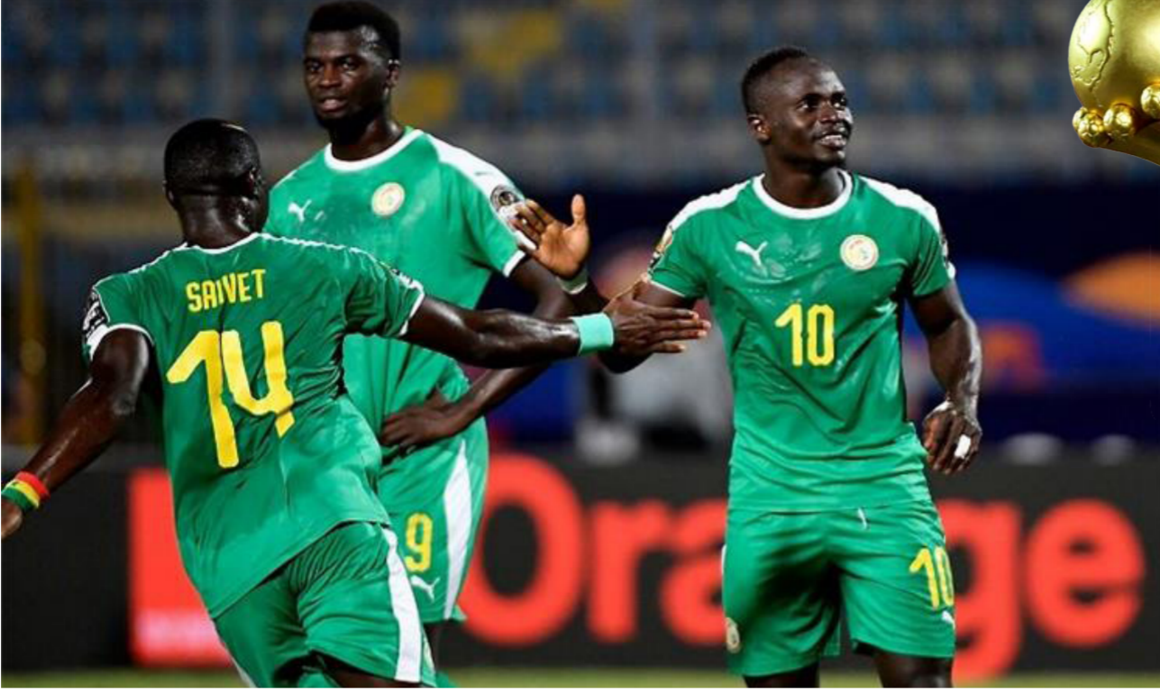
لاعبو منتخب السنغال

إلى ذلك، نشرت الصفحة الرسمية للشركة (برينزينشن سبورتس) الراعية للمنتخب المصري عدة صور رسمية لبعثة الفرانسة في جلسة تصوير خاصة قبل خوض منافسات بطولة كأس الأم الإفريقية 2022. وجاهلت الشركة الراعية للفرانسة ضياء السيد المدرب العام لمنتخب مصر ولم تنشر صورته من دون أسباب واضحة. رغم ظهور باقي أعضاء الجهاز الفني بقيادة البرتغالي كارلوس كيروش اللات أن الشركة نشرت صور اللاعبين ضمن تصميم يحمل شعارات العديد من الشركات المعلنه ومن بينها شركة اللباس الراعية لمنتخب مصر.