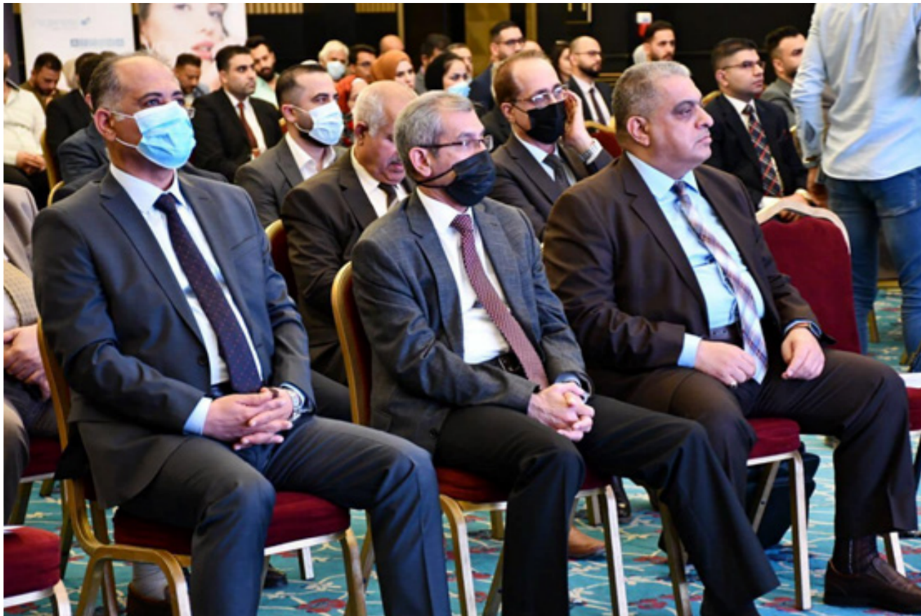
جانب من مشاركة وحضور نقابة اطباء العراق فرع البصرة بأحد المؤتمرات الطبية