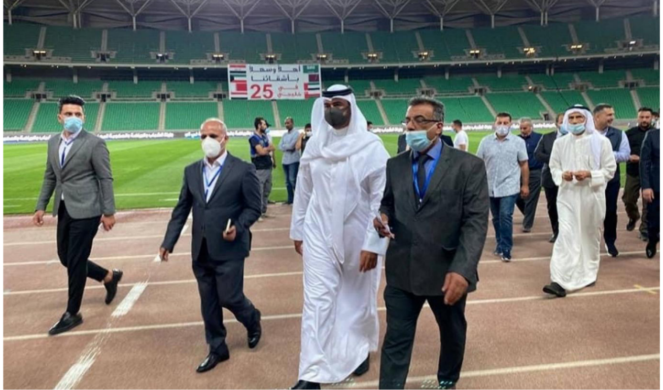
جولة تفضية خليجية للمعب البصرة الدولي

إلى ذلك، فقدت هيئة الرأي في وزارة الشباب والرياضة برئاسة الوزير