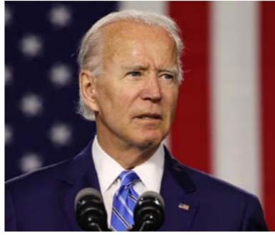
عبد الفتاح السيسي