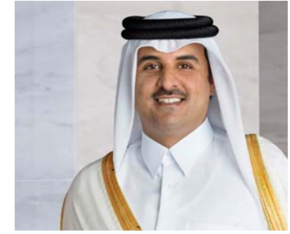
تميم بن حمد آل ثاني

ونشر الرئيس الأمريكي جو بايدن صورة تفاعلية للاحتفال بالعام الجديد مععلقا عليها «عام سعيد يا رفقاء». ولم تبذل نائبته كامالا هاريس