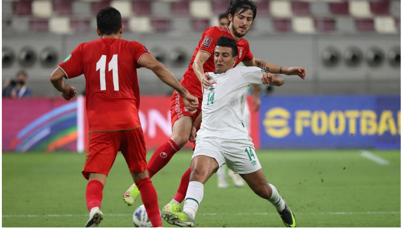
لقاء سابق لمنتخبنا الوطني امام إيران

وستتجمع لاعبو المنتخب العراقي يوم 17 كانون الثاني 2022، ويخوض المنتخب مباراة ودية في 21 من الشهر المقبل. استعداداً للقاء إيران في طهران يوم 27 كانون الثاني