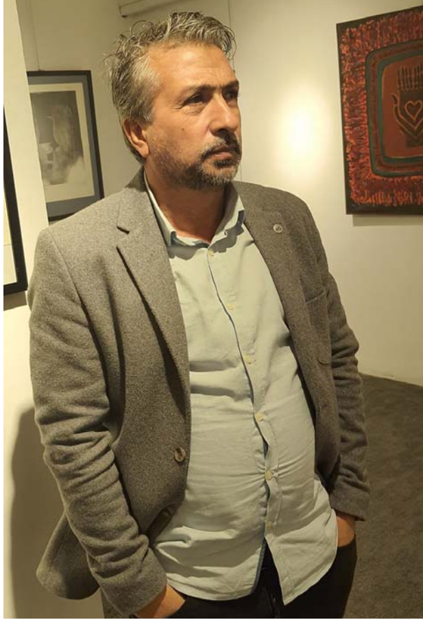
مدير قاعة أكد

وتابع ناجي: بعد أحداث 2003 اغلق شارع ابي نوّاس لسنوات وحاولت ان اعيد افتتاحها عام 2008 بمعارض رصينة وبإشراف امانة بغداد وتواصلت حتى عام 2011 لكنني كنت اجد ان شارع ابي نوّاس اصبح خطراً والوصول اليه ليلا يتشكل صعوبة بل وجدته غير مؤهل لافتتاح قاعات فنية. سيما ان المعارض تقام مساءً. وبالرغم من ذلك كنت ابدل محاولات للحفاظ على القاعة. لكنني خسرتها وغادرت العراق عام 2013 الا ان سنوات الغياب عرفتني انها قد تركت فراغاً كبيراً في ساحة التشكيل كونها المنفس للفنانين. واسمها له وقع واهمية لدى التشكيليين فقررت العودة الى بغداد والبحث عن مكان يليق بافتتاحها. وبعد دراسة لصلاحية افتتاحها من جديد وجدت مكاناً ملائماً في منطقة المسبح فأعلنت للوسط الفني انهم على موعد مع فعالية كبيرة في افتتاح معرض كبير سيكون في الايام الاولى من العام الجديد.