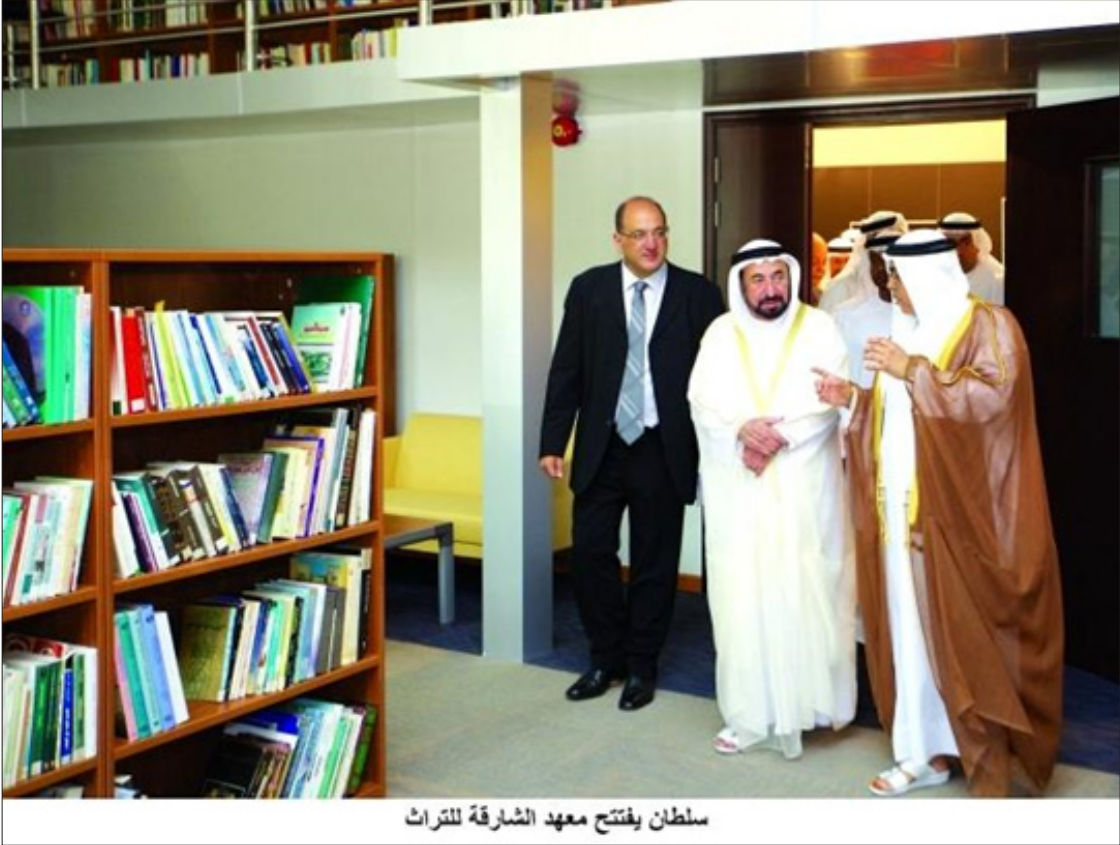
سلطان يفتتح معهد الشارقة للتراث

ويعمل معهد الشارقة للتراث. وفق مجموعة من القيم. والمبادئ الثابتة. والتي من بينها: ممارسة التفكير العلمي. ودعم قيم التعددية والحوار والتسامح. والالتزام بأخلاقيات البحث والتوثيق. والسعي الدائم للتعرف