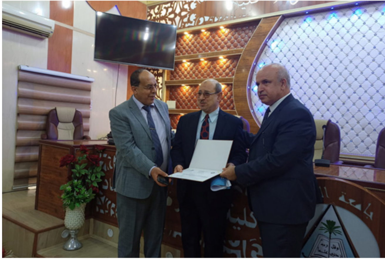
عميد الكلية يقدم شهادة تقديرية لأستاذ اللغة العربية في الكلية

وتهدف الزيارة إلى تفقد أوضاع الأطفال وأحوالهم في دار الأيتام وتخفيف الأعباء عنهم. وتضمنت الزيارة تفقد غرف وقاعات الدار ورفع الروح المعنوية للأطفال ورسم الابتسامات على وجوههم من خلال توزيع الهدايا العينية التي ابهجت نفوسهم بالبيتهمة. ودعا المشاركون بالزيارة إلى تكرار مثل هذه الزيارات وجمع التبرعات للأطفال الأيتام للمساهمة بتلبية احتياجاتهم والسعي المستمر لتحفيز الأفراد وباقي مؤسسات المجتمع على الاهتمام بهذه الفئة. من الجدير بالذكر أن دار البراعم للإيتام تقوم بتنمية قابليات وقدرات الأطفال من خلال البرامج التدريبية والثقافية والاجتماعية والفنية والتربوية وتوفير لهم الحنان العائلي الذي افتقدوه.