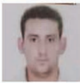
جمهورية العراق مجلس القضاء الأعلى رئاسة محكمة استئناف الابواب الاحادية محكمة تحقيق هيت

زاكرس كرمينشاه الإيراني 34-22 في أولى مبارياته ضمن معسكره القادم في إيران. كما حقق فوزاً ثانياً على فريق زاكرس كرمينشاه الإيراني 23 43 في ثاني مبارياته ضمن معسكره المقام في إيران.