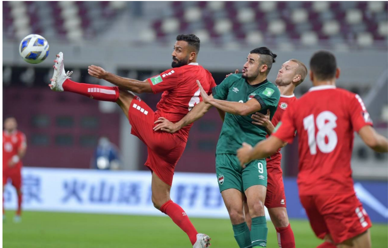
منتخبنا الوطني في مباراة سابقة امام لبنان