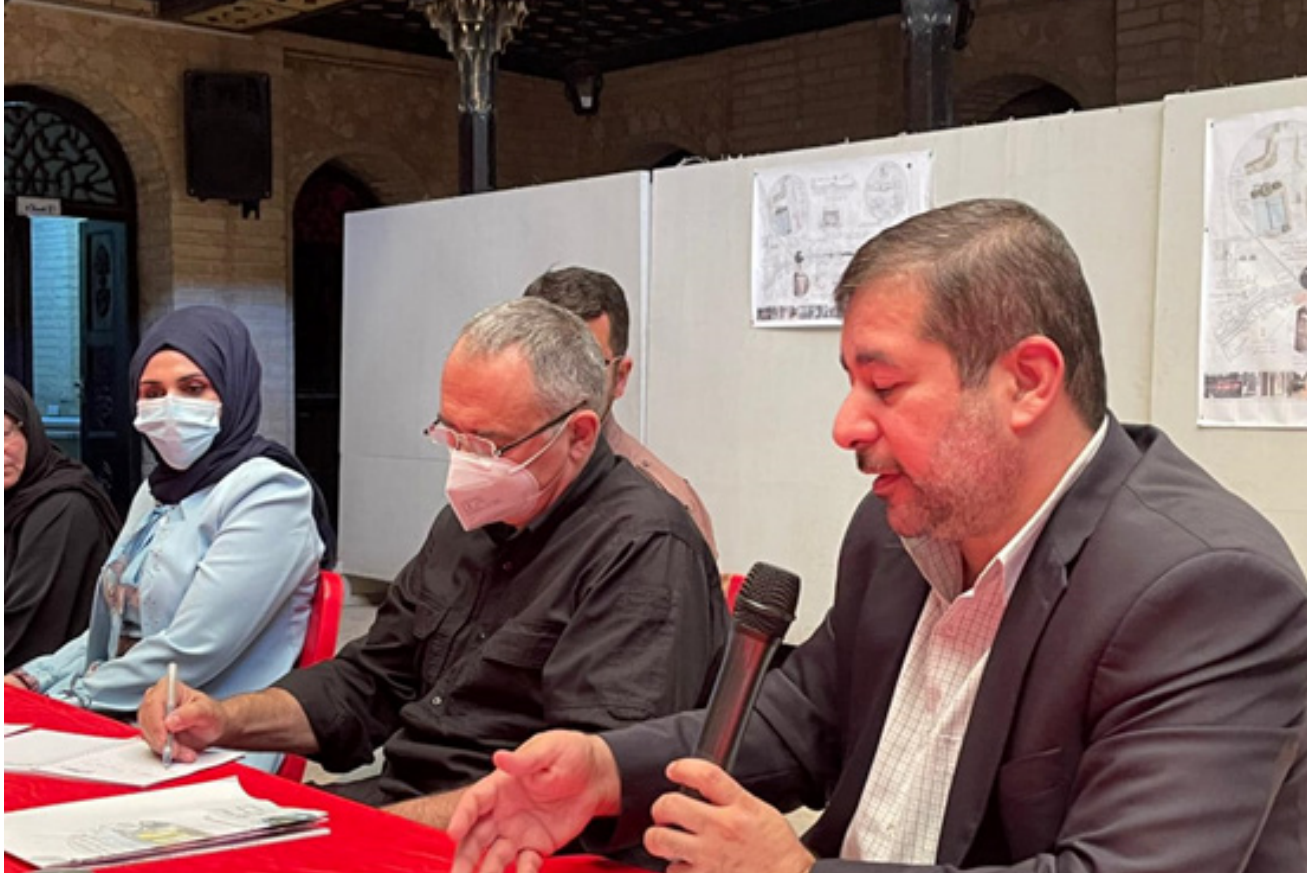
النائب الإداري لمحافظة البصرة يتحدث في اجتماع منظمة اليونيسكو