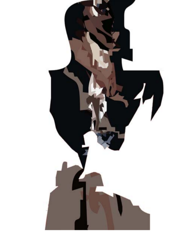
من أعمال الفنان الراحل احمد الربيعي

بعد أن أعلنت دار الشؤون الثقافية العامة عن إطلاق مسابقتها بالتعاون الكامل مع كلية دجلة الجامعة. وردت إلى الدار عشرات النتاجات الإبداعية في الشعر والقصة القصيرة. والمسرح. والدراسات النقدية. ولم ترد اسهامات ضمن حفل الدراسات الفكرية يمكن أن تشكل مجالاً للتنافس لذا حجت إدارة الجائزة فرع الدراسات الفكرية. وبعد أن قامت اللجنة المختصة في الدار بفرز الأعمال المشاركة. شكلت اللجان النقدية المحكمة لحقول الجائزة الإبداعية. من نخبة من الأسماء النقدية والإبداعية في العراق. وبعد