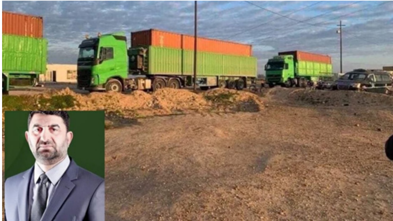
أسطول شركة النقل البري يواصل نقل الحمولات والى اليسار صورة المدير العام

هناك مناقلات داخلية مستمرة بين المحافظات لتحقيق التوازن في توفير الاسمدة حسب حاجة المزارعين بموجب الخطط المركزية التي أعدت لهذا الغرض