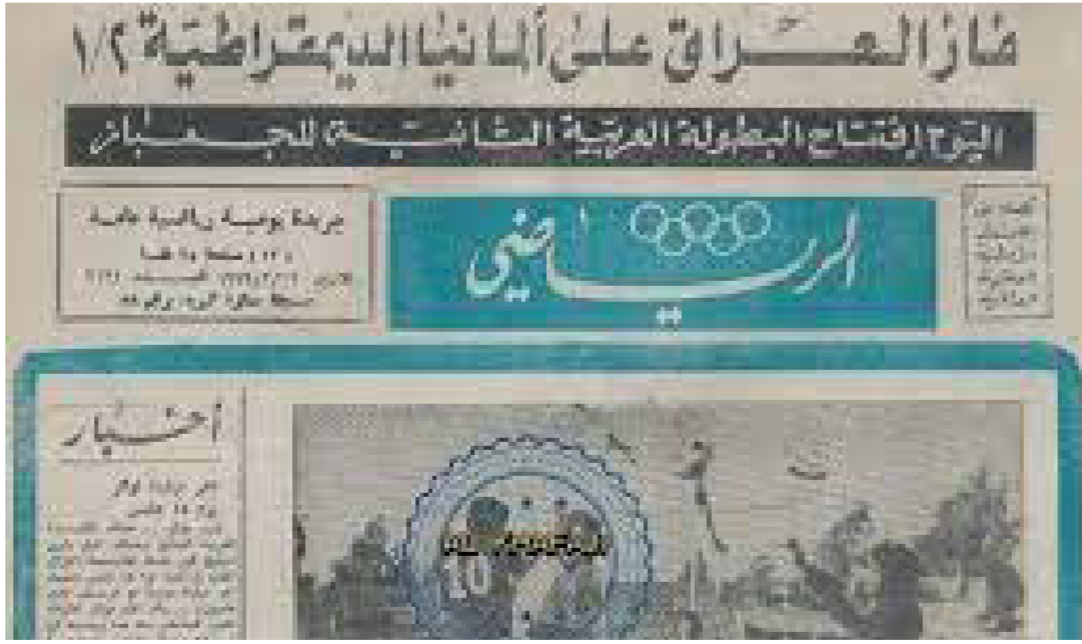
صحيفة الرياضي من الارشيف

بعض الصحف والمجلات الرياضية مثل مجلة الرياضي وملحق الرياضة والشباب عن جريدة الجمهورية ومجلة الطليعة الرياضية