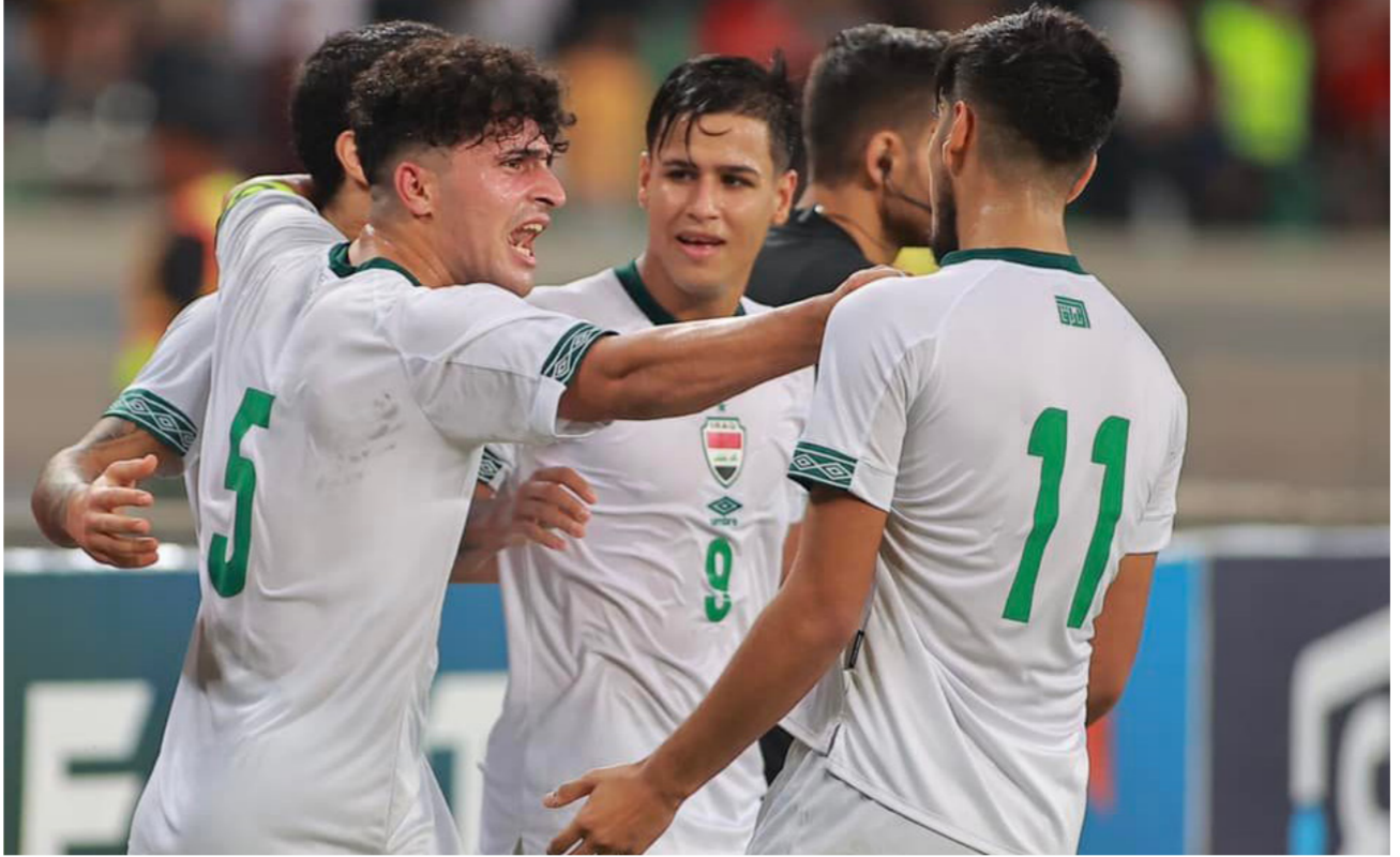
فوز كبير لمنتخبنا الشبابي في غربي آسيا

والداعمين لنا». من جانبه، ذكر مدرب منتخب الإمارات. الاسباني دانيال اورتيجا: إن «هدفنا هو إعداد جيل جديد من الشباب وتطويره للمستقبل». وعبر عن شكره لفرق الشباب الاردن.