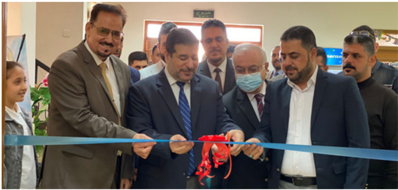
النائب الاداري محافظ البصرة يقص شريط افتتاح معرض مستلزمات التربية والتعليم

الكثير وتم إبلاغ المدارس ان تقوم بزيارة هذا المعرض الذي سيستمر لأربعة أيام من التاسعة صباحا ولغاية الرابعة عصرا لتطلع على أحدث الاصدارات في عالم المعرفة اضافة الى ماوفرته الشركات التي اقامت المعرض من وسائل ايضاً ومستلزمات تخدم المختبرات المدرسية وضرورة الشراك عدد من التلاميذ والطلبة في زيارة المعرض وكذلك توجيه الدعوة لأولياء أمورهم ليتعرفوا على مجودات المعرض .