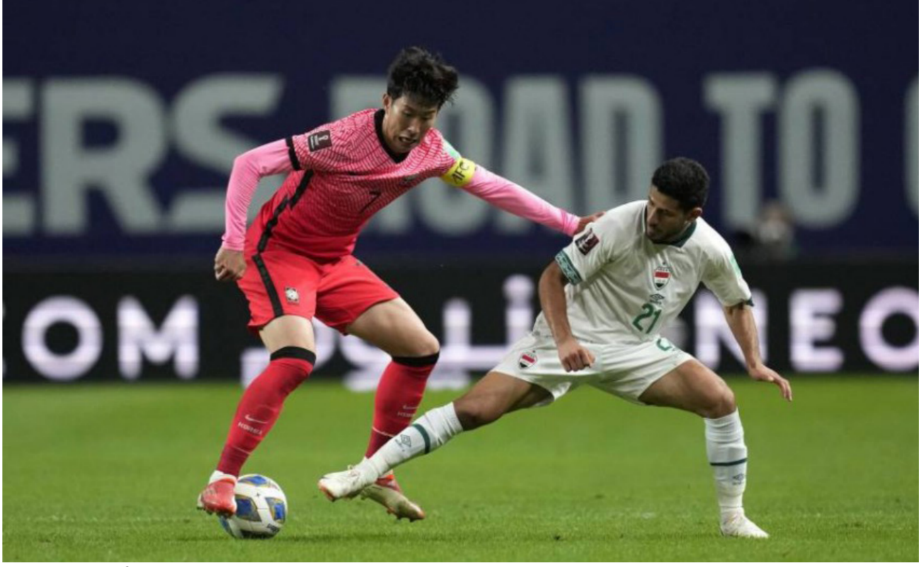
لقطة من لقاء الذهاب أمام كوريا الجنوبية

ويقف منتخبنا الوطني رابعا في ترتيب المجموعة الآسيوية الثانية وله 4 نقاط. ويتصدر إيران المجموعة وله 13 نقطة ثم كوريا الجنوبية بـ 11 نقطة، ولبنان ثالثا وله 5 نقاط، والإمارات خامسا برصيد 3 نقاط. سوريا بالمرتبة السادسة الاخير وله نقطتين. وكان منتخبنا الوطني قد تعادل امام كوريا الجنوبية سلبا في افتتاح جولاته ضمن التصفيات الخامسة في المباراة التي جرت في سيول. وتعد مباراة اليوم هي الفرصة الأخيرة لمنتخبنا في حال خقيقه نتيجة ايجابية ان يواصل المنافسة على احراز البطولة الثالثة في المجموعة بعد سلسلة نتائج غير مشجعة حققها منتخبنا الوطني تحت اشراف المدرب الهولندي الحرف أرفوكات. المباراة سيقودها طاقم حكيمي أوزكي بقيادة الجيز