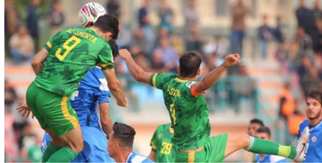
الشرطة يعزز صدارته

المرکزي لكرة القدم تغيير موعد مباراة القوة الجوية والتجف المقر