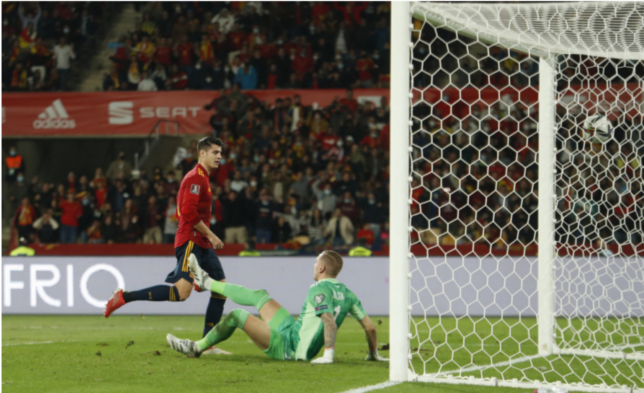
موراتا يسجل هدفة في مرمرى السويد

أضاف زميله أوتري دودا الهدف الثاني قبل أن يعود روسناك ويوقع على الهدف الثالث في الدقيقة السادسة عشرة.. وفي الدقيقة السابعة والأربعين طرد لاعب مالطا ريان كامينزولي بعد تدخل عنيف وبعدها بقليل طرد لاعب آخر مالطا هو تيدي توما لتستفيد سلوفاكيا من النقص العددي وتضيف الهدف الرابع عن طريق دودا ثم الهدف الخامس الذي سجله فيرنون دي ماركو قبل أن يوقع دودا على الهاتريك بهدف سداس لمنخب بلاده عند الدقيقة الثمانين. وفي المجموعة ذاتها، فاز المنتخب السلوفيني على ضيفه القبرصي بهدفين لهدف. أصحاب الأرض افتتحوا التسجيل عند الدقيقة الثامنة والأربعين بهدف ميهيا رايتس. وأضاف آدم جنيزدا ششرين الهدف الثاني في الدقيقة الرابعة والثمانين. وسجل أندرو نيكوس كاكليس هدف الضيوف الوحيد عند الدقيقة التاسعة والثمانين.