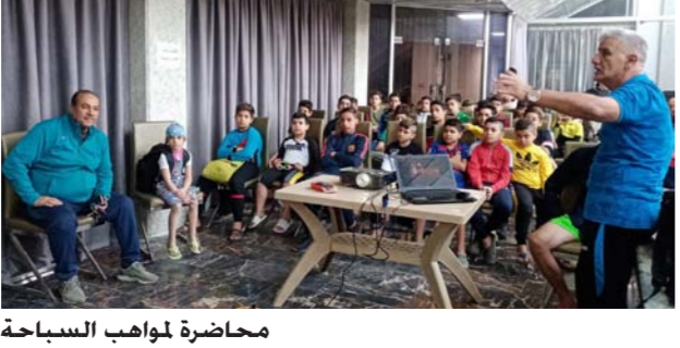
محاضرة لمواهب السباحة