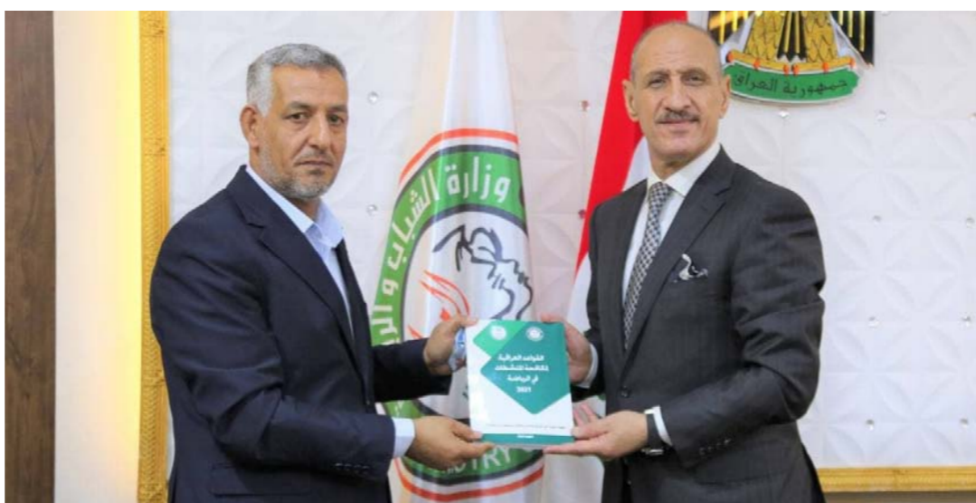
رجال يتسلم اللائحة الوطنية للمنشطات

ترشيح منتخب يمثل كل محافظة لفئتي الناشئين والشباب إلى الدور النهائي للمرحلة الثانية التي ستقام بنظام التجميع في إحدى المحافظات.