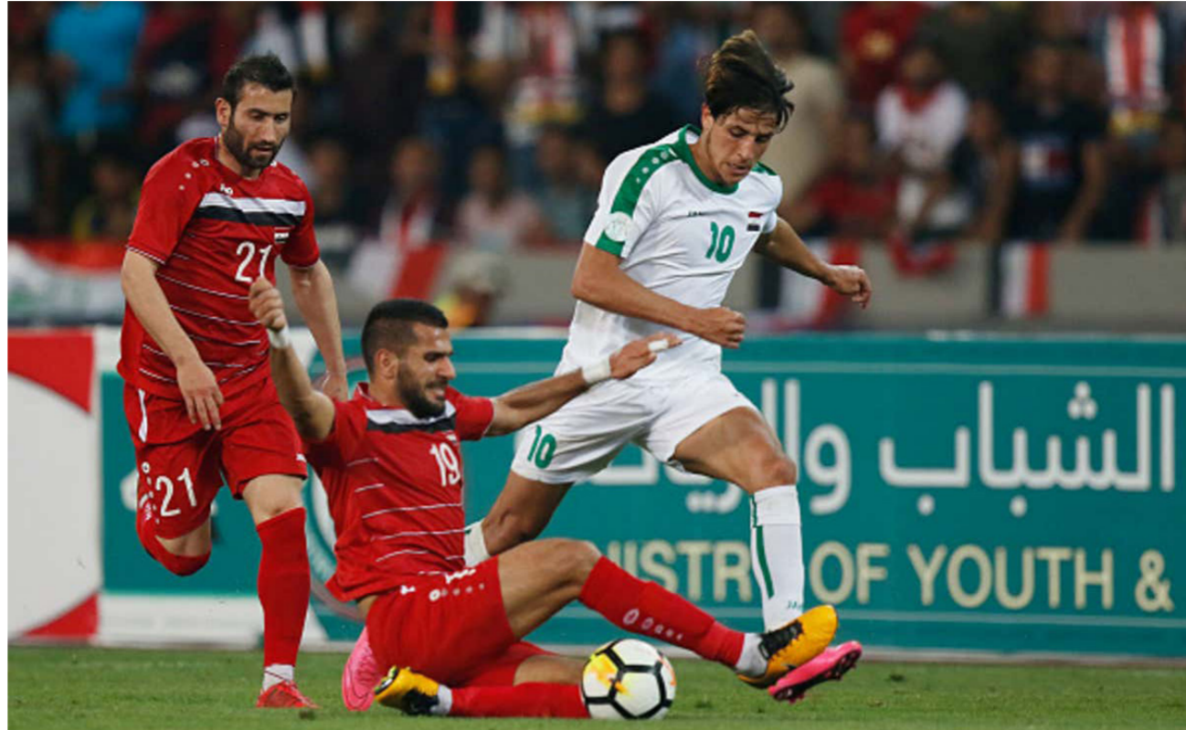
لقاء سابق لمنتخبنا الوطني امام سوريا