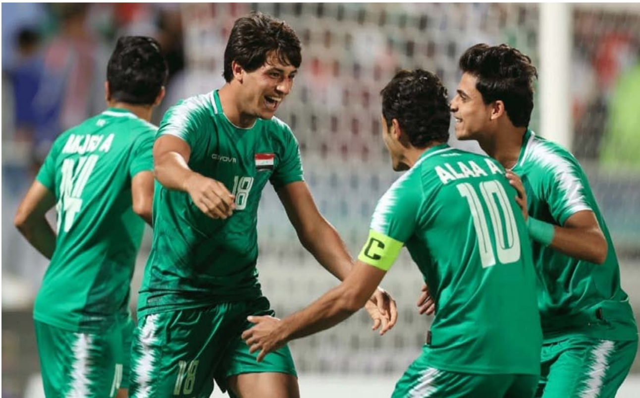
لاعبو المنتخب الوطني يحتفلون بفوز سابق

من المقرر ان يغادر اليوم الاحد وفد منتخبنا الوطني لكرة القدم إلى العاصمة القطرية الدوحة استعداداً لمواجهة سوريا وكوريا الجنوبية ضمن التصفيات الآسيوية المؤهلة إلى كأس العالم في قطر 2022. وأعلن مدرب منتخبنا الوطني لكرة القدم الهولندي ديك أدفوكات، قائمته المنتخب النهائية التي ستخوض مبارياتي منتخبنا سوريا وكوريا الجنوبية ضمن مباريات المجموعة الأولى للتصفيات الآسيوية المؤهلة لنهائيات كأس العالم قطر 2022، وضممت القائمة 27 لاعباً وهم كل من فهد طالب وأحمد باسل وعلي ياسين جراسنة الرمي، وحسين عمار وضياء فرانس بطرس وعلي عدنان ومهند جعاز ومصطفى ناظم وأحمد إبراهيم وعلي فائز وربيع سولاقا، وأمجد عطوان وأمير العماري ومحمد علي عبود وبنشار رسن ومحمد قاسم وأحمد فاضل وسجاد جاسم ومنتظر محمد جبر وأحمد فرحان وحسين جبار وشيخو كرم وجولوان حمد وأبراهيم بايش وعلي الحمادي وعلاء عبد الزهرة وأمين حسين. وسيواجه المنتخب العراقي منتخب سوريا في الهادي عشر من الشهر الحالي على ملعب الغرافة في تمام الساعة الثامنة مساءً ضمن مباريات المجموعة