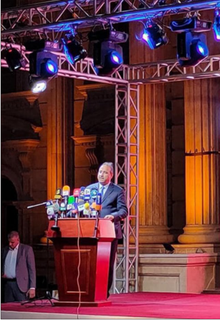
جانب من انطلاق المهرجان

وتابع: ما أحوجنا في العراق إلى هذا المهرجان الذي يجمعنا، ويجعلنا نتواصل من جديد مع الشعراء العرب