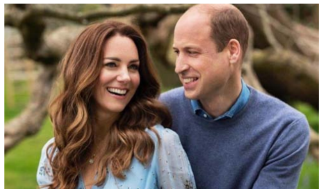
كانوا. واستخدام أصواتهم لإلهام صناع القرار، وتسجيل أعمالهم من أجل الكوكب. كما تدعم الحملة ونساعد الكشافة في تزييد الشباب

بالمهارات اللازمة للتصدي لتغير المناخ. حيث يساهم الملايين من الكشافة في جميع أنحاء العالم في حملة PromiseToThePlanet لزيادة الوعي بعواقب تغير المناخ وتشجيع العمل الفردي والجماعي لمعالجته. تمثل مهمة الكشافة في استمارة السياسيين وصناع التغيير، موضعين أن مسؤوليتهم هي اتخاذ قرارات لصالح الأرض. وأن رسالتهم بالنسبة لقيادة العالم الحاضر هي: «يجب عدم السماح لارتفاع الاحتباس الحراري بأكثر من 1.5 درجة مئوية. يجب الالتزام بسياسات طموحة تخمي الناس والطبيعة وبناء مجتمع مسؤول لتغير المناخ. كما تعرفنا على المزيد حول كيفية مساهمة أطفال الكشافة في حملة PromiseToThePlanet. يتضمن ذلك تفسير البذور لتعلم كيفية إعادة بناء المنطقة الطبيعية من حولهم، وإصلاح الدراجات لتوفير وسائل نقل بديلة، وطهي البرغر النباتي. لمعرفة المزيد من الأطعمة منخفضة الكربون. أصبحت دوقة كامبريدج الرئيسة المشتركة لجمعية الكشافة منذ سبتمبر 2020. حيث تقاسمت الدور مع دوق كنت، وهي أول امرأة تشغل هذا المنصب. وقد شاركت بنشاط في الكشافة منذ تقديمها للحياة الملكية قبل عقد من الزمان.