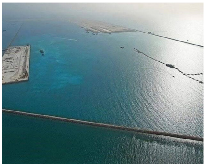
كما نود الإشارة الى ان الوزارة وقعت اتفاقيات بحرية مع المملكة العربية السعودية بعد استحصال الموافقات الرسمية من الجهات