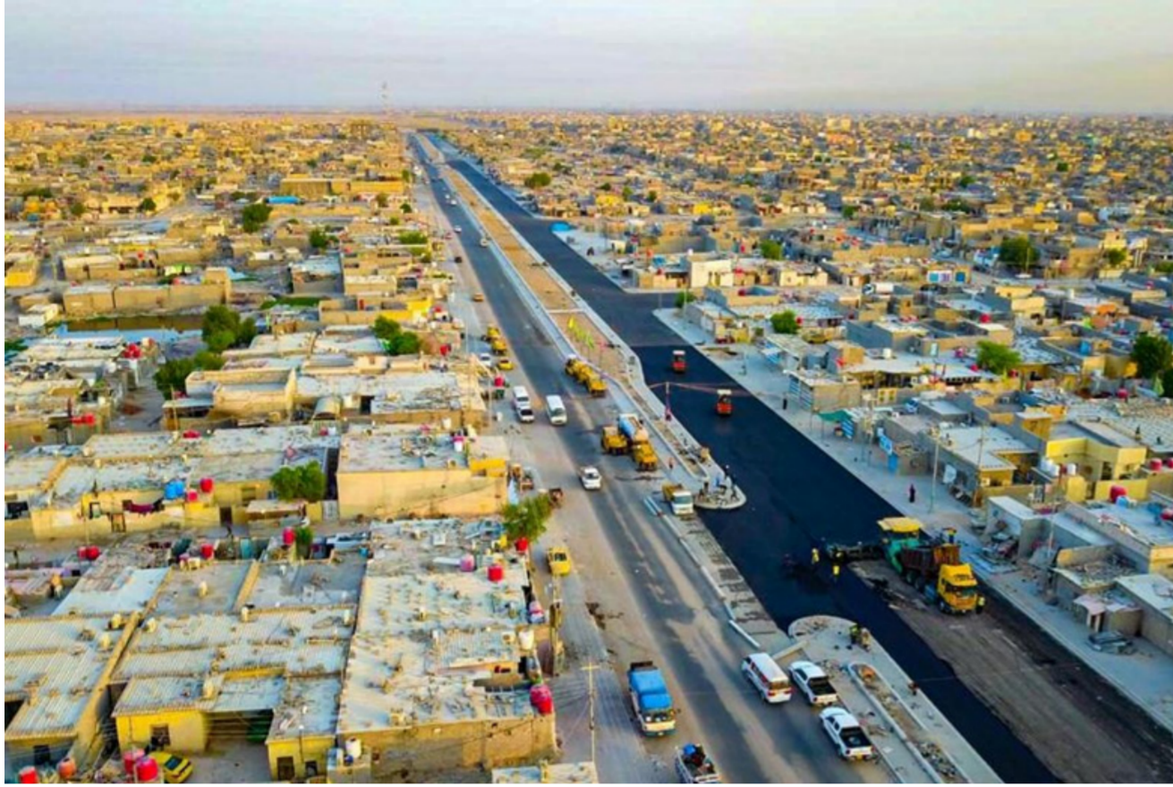
شركة النرجس خلال تنفيذ اعمال الطبقة الاساس في شارع القائم في البصرة

وجميع الشوارع المحورية والرئيسية فيها. وأشار إلى أن الشركة عازمة على إنجاز المشروع قبل الفترة المحددة له مؤكداً في ذات الوقت عن إكمال بقية الفقرات في العقد المبرم خلال الأيام القادمة وتسليمه إلى بلدية البصرة كونها الجهة المستفيدة.