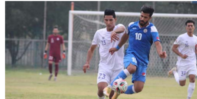
لقطة من دوري الممتاز