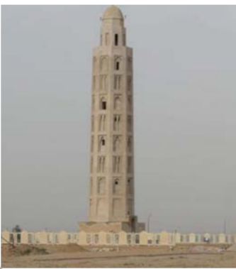
على الآثار على إعادة بنائها على شكل مراحل. العمل الذي يشمل رفع الانقاض وتنظيف الموقع من مخلفات التفجير

وأشار الدليمي إلى أن مفتشية آثار وتراث الأنبار باشرت بإعداد كشوفات لإعادة بناء مئذنة عانه الأثرية وتم المصادقة من قبل الهيئة العامة للآثار والتراث / دائرة الصيانة والحفاظ