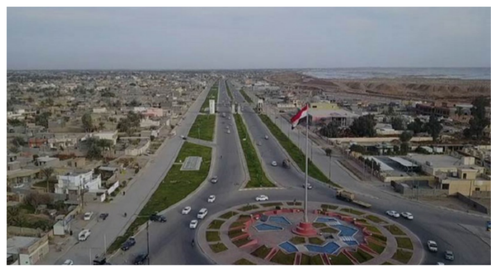
وجود معظمها على ضفاف نهر الفرات مع وجود مسطحات مائية وجبال سما يؤهلها لنجاح هذه التجربة التي غابت كثير عن أذهان الحكومات السابقة".