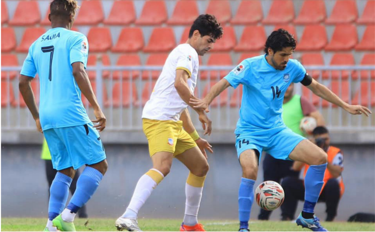
لقطة من الدوري الممتاز

من جهتها، أعلنت الاتحادات الفرعية تأييدها للمطوق لكل القرارات التي يتم اتخاذها بما يتسجم وقانون ٢٤ لسنة ٢٠٢١، وكذلك النظام الأساسي في الاتحاد. وإن تطبيق البنود القانونية من قبل أعضاء الاتحاد سيكون بمثابة الدافع الكبير