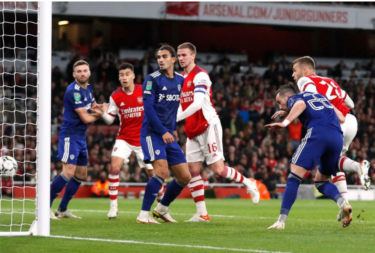
جانب من مباراة أرسنال وليدز

تشيلسي غلق ملف التعاقد مع مدافع جديد لصالحه قبل من جهته. أكد ييب جوارديولا المدير الفني لمانشستر سيتي، أنه لا يستخف بمنشور فريقه في كأس رابطة المحترفين الإنكليزية. وذلك قبل مواجهة وست هام في دور الـ 16.. وتوج المان سيتي بلقب البطولة 6 مرات في آخر 8 مواسم، من بينها آخر 4 ألقاب. ونقلت وكالة الأنباء البريطانية بي إيه ميديا عن جوارديولا قوله «إنه أمر جيد. كأس رابطة المحترفين بطولة في هذا البلد نحن أدينا بنشكال جيد حقاً». وأضاف «فرنا باللعب للمرة الرابعة على التوالي، ولا نزال نشارك بها». وأنشأ «نعرف أي فريق سنواجه، وست هام على ملعبه. لذا لن تكون مواجهة سهلة». وأوضح «في الوقت ذاته نستعد من أجل محاولة الفوز بالمباراة، مثلما فعلنا في أي مباراة في أي بطولة».