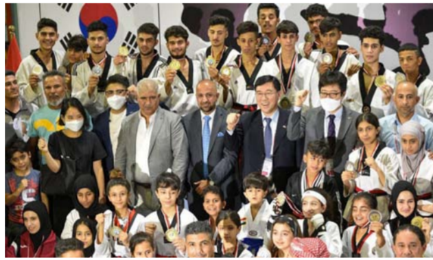
لقطة للمشاركين في بطولة السفير الكوري

ومدرسة كيم بالمركز الثالث، ولدى الرجال وخديدا بفئة الشباب استطاع نادي الشورجة الحصول على المركز الأول تاركا ثاني المراكز لنادي هاوكاري في جاء مركز بغداد ثالثا. وبفئة الناشئين تمكن نادي السياحة من الوقوف بالمركز الأول بتقدمه بفارق قليل من الميداليات على صاحب المركز الثاني نادي الميناء، في حين تساوى نادي الوصفية ونادي جيهان بالمركز الثالث.