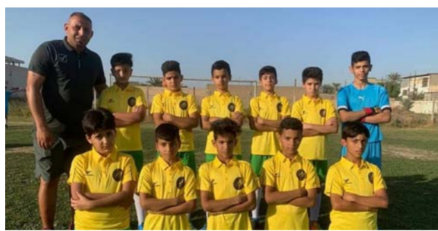
أكاديمية نادي العمال لاهب الكرة

التنافس الخارجي، وأسفرت النتائج النهائية عن تحقيق نادي السليمانية الترتيب الأول بفئة المتقدمين واحتل نادي الكهرباء ثاني المركز بينما جاء نادي العربي ثالثا. واستطاع نادي فئات دهبوك احراز المركز الأول بفئة الشباب وغاز الشمال ثانياً وتقدم مركز بغداد للمركز الثالث في ختام جميع الأوزون في فئة الناشئين جاء نادي فئات دهبوك اولاً ثم نادي العربي ثانياً