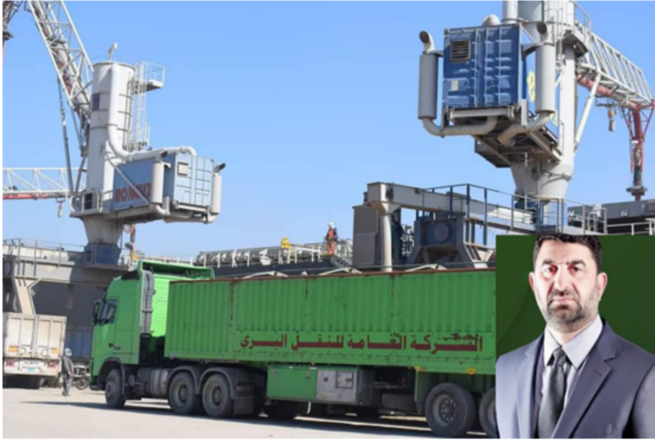
اسطول الشركة في مواقع العمل والى اليمين صورة مدير عام الشركة