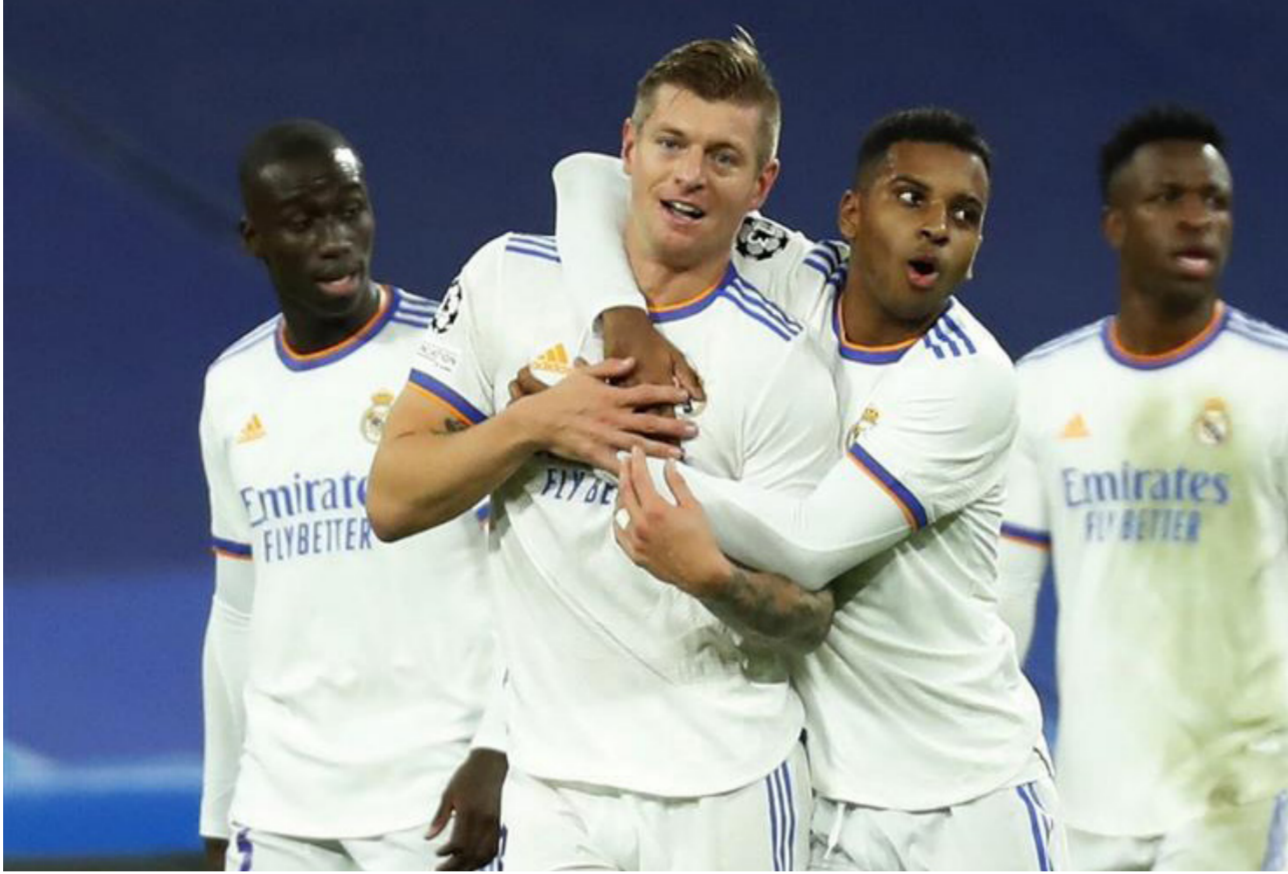
فرحة لاعبي ريال مدريد بالفوز

وبحسب شبكة «أوبتا» للإحصائيات، فقد سجل جريزمان هدفه الرابع في 5 مباريات مع أتلتيكو مدريد بدوري أبطال أوروبا هذا الموسم، وهو نفس عدد أهدافه مع برشلونة في 16 لقاء على مدار موسمين بنفس البطولة، ورحل جريزمان إلى برشلونة في صيف 2019، مقابل 120 مليون يورو (قيمة الشترط الجزائي)، لكنه لم يظهر بالشكل المتوقع منه، فعاد إلى أتلتيكو في الصيف الماضي على سبيل الإعارة لمدة موسمين مع الإزمية الشراء.