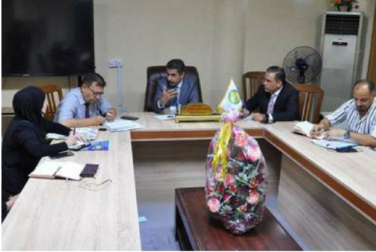
رئيس جامعة البصرة يستقبل وفداً من وزارة الصناعة والمعادن