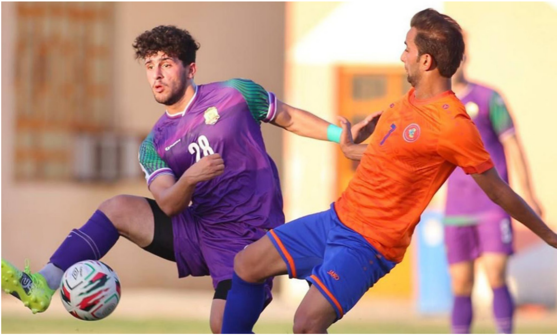
لقطة من مباراة الشرطة والكهرباء التجريبية