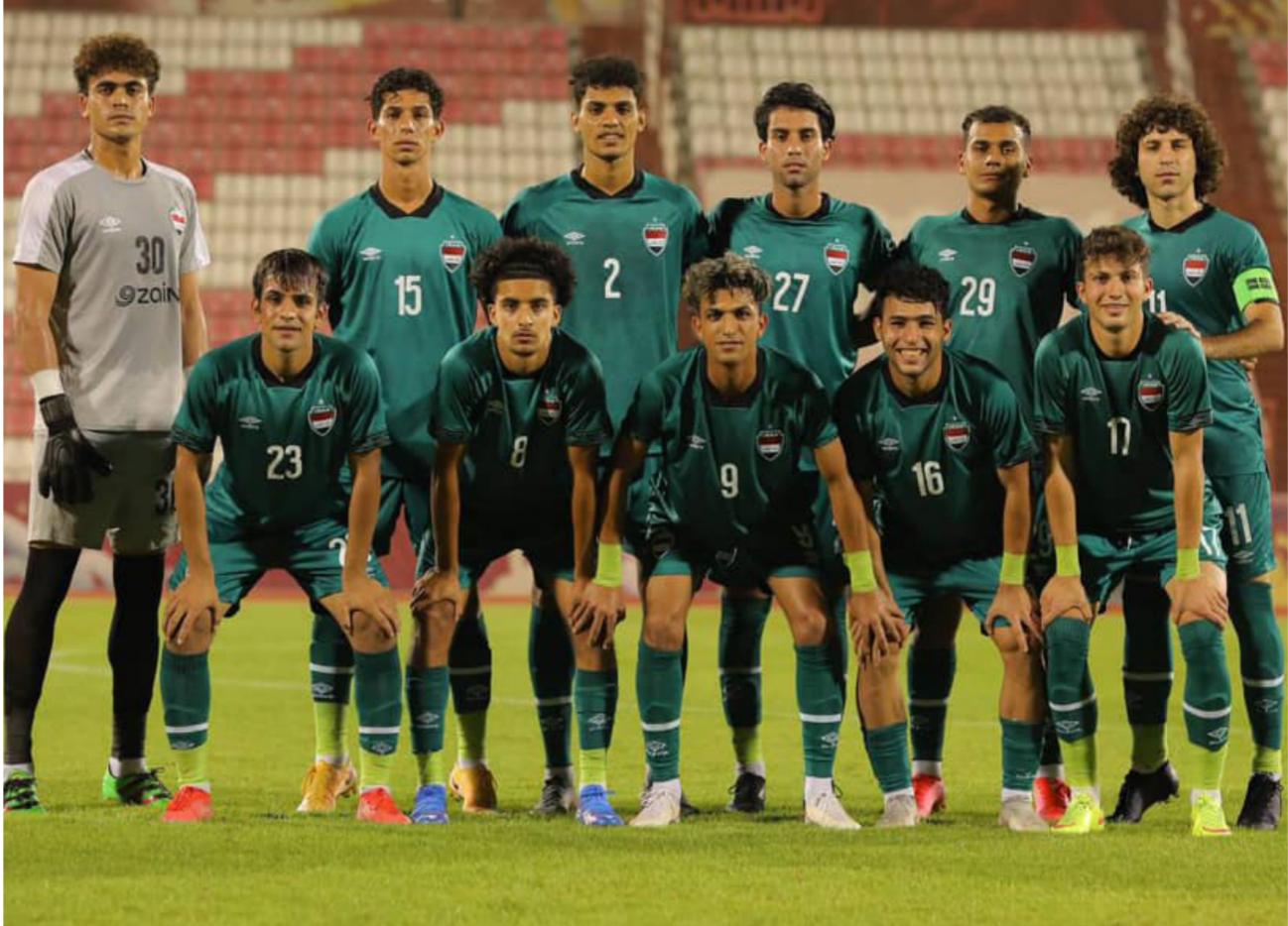
المنتخب الأولمبي لكرة القدم

أوقعت قرعة بطولة اتحاد غرب آسيا، تحت 23 عاماً في نسختها الثانية، منتخبنا الأولمبي في المجموعة الثانية إلى جانب منتخبات لبنان والإمارات وفلسطين. وستقام البطولة بضيافة الإتحاد السعودي في مدينة الدمام حديداً خلال المسدة من 4 إلى 12 تشرين الأول 2021. بمشاركة 11 منتخباً، ويتأهل صاحب المركز الأول من كل مجموعة للمجموعات الثلاث لسدور نصف النهائي، إلى جانب أفضل فريق صاحب المركز الثاني. وتم اعتماد نظام القرعة الموجهة، حيث تم وضع المنتخبات التي وقعت بالمجموعة نفسها في التصفيات المؤهلة لنهائيات كأس آسيا تحت 23 عاماً المقررة في أوزبكستان 2022. بمجموعات مختلفة في الدور الأول من بطولة اتحاد غرب آسيا. وعادت بعثة منتخبنا الأولمبي لكرة القدم، مساء الثلاثاء الماضي إلى بغداد، بعد اختتام معسكر تركيا، وكذلك خوض وديتي الإمارات الأولمبي في الإمارات، والتي تاتي ضمن خضيراته لبطولة غرب آسيا تحت 23 عاماً التي ستقام بداية الشهر المقبل في السعودية. وكذلك التصفيات الآسيوية المؤهلة لنهائيات آسيا تحت 23 عاماً. ودخل منتخبنا الأولمبي معسكرًا تدريبيًا في مدينة أزميت التركية استمر للفترة من 21 آب ولغاية الثاني من الشهر الحالي مع خوض ثلاث مباريات ودية مع منتخب ليبيا الأول ونيغدة اندول التركي والساحل الكوبي.