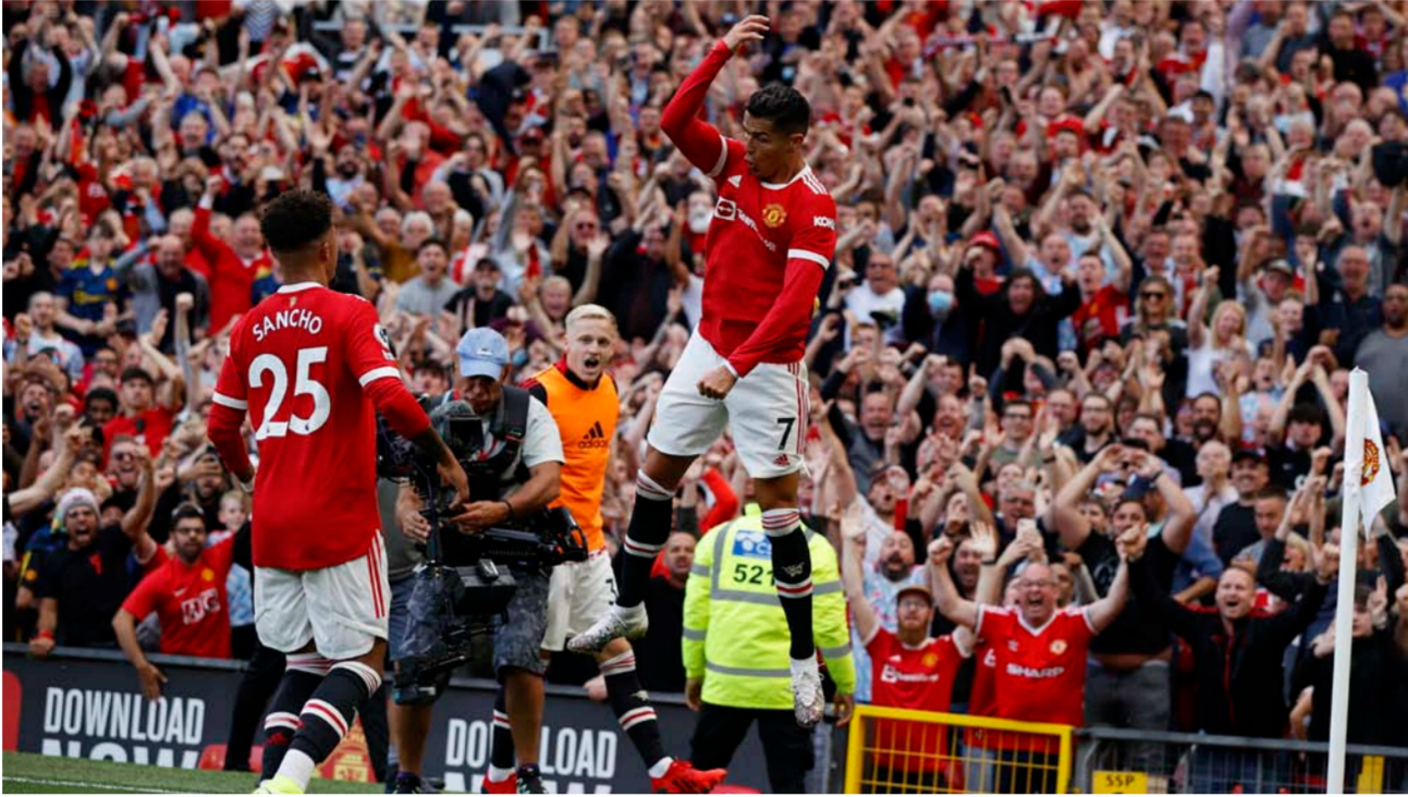
رونالدو يحتفل بالفوز

هدف موراتا جاء في الدقيقة 10، بعد خطأ فادح من كوستانس مانولاس مدافع نابولي، الذي مرر كرة خاطئة إلى حارسه أوسبينا لينجح موراتا في خطفها. ليتوصل من الجهة اليسرى، ويسدد في الشباك وذكرت شبكة «أوبتا» للإحصائيات، أن موراتا سجل ثاني أسرع هدف له بالدوري الإيطالي. موضحة أن هدفه الأسرع جاء في كانون الثاني 2016 ضد كييفو فيرونا بعد 6 دقائق.. وخسر يوفنتوس المباراة بهدف مقابل هدفين لنابولي سجلهما ماثيو بوليتانو في الدقيقة 57 وكاليدو كاليباني في الدقيقة 86.