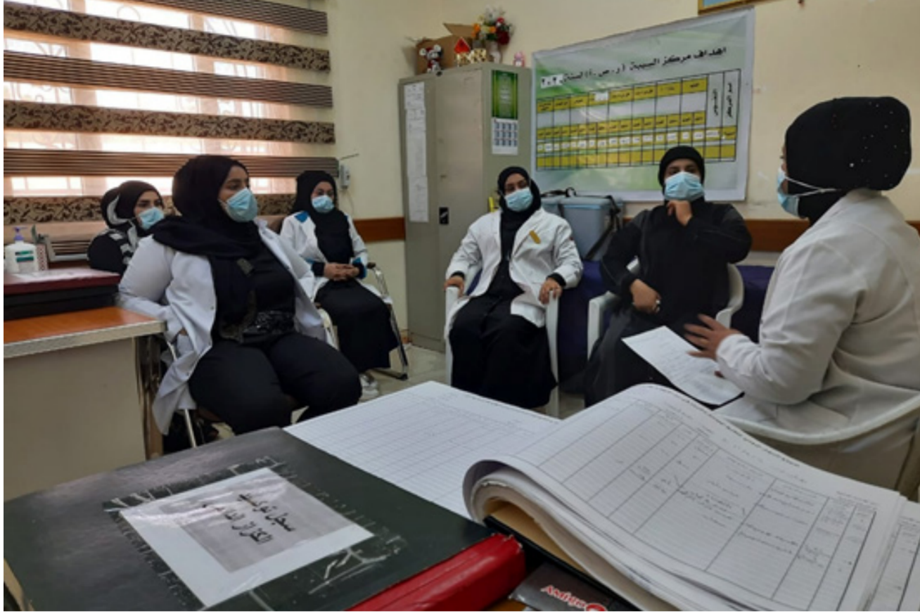
جانبا من محاضرة مركز السببية الصحي حول تنظيم الاسرة