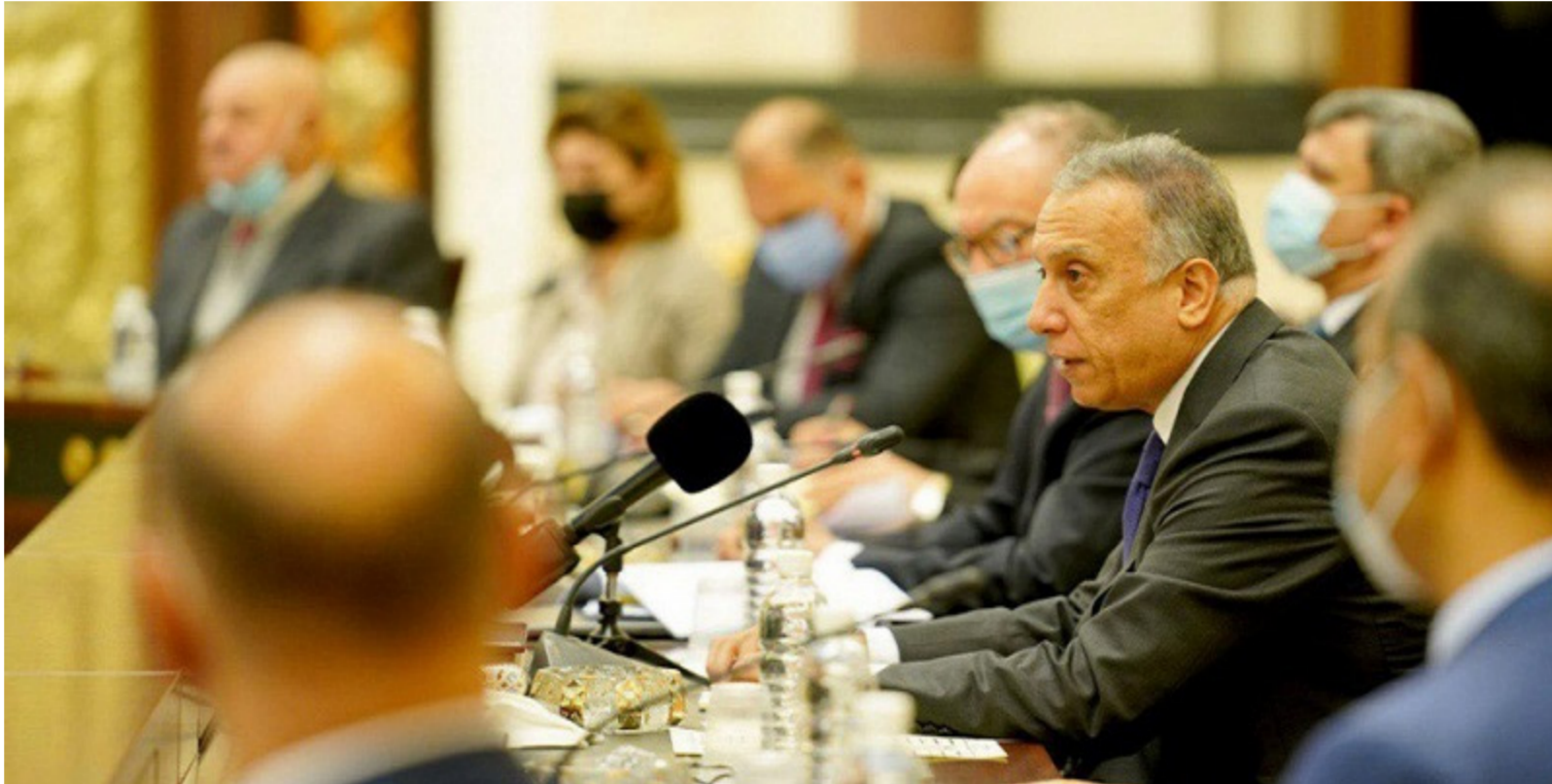
الكاظمي في اجتماع مع قادة الكتل

فيها جميع القوى المؤثرة ومنها التيار الصدري. وهو ما أكدت عليه التجارب الدولية، والوضع الحالي لا يتحمل المزيد من التعقيد". يذكر أن رئيس الوزراء مصطفى الكاظمي قد أكد أمس الأول عن الانتخابات ستكون في موعدها المقرر وهو العاشر من شهر تشرين الأول المقبل ولا توجد هناك نوايا للتأجيل.