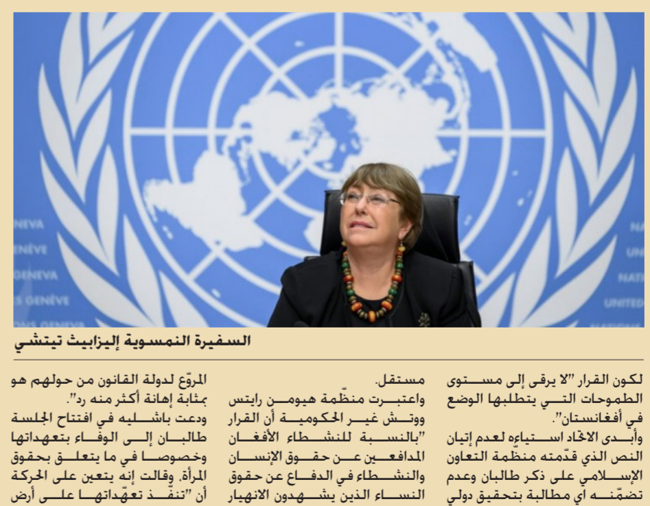
السفيرة النمساوية إليزابيث تيتشي

الواقع". وأوضحت المفوضة السامية لحقوق الإنسان أن "طريقة معاملة طالبان للنساء والفتيات واحترام حقوقهن بالحرية وحرية التنقل والتعليم والتعبير والعمل وفقاً للمعايير الدولية على صعيد حقوق الإنسان، مستشكلة خطاً أحمر". وأضافت أن "ضمان حصول الفتيات على تعليم ثانوي ذي نوعية عالية سيشكل مؤشراً أساسياً للالتزام" طالبان احترام حقوق الإنسان، داعية إلى حكومة "شاملة" تضمن تحيلاً نسائياً هاماً. وخلال المناقشات قدمت نحو 60 دولة نصاً لإعلان مشترك لتنه السفارة الإنسانية إلى الأمم المتحدة أوروبا دياز-راتو، يطالب خصوصاً بالوقف الفوري لعمليات الاغتصاب التي تستهدف مدافعين عن حقوق النساء، وتقدمت للجنة الخاصة حول أفغانستان بطلب من باكستان بصفقتها منسقة لمنظمة التعاون الإسلامي حول حقوق الإنسان والمسائل الإنسانية، ومن أفغانستان الممثلة بالدبلوماسي والدول الأخرى".