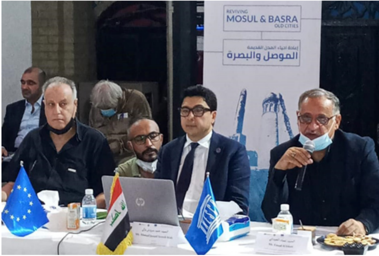
جانب من اجتماع اليونسكو لتأهيل الدور التراثية في البصرة

المطلوب بعد ان اعتبها تراكمات عشرات السنين التي مرت على بنائها واهوار معالمها الحضارية وبالتأكيد سينشط الجانب الاقتصادي فيها وستشغل الأيدي العاملة وباعداد كبيرة كما ان عمليات تأهيل الشباب التي حققتها منظمة اليونسكو عبر مركزي التدريب تعد خطوة مهمة لتأهيلهم في الأعمال المطلوبة للمشاركة في عملية اعمارها وكلنا كحكومة محلية ودوائر مختصة بمد يد العون لمنظمة اليونسكو في مهمتها الكبيرة هذه وتذليل كل الصعاب لتظهر للعالم السياحية لهذه البيوت وسنشكل لجنة لتهيئة البيوت التراثية الأخرى التي تم اختيارها من قبل المنظمة والدوائر المعنية لتسهيل عملية التأهيل التي تقوم بها منظمة