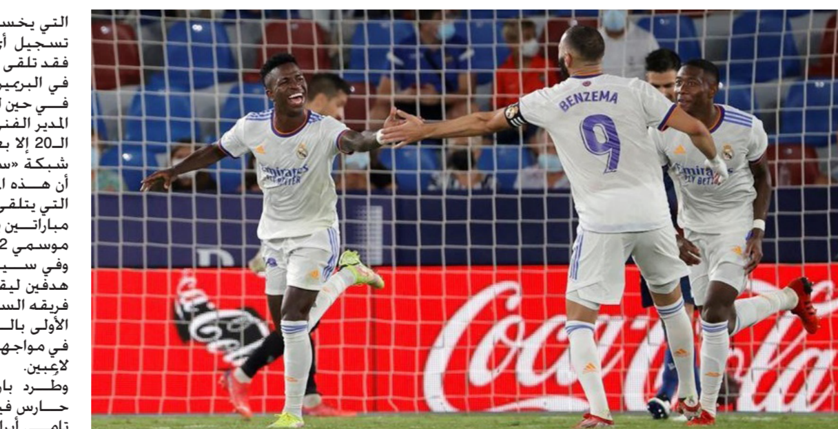
فينيسيوس جونيور ينطلق فرحا بتسجيل هدفين لريال

فان أرسنال سينتهي اليوم في أحد المراكز المؤدية للهبوط. وذلك للمرة الأولى منذ آب 1992. وأضافت الشبيكة. أنها المرة الأولى لأرسنال في موسمه رقم 118 بالدوري الممتاز