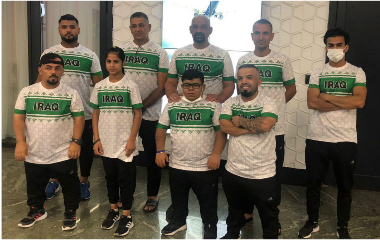
أبطال ألعاب القوى في البارالمبية

من باب المجاملة باستقبال رئيس اللجنة البارالمبية وليس البعثة العراقية. وزاد الغرزي المفروض بالسفارة تستقبل العراق كوننا في مهمة وطنية نتشرف فيها بتمثيل الوطن حالنا حال بقية الدول التي حظيت باستقبال كبير وتعاون منقطع النظير من قبل سفارات بلدانها بحضور السفير وأركان السفارة والدخول الى صالة المطار والمساعدة في الجاز الإجراءات الروتينية.