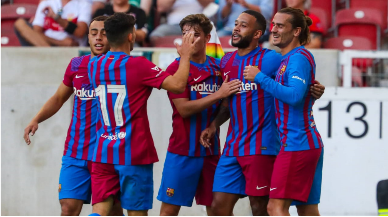
فرحة لاعبي برشلونة بالفوز

وفي سياق آخر أبدى الدولي النمساوي دافيد ألبا لاعب ريال مدريد، مسعاده بعد الانتصار الذي حقق في مباراته الأولى مع المريخي على حساب ديورتيفو الأفييس، وتغلب رسال مدريد، على الأفييس بنتيجة 4-1 في الجولة الأولى بالدوري الإسباني، وضع ألبا الهدف الرابع لريال مدريد، الذي سجله البرازيلي فينيسوس جونيور، ونشر ألبا عبر حسابه على «تويتر» صورة له مع كريم بنزما، وكتب عليها: «أول مباراة في دوري الإسباني وأول انتصار». وأضاف: «الليجا هي الليجا، جميعاً، لذلك يجب أن نستمر بهذه الطريقة، هيا».