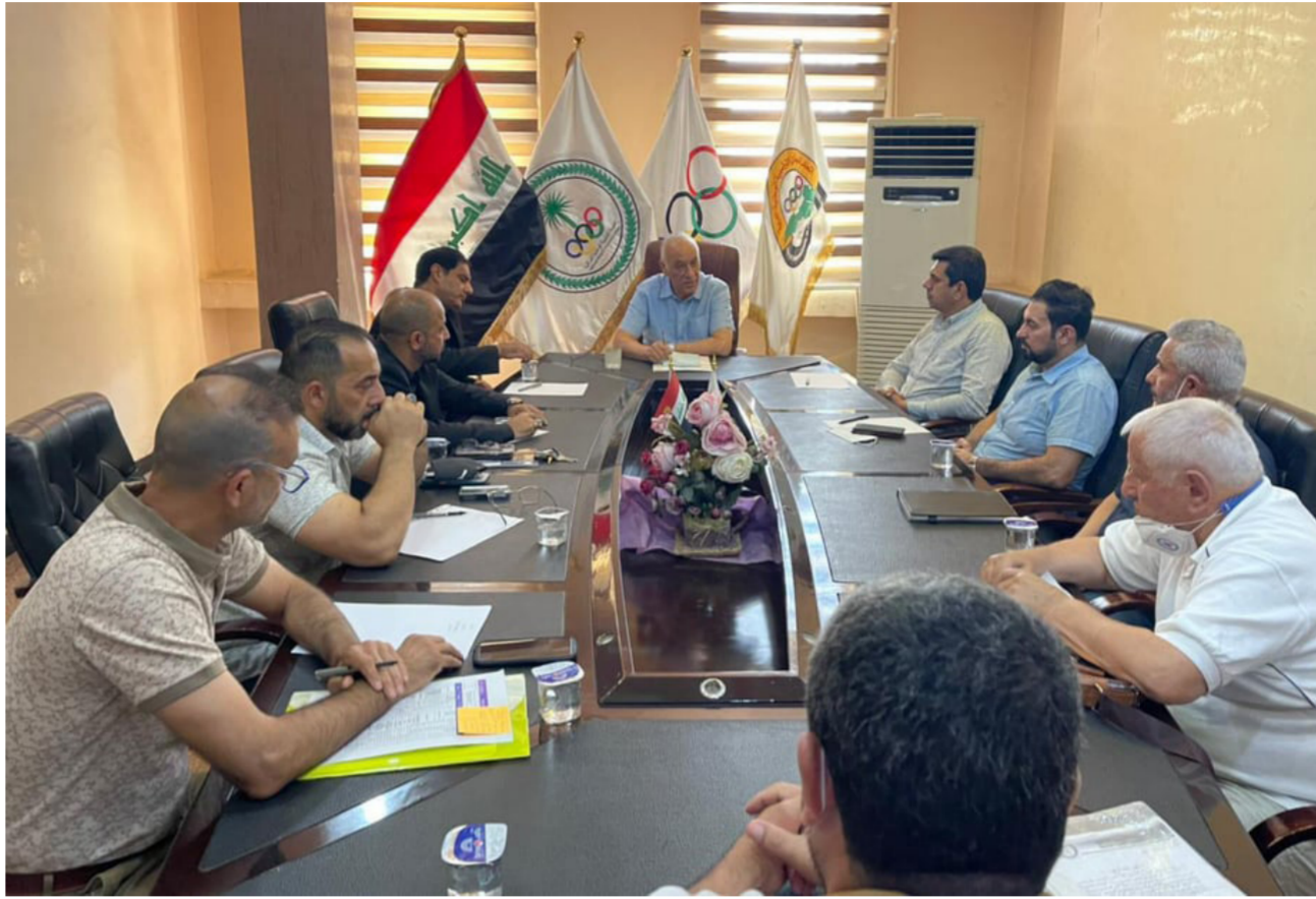
الأولمبية تعقد اجتماعاً مهماً