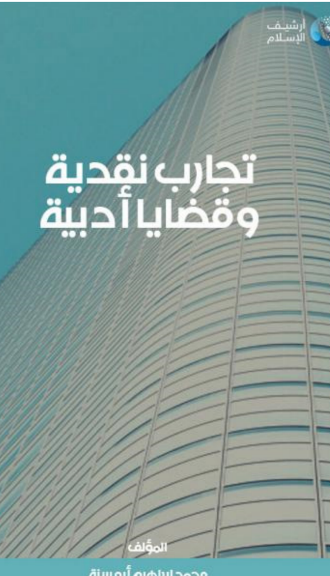
مجددناؤم أبوسنة المؤلف

غير أن أهم فصول هذا الجزء، الذي جاء بعد عودة التيار، هو «نحن والثقافة الغربية» لأنه موضوع لم يزل الحديث عنه طازجاً ومهماً، فهو يتعلق بكياننا وبوجودنا كعرب في هذا العالم، ولعل هذه الفقرة تمثل رأي المؤلف في المستقبل ككل. إنه يقول (ص 160): «إن شكل العلاقة بين ثقافتنا العربية، والثقافة الغربية تجسد في آلاف الوسائط ودون التفكير العميق في توجيه التأثير الغامر للثقافة العربية على موعود سعيد مع العصر الذي يعيشانه، ولكن يضعنا بعض الملامح للعصور التي سوف تقبل.