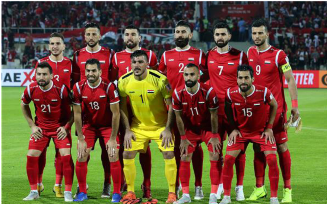
منتخب سوريا لكرة القدم