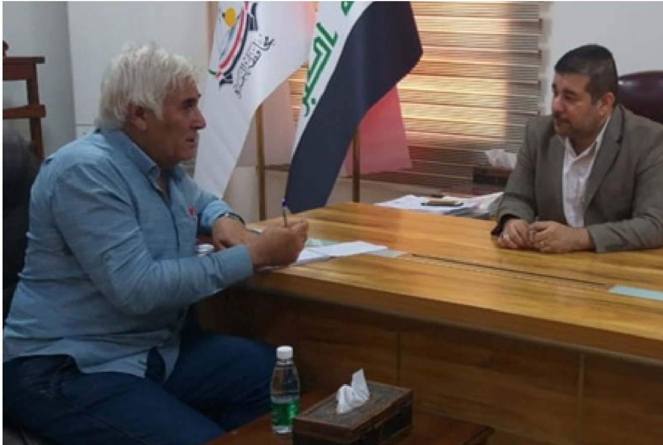
نائب محافظ البصرة الدكتور ضرغام الأجوادي يتحدث لمراسلنا في البصرة

وبعض الطرق الحالية تسمى (طرق الموت) لكثرة ما تشهده من حوادث ميمية بسبب عدم صلاحيتها. كما لا يربط بين شرق وغرب شط العرب إلا ثلاثة جسور، والحاجة بحاجة إلى تشييد 11 جسراً جديداً عوضاً عن جسور مؤقتة عائمة ومتهاكلة عن جسر مؤقتة عائمة ومتهاكلة