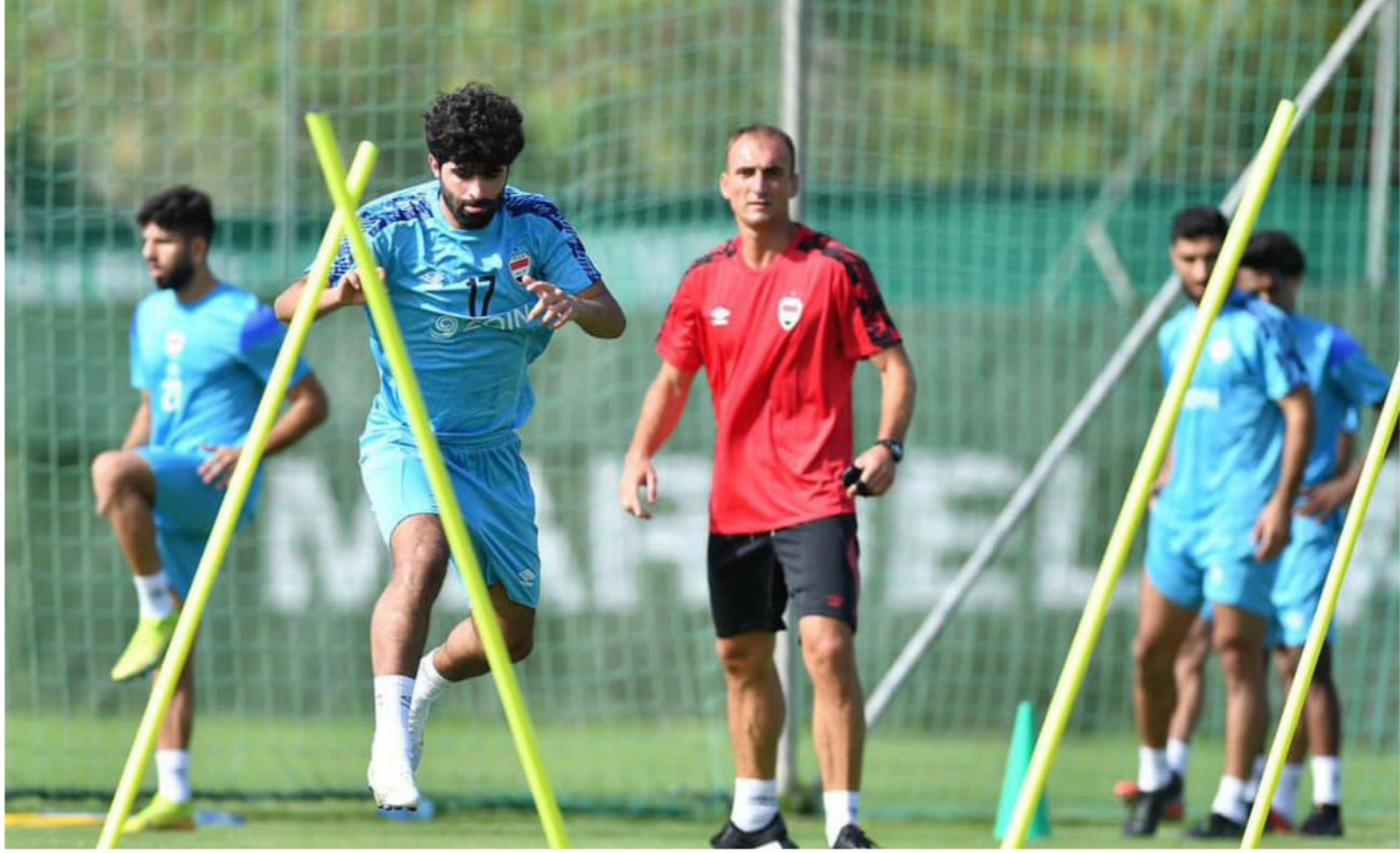
تدريبات المنتخب الوطني في معسكر إسبانيا

يواصل منتخبنا الوطني لكرة القدم تدريباته في معسكر ماربيا الإسبانية، وذلك تحضيراً للتصفيات الآسيوية المؤهلة لمونديال قطر 2022، وأنهى لاعبو منتخبنا الوطني الوحدة التدريبية الصباحية الأولى بقيادة المدرب الهولندي (ديك ادفوكات) وملاكه التدريبي المساعد، والتي شملت تمرين استشفاء، وذلك بعد رحلة السفر الطويلة للمنتخب والذي وصل لمدينة ملقا بساعة متأخرة من اللي، وسيخوض منتخبنا الوطني وحدات تدريبية منتظمة صباحاً ومساءً. لرفع جاهزية اللاعبين قبل الدخول في التصفيات الحاسمة التي ستبدأ بداية الشهر المقبل. وأكد المدرب الهولندي ديك ادفوكات أنه يسعى لقيادة المنتخب العراقي بلوغ نهائيات كأس العالم في قطر 2022، وقال ادفوكات في فيديو نشر عبر الصفحة الرسمية للاتحاد العراقي لكرة القدم على فيسبوك: «أتينا إلى إسبانيا لتستعد بشكل مثالي لمبارتي كوريا الجنوبية وإيران المقرتان في بداية شهر أيلول المقبل». وتابع: «تطمح لنهال إلى التوئيد ونجح فاروق على تحقيق هذا الهدف بشرط التزام الجميع والتحلي بالروح القتالية». وبين أنه أجرى أمس وحدة تدريبية خفيفة بعد يوم شاق وصلوا فيه إلى إسبانيا. وأكد أن «الأجواء طيبة هنا وسنباشر خضيرتنا بشكل