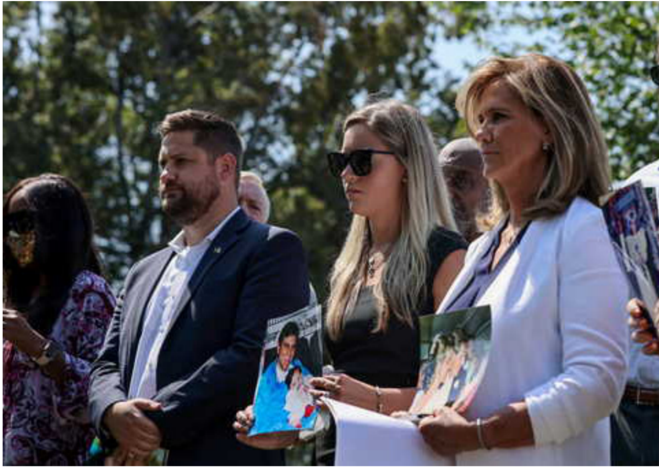
من اهالي ضحايا 11 سبتمبر