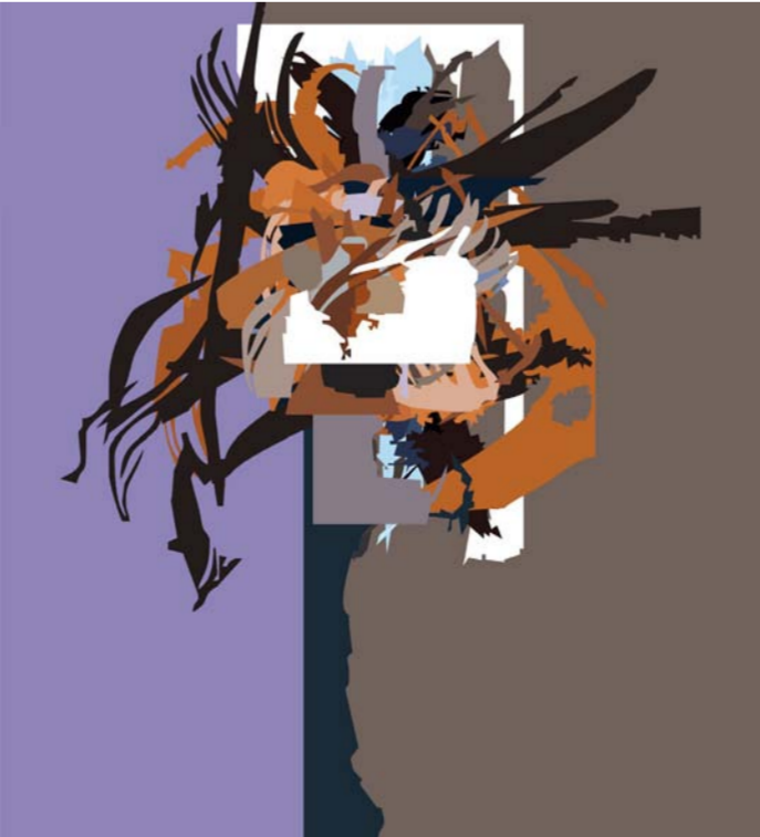
من اعمال الراحل أحمد الريبيعي