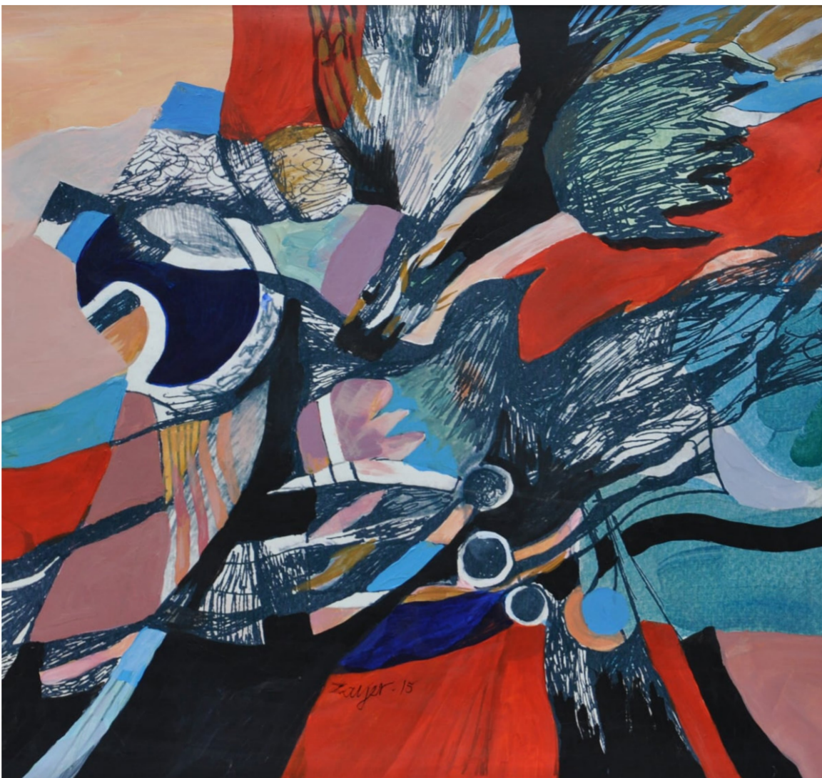
من اعمال الراحل اسماعيل زاير

معينة على مكان محدد. وفي تقديري نحن إذ نقف في ذلك الموقف إما نكون في ذروة جأواننا للماضي من خلال مثله بحيث لا توصف محاولة البحث عن « رؤية » الماضي إلا بوصفها نكوصا من هذه النقطة يبدو الجئوح إلى المستقبل فضيلة لا تُخد من قيمتها الخسائر التي يدفعها كل مستكشف، على الجانب العياني من عملي يمكن القول إن ثمة تماثلات جلية بين إجاز المستقبليين وغالبية فناني الحدثة التشكيلية في مختلف بلدانهم، فتقنيات العمل وتركيبته ونباه تعد الأكثر تمثلا للقيم التي كرستها الحدثة ما بعد الانطباعية، ولا أحد مستغرباً تلمس صلة في الشكل أو في الإنشاء الموضوعي للمستقبلي وبعض المستقبليين، رما جذ قرابة أكثر لي مع بوتشينيوني أكثر منه مع بالا ومارينيتي،إما من دون إسقاط المفهوم المستقبلي تلقائيا على توجهي ودافعي الفني الذي يختلف جوهريا والسبب هو إيماني العميق بضرورة التحرر من قيد المفهوم أو الأسلوب أو افتراضات المضامين الجاهزة، فعناصر مثل : الحركة والسعي لبناء المتنن والمكثف والخس الذي يلامس العفوية كلها حاضرة، أكثر من ذلك الانطلاق من موقع معرفي مترابط مع أشكال بعيدة للغاية عن العفوية المحتة أيضا. هنالك ما يمكن وصفه بتأكيد للهاجس الانطباعي - البصري كما يسميه بوتشينيوني، ببساطة متناهية :