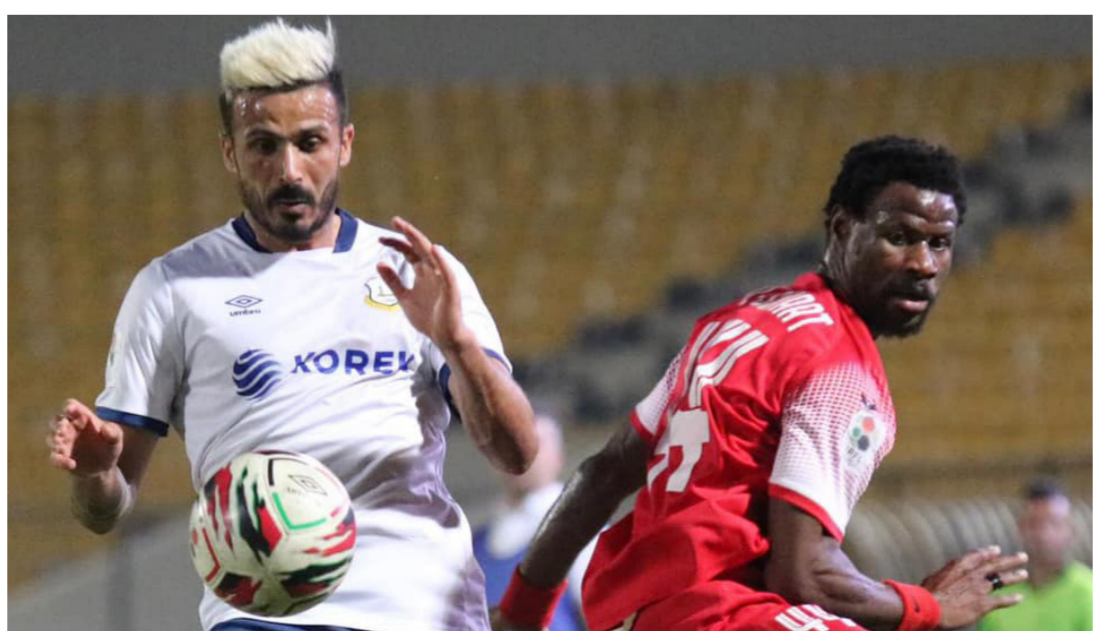
لقطة من مباريات دوري الكرة للموسم الماضي