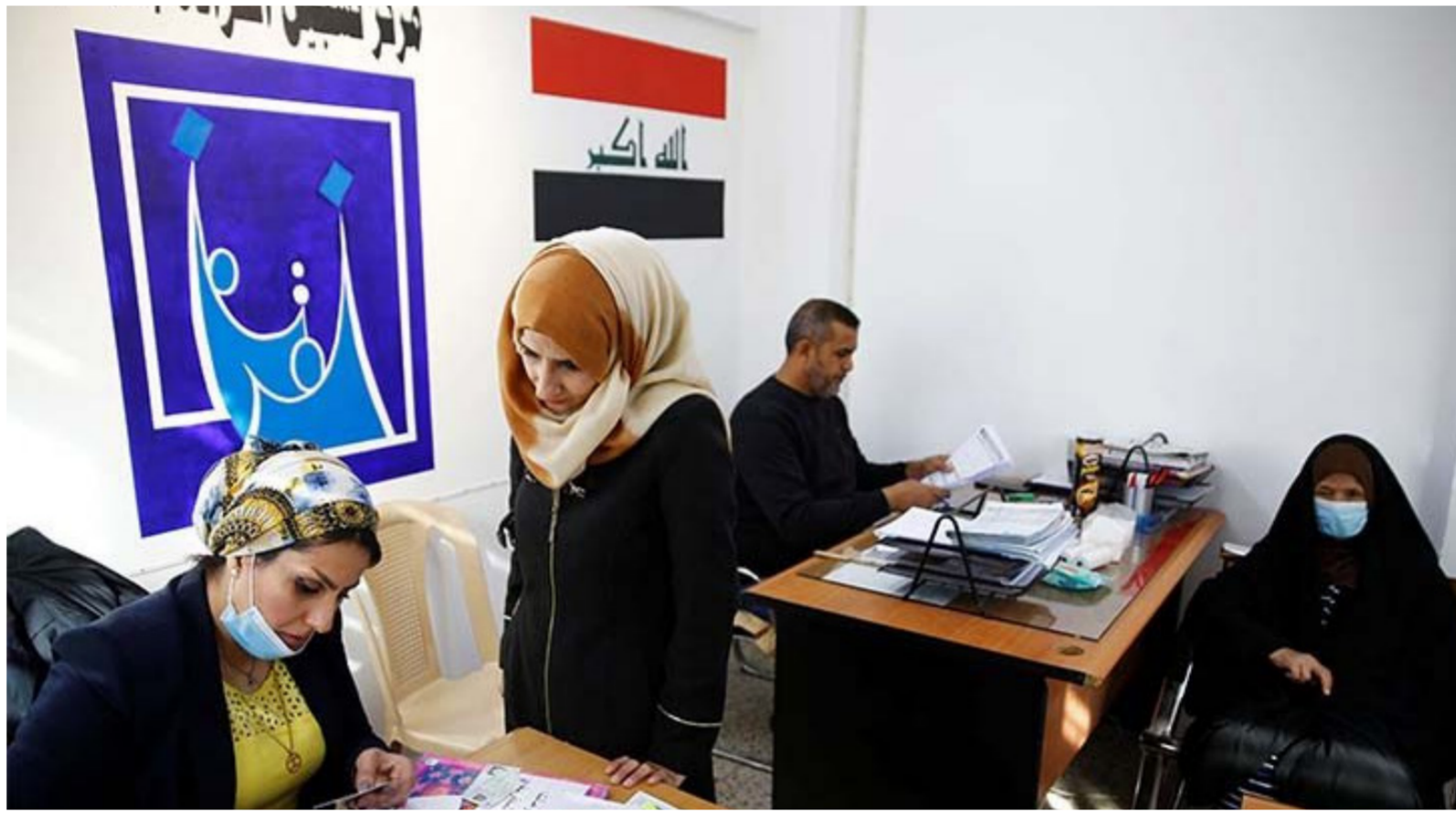
الانتخابات النيابية "ارشيف"

نعاني منها ليس استهداف الكتل السياسية أو مرشحها فحسب. بل لاحظنا أن الاستهداف قد تجاوز ذلك ووصل إلى القواعد الشعبية والمواطنين وهذا يسأله غير جيدة عن حرية الانتخابات وعلى الحكومة أن تمارس دورها في هذا الجانب".