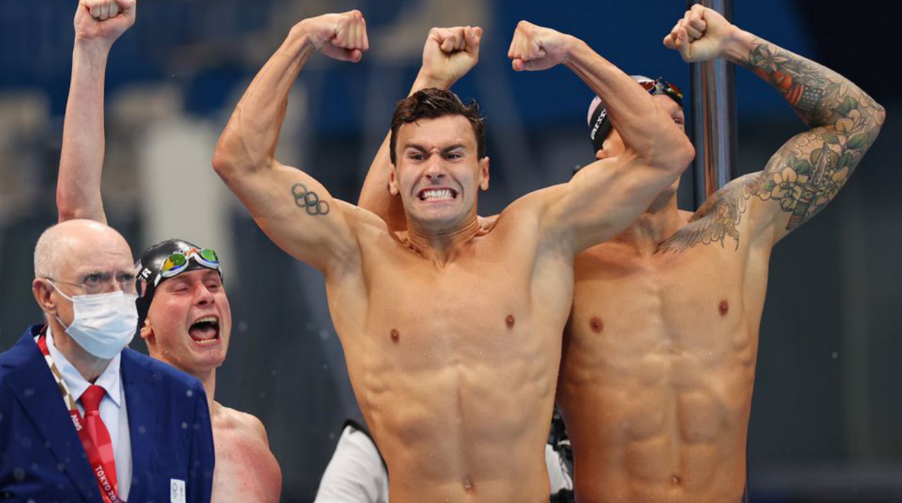
سيباحو اميركا يحتفلون بالإجاز

وتشهد طوكيو 2020 إقامة مسابقة فرق السيدات في السيف للمرة الثالثة في منافسات السلاح بالألعاب الأولمبية، وذهبت أول ميدالية ذهبية إلى أوكرانيا في 2008 والثانية إلى روسيا في 2016. وفشلت أوكرانيا في التأهل إلى طوكيو 2020.