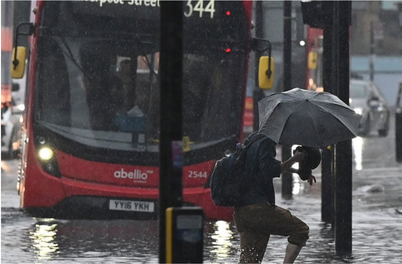
الفيضانات تغرق شوارع لندن