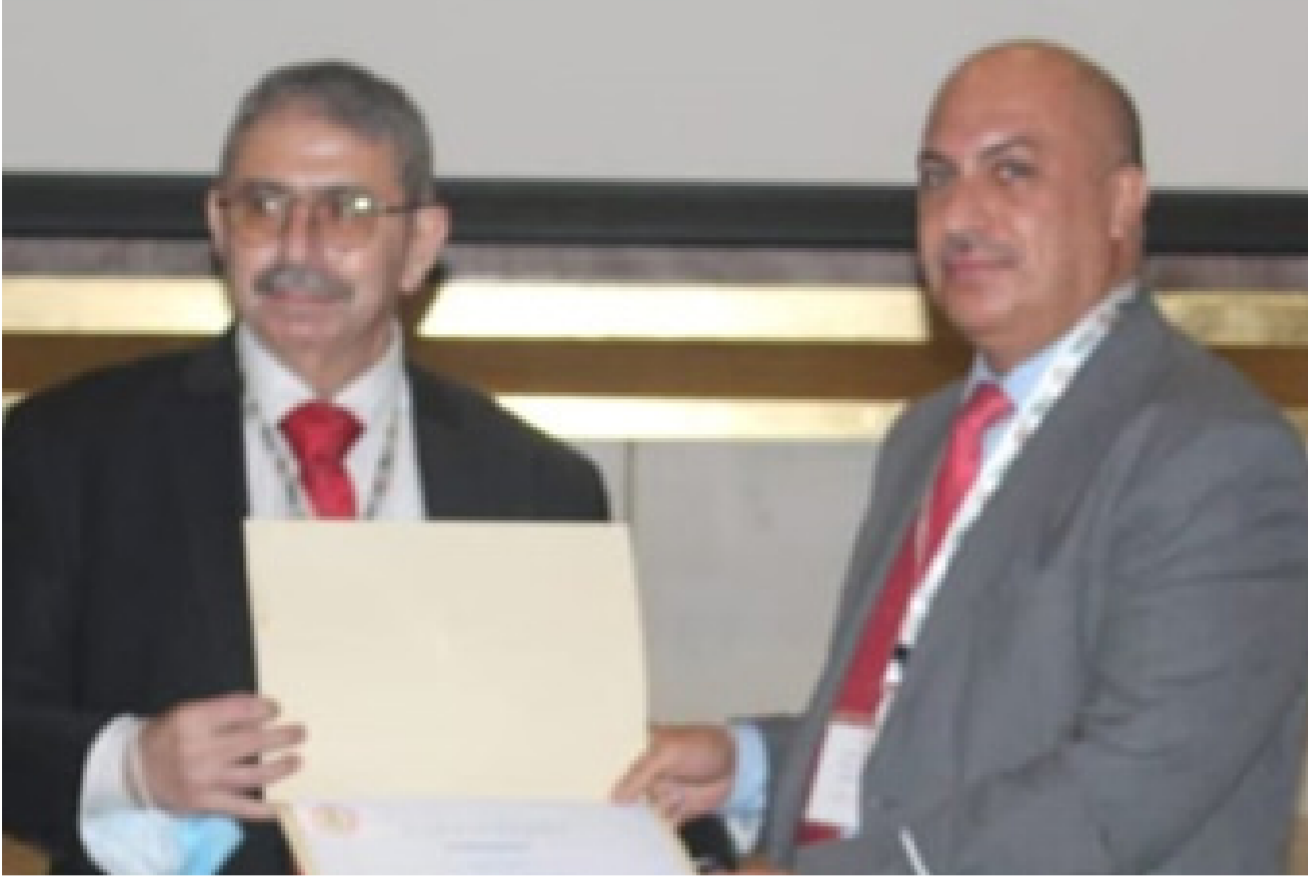
المعاون العلمي لكلية طب البصرة خلال مشاركته في مؤتمر المسالك البولوية

امكن لا تسبب انسدادات ولا تؤثر على انسيابية البول ب- قد تسبب الشعور بالألم بوصفها المرض بال ( ثقل ) في منطقة الخصرة . ث- قد تسبب قصورا في وظيفة الكلى في حال اهمالها لتكبر وتغلق حوض الكلى تدريجيا وبصورة صامتة . ث- قد تسبب التهابات متكررة في المسالك البولوية وقد تكون الالتهابات شديدة وتشمل الكلى وحوضها مع ارتفاع شديد في درجات الحرارة وتقيؤ وقد تكون هناك حرقة في البول مع زيادة عدد مرات التبول. ح- اذا كانت الحصاة صغيرة فسنسب نزولها الى الحالب كبيرة وقد تسبب انسدادا في مجرى الحالب مع مقص كلوي شديد . خ- التبول الدموي.