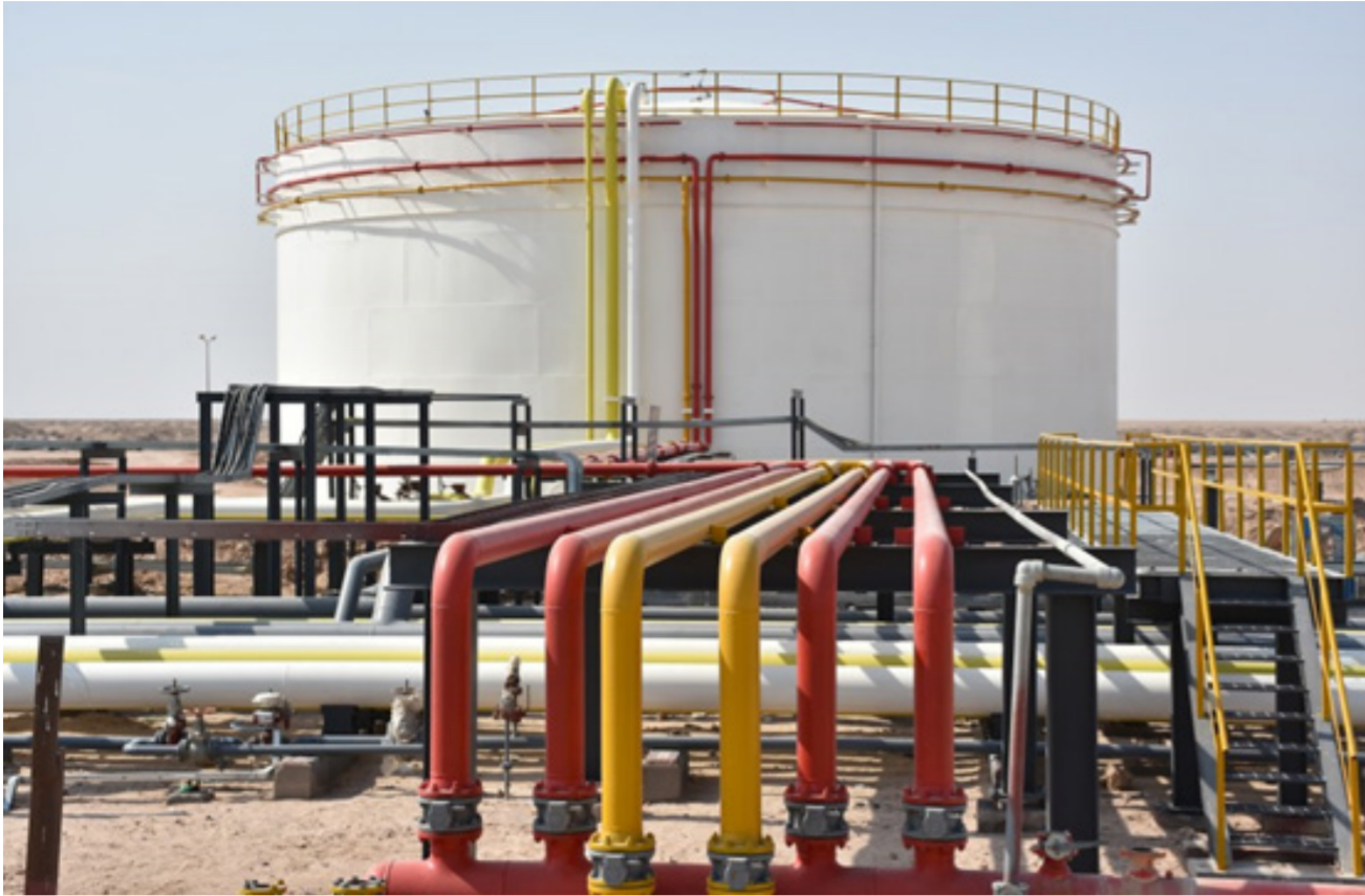
حقول النفط في البصرة

الصفيف. وهو ما سيعزز الأسعار. وفي مؤشر إيجابي للطلب على الوقود، سجلت بريطانيا أدنى إجمالي إصابات يومية جديدة بفيروس كورونا منذ الرابع من يوليو أمس الأول الاثنين، ما يشير إلى أن تنامي الإصابات في الأونة الأخيرة قد تجاوز ذروته.