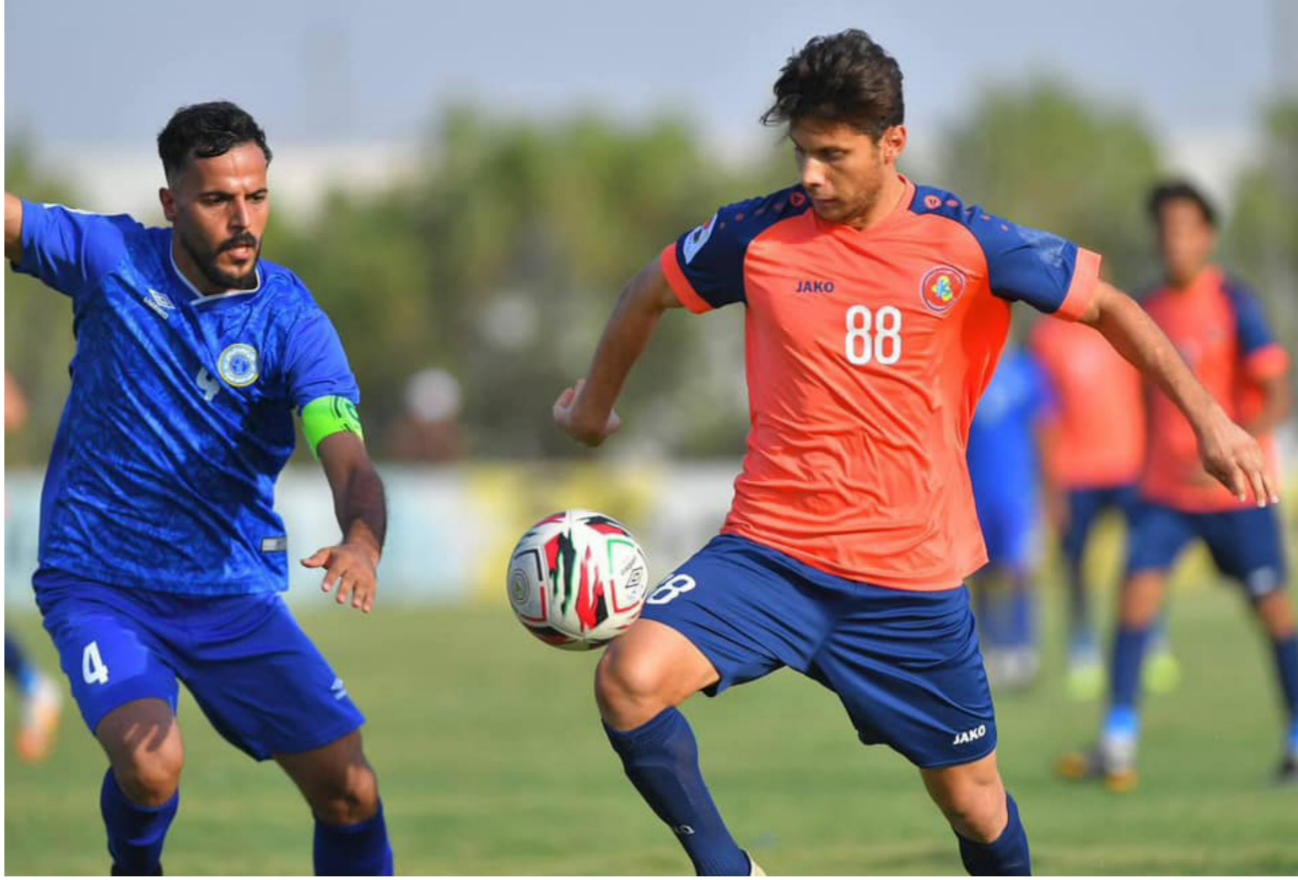
من مباريات دوري الكرة الممتاز