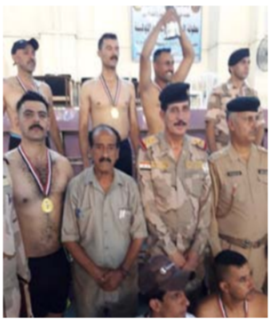
جانب من تتويج الفائزين

الأول فريق الكلية العسكرية الأولى مصنع الإبطال و الفريق الفائز الثاني فريق مديرية المدفعية اما الفريق الفائز الثالث فهو فريق مديرية الدروع البهجة اما النتائج الفرعية لقيادات الاسلحة حيث فاز بالمركز الاول فريق قيادة القوة الجوية والفائز الثاني فريق قيادة الفرقة السادسة والفائز الثالث فريق قيادة فرقة المشاة العاشرة وفي ختام البطولة وزع السيد ممثل السيد رئيس اركان الجيش المحترم اللواء الركن طارق بداي حسان مدير التدريب البدني والالعاب الجيش الحيات والايوسمة والكؤوس بين الفائزين في فعاليات البطولة.