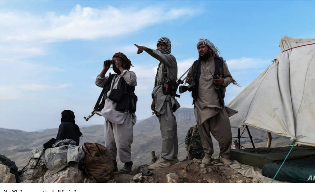
سيطرة طالبان تهدد حرية الاعلام