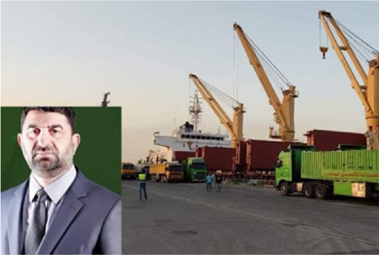
جانب من اعمال اسطول الشركة العامة للنقل البري والى يسار الصورة مديرها العام