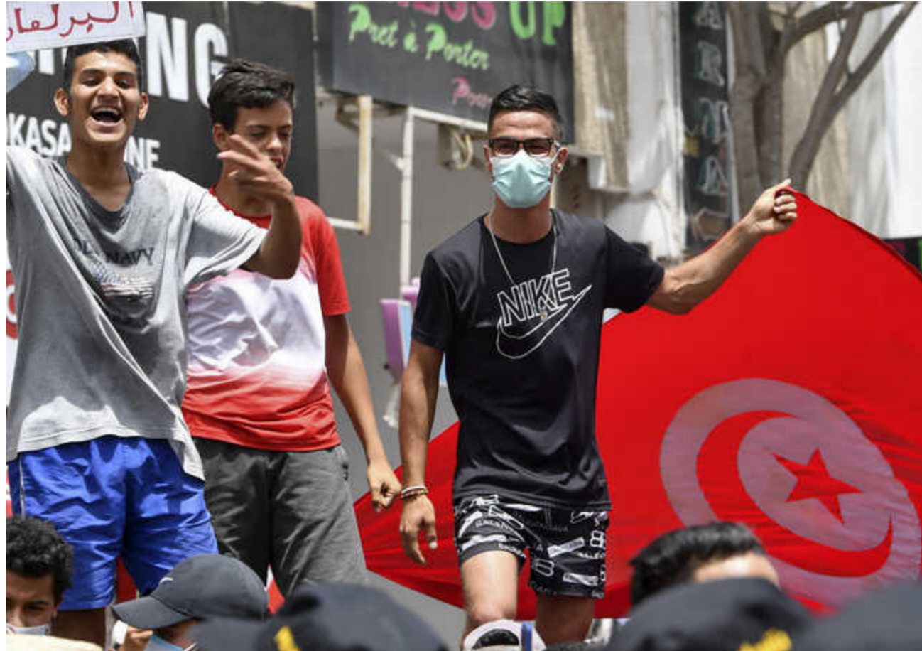
من صور الاحتجاجات على النهضة في تونس