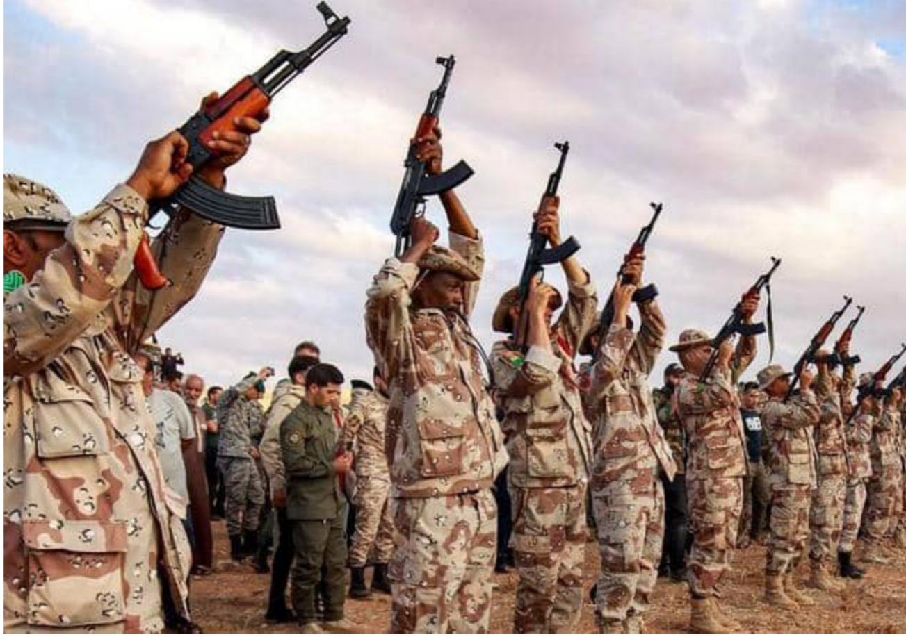
أفراد من الجيش الوطني الليبي