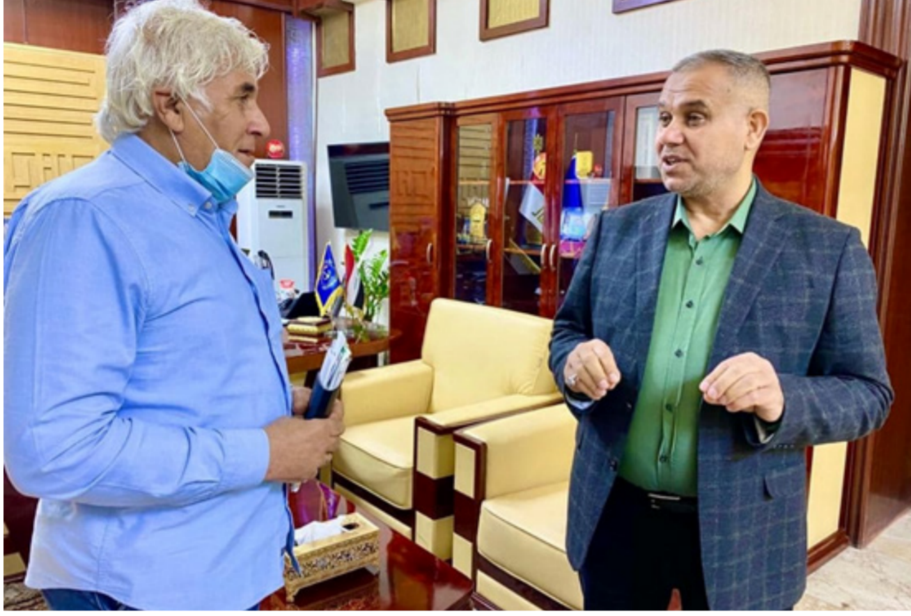
مدير عام شركة موانئ العراق يتحدث لمراسلنا في البصرة

وقال المدير العام للشركة العراقية خاضعة للمدونة الدولية: إن موانئنا خاضعة لإجراءات أمن السفن والموانئ وحسب تعليمات وشروط المدونة الدولية. وقال مدير عام الشركة العراقية خاضعة للمدونة الدولية: إن موانئنا خاضعة لإجراءات أمن السفن والموانئ وحسب تعليمات وشروط المدونة الدولية.